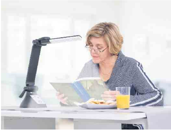
Entspanntes Lesen ist auch bei schlechter Sehkraft möglich - mit einer vergrößerten Brille und guter Beleuchtung.

Lupenhalbbrillen können die Sehkraft effektiv und unauffällig unterstützen