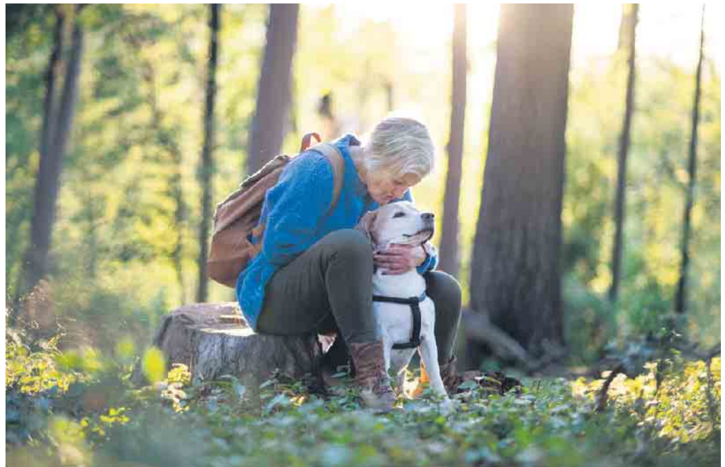
Der Körper braucht in allen Lebensphasen Bewegung, um gesund zu bleiben.

Um gesund zu bleiben, braucht der Körper in allen Lebensphasen Bewegung. Bei Frauen über 45 empfiehlt sich Yoga, moderates Ausdauertraining und leichtes Gewichtheben. Für gesunde Muskeln sind effiziente Mitochondrien besonders wichtig. Ist ihre Funktion