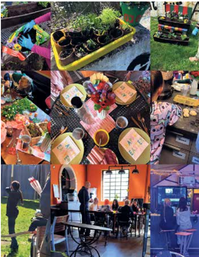
Fotocollage: Offene Kinder- und Jugendarbeit Overath.

Ein abwechslungsreiches und kreatives Osterferienprogramm bot die Offene Kinder- und Jugendarbeit in Overath in den vergangenen zwei Ferienwochen an. Zahlreiche Kinder und Jugendliche nutzten die Angebote und verbrachten gemeinsam aktive, kreative und erlebnisreiche Tage in den Einrichtungen.