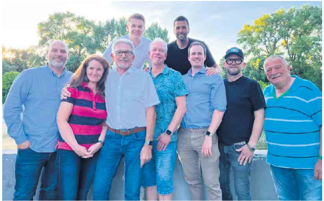
Der neue Vorstand der KG.

„Ich freue mich, dass es uns gelungen ist, die Weichen für die Zukunft