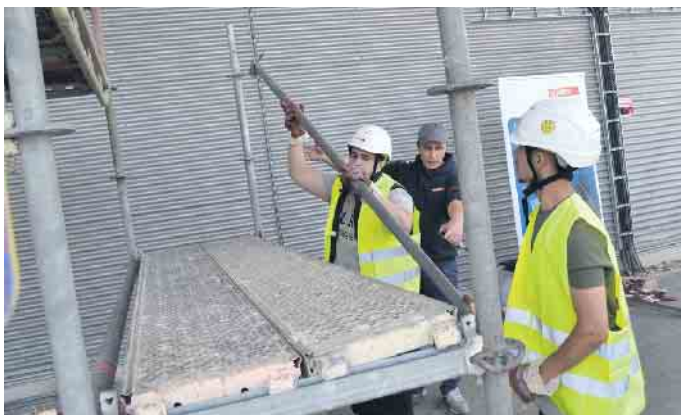
Für am Gerüstbau Interessierte stand ein Übungsgerüst parat.

„Vielleicht haben sie dabei auch etwas über ihre Zukunft gelernt“, so Wehrauch. Eigenart hat den Besuch für Schüler*innen der Kopernikusschule, der Johann-Amos-Comenius-Schule in Zündorf, der Adolph-Kolping-Hauptschule in Kalk und der Katholischen Hauptschule am Rhein in der Kölner Innenstadt ermöglicht. (Lars Göllnitz - der Autor bei Instagram: @enqoozee)