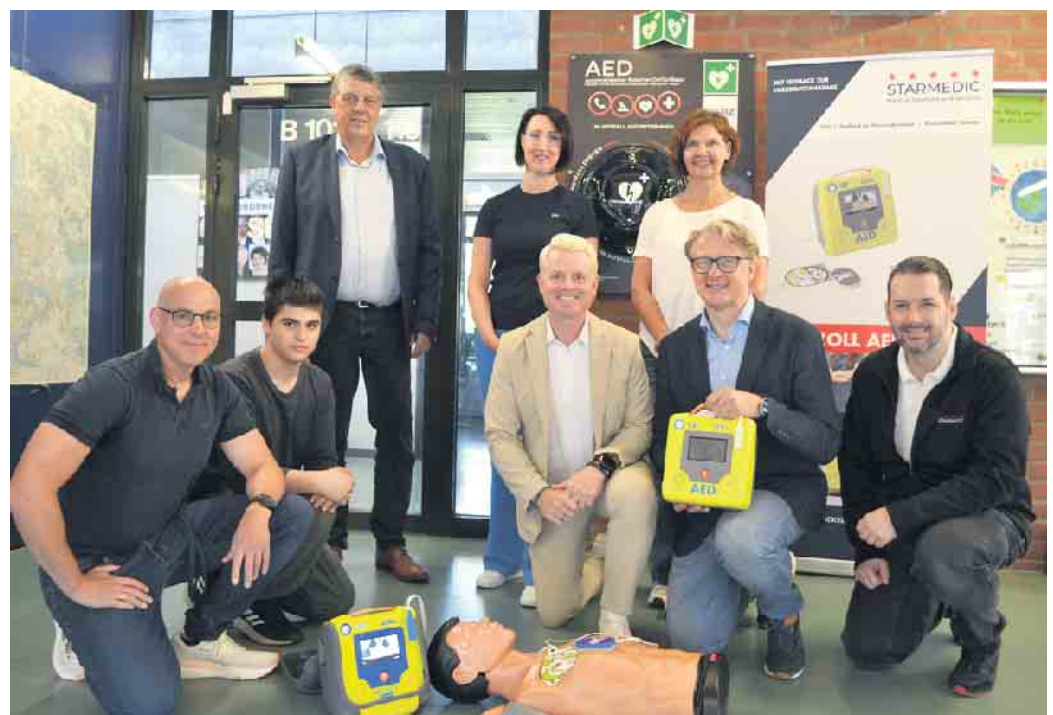
Mit der Lise-Meitner-Gesamtschule haben Krankenhaus Porz, seine Kardiologie und Guido Cantz die fünfte Schule im Stadtbezirk Porz mit einem Defi ausgestattet.