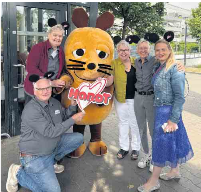
Die Maus mit den Mitarbeitern der Filiale der Bäckerei Hardt