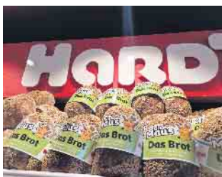
Mausbrot in der Auslage der Bäckerei

Stadtbezirk Porz - Gleich drei Termine in den Hardt-Bäckereien wurden angeboten.