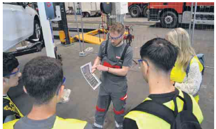
Mehr als 100 Schüler*innen besuchten Remondis in Niehl.