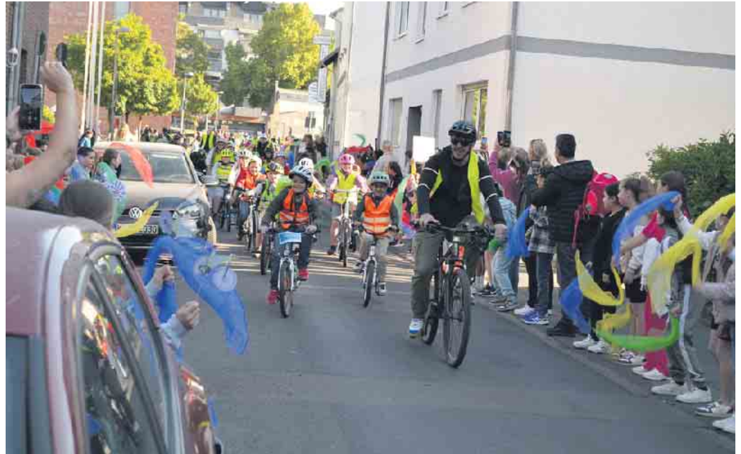
Ein Fahrradkorso durchfährt die von Eltern, Kindern und Pädagogen gesäumte Kupfergasse.

Vor allem auch Eltern sorgten für Verkehrschaos, räumt eine Mutter ein. Sie parkten in zweiter Reihe, verursachten Staus und gefährliche Situationen. Zudem werde die Kupfergasse oft als Umgehung für die Ampel an der Kreuzung der Kaiserstraße mit der Frankfurter Straße genutzt. Auch gegen die Einbahnstraße fahrende