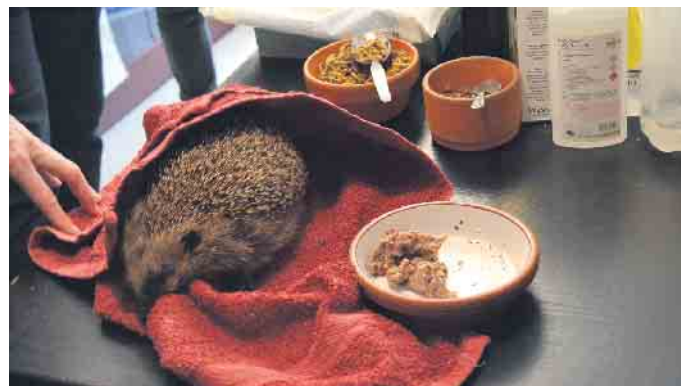
Auch Igel werden auf Gut Leidenhausen betreut.

„Die Arbeit der Stationen ist nicht nur fachlich anspruchsvoll, sondern auch mit hohem personellem und finanziellem Aufwand verbunden. Wer die Einrichtungen mit einer