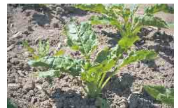
Ein Klassiker auf den Feldern im Rhein-Bogen: Zuckerrüben.

Das sieht auch Roth so: Nicht die Niederschläge seien das Problem. Eher, dass sie zu schnell die Region verließen. Die Stadt Niederkassel setzte so auf öffentlichen, aber auch auf privaten Grundstücken auf mehr Sickerflächen, weniger Versiegelung, so Kitz. Auf letzteren sei dies auch landesweit gesetzlich vorgeschrieben. Bezogen auf klimatische Veränderungen habe man den Boden gerade gut im Griff, so Landwirt Werres. Dennoch: Andere Kulturen anzubauen, sei eher schwierig. Es gehe ja auch immer um die Vermarktbarkeit, erklärt er. Daher setze man weiter auf veränderte Fruchtfolgen. „Die Landwirte im Arbeitskreis stellen dazu Versuche an“, berichtet Berater Achim Roth. (Lars Göllnitz - der Autor bei Instagram: @enqoozee)