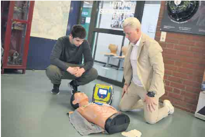
Der Defi leitet die Anwendenden per Stimmausgabe durch das Prozedere: so auch Moderator Guido Cantz am Vorführmodell.