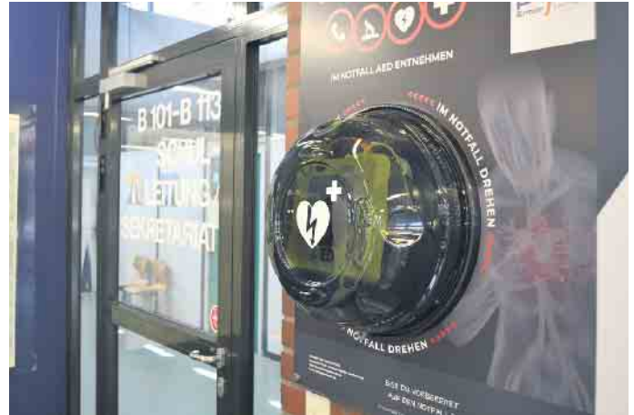
Der Defibrillator ist unter einer speziellen, abschraubbaren Box am Sekretariat der Schule angebracht.

Finkenberg - „Defi-Elektrode auf die entblößte Patientenbrust kleben.“ Im Ernstfall kann er Leben Retten, der Defibrillator. Und das mit reichlich Assistenz. Mit klaren Ansagen leitet die aus dem gerät erklingende Stimme die anwendende Person durch das Prozedere. In diesem Fall sind es Entertainer und Moderator Guido Cantz und ein Schüler der Lise-Meitner-Gesamtschule.