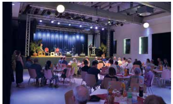
Geladene Gäste beim Festakt im großen Saal.