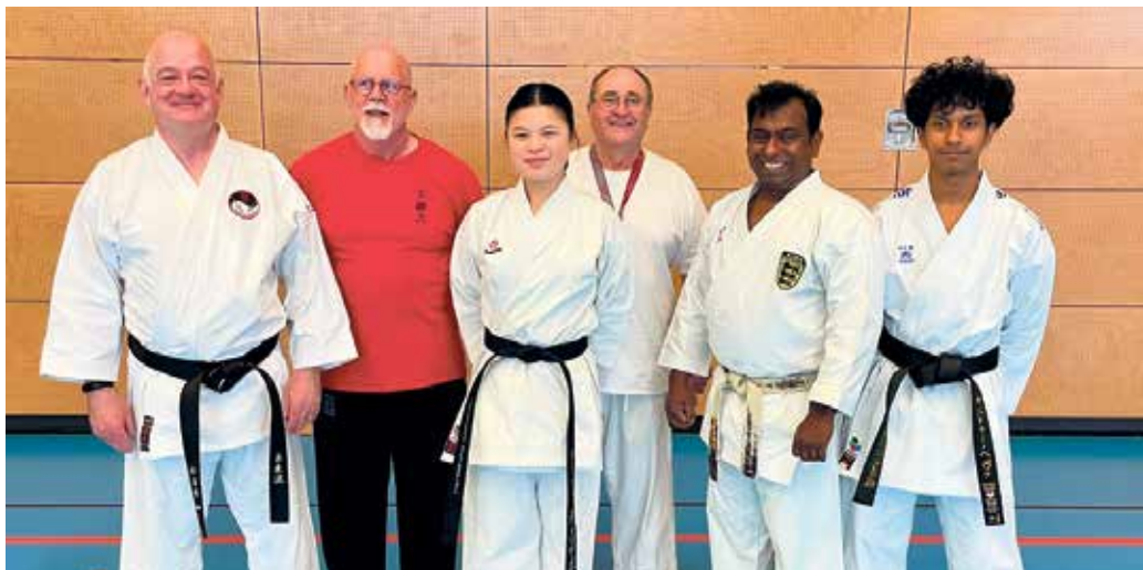
Das Team der Referent*innen beim Porzer Shito-Ryu-Tag.