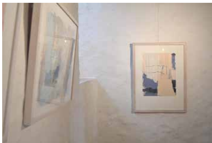
Die Entstehung ist ein Prozess des Reagierens. - Dagmar Wolf über ihre Malereien.