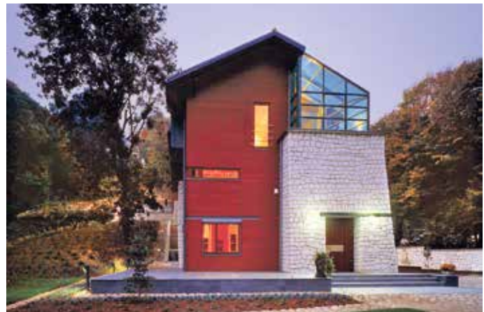
Glaselemente sind in der zeitgenössischen Architektur unverzichtbar.

Der Trend bei Glaselementen geht über reine Effizienz hinaus zu einer ganzheitlichen Betrachtung ihres Lebenszyklus: Wie wirkt ein Bauteil über Jahrzehnte? Wie lassen sie sich Ressourcen schonend wiederverwenden oder recyceln? Hochwertige Verglasungen punkten mit Energiekennwerten und Langlebigkeit, mit Reparaturfähigkeit sowie Recycling. Der Bundesverband Flachglas fördert