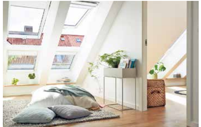
Glas schafft Licht, Raumbeziehungen und visuelle Offenheit.

glasungen senken den Energieverbrauch, reduzieren Betriebskosten und helfen, Nachhaltigkeitsziele von Neubau- und Sanierungsobjekten zu erreichen. „Glas vereint architektonischen Anspruch mit messbarer Leistung und wird so zum Schlüsselbaustein zukunftsfähiger Gebäude“, sagt Jochen Grönegräs, Hauptge-