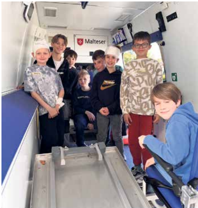
Meckikids im Rettungsfahrzeug

Zum krönenden Abschluss wartete auf die jungen Teilnehmenden die „Sahnehaube“ des Kurses: ein ausgiebiger Blick in das Malteser-Rettungsfahrzeug. Die Kinder durften das Fahrzeug von innen und außen inspizieren, neugierige Fragen stellen und entdecken, welche medizinischen Geräte im Einsatz sind. So bekamen sie einen Eindruck davon, wie professionelle Hilfe aussieht, wenn der Rettungsdienst anrückt.