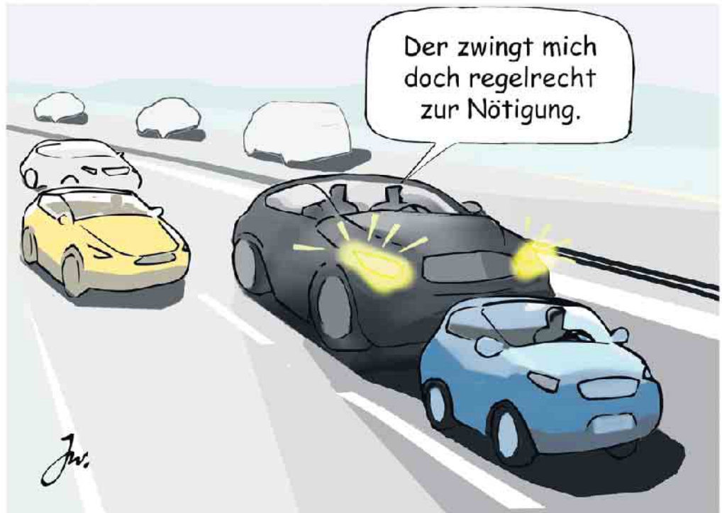
Falsche Reaktion auf Drängler: Demonstratives Langsamfahren auf dem linken Fahrstreifen trägt zur Eskalation bei.

Wenn man sich durch einen Drängler unter Druck gesetzt fühlt, sollte man nicht hartnäckig auf seinem Recht bestehen, sondern dem nervenden Zeitgenossen möglichst schnell das Überholen ermöglichen - ohne Hektik und ohne andere Autofahrer in Bedrängnis zu bringen. Ebenso gilt es zu vermeiden, die Bedrängnis, in die man durch den aufdringlichen Hintermann gebracht wird, an das vorausfahrende Fahrzeug weiterzugeben, indem man sich diesem zu sehr nähert. Denn daraus können unliebsame Ket-