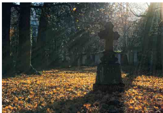
Sterben und Abschiednehmen gehören zum Leben dazu und jeder hat ein Recht auf seine persönlichen Trauerrituale.