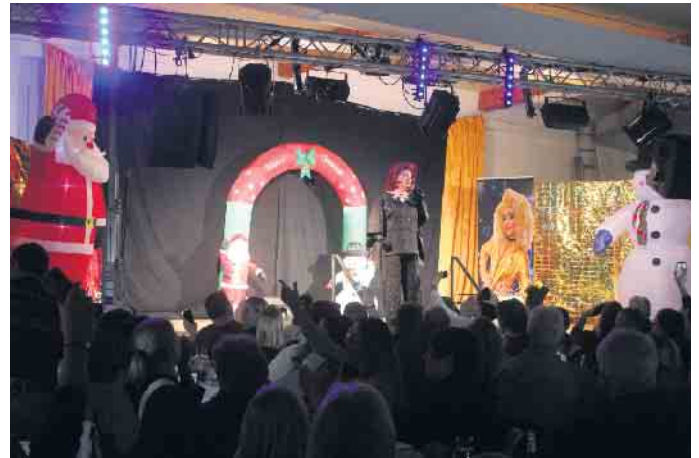
Magische Momente gepaart mit feinsten Travestie wurde den Besuchern am Samstagabend in Lütxheim geboten