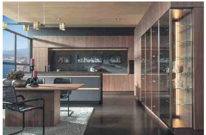
Ein einzigartiges Lichtspiel: Premiumküche mit viel Holz, Glas und gebürstetem Messing, die anhand einer patentierten Beleuchtungslösung perfekt zur Geltung kommen. Ein besonderer Blickfang sind die Vitrinenschränke.

der Küche macht: Glas lässt sich sehr individuell gestalten. Beispielsweise als blickfangende, beleuchtete Nischenrückwand in der persönlichen Lieblingsfarbe, mit einem eigenen Wunschmotiv oder einem der vielen angebotenen Motiv-Dekore. Das kann ein stimmungsvolles Bild aus der Natur sein, ein Appetit Anregendes aus dem Bereich Food oder auch etwas Abstraktes wie grafische und außergewöhnliche Struktur-Designs, um der neuen Wunschküche eine besondere und unverwechselbare Note zu verleihen. Wer sich mit einer Farbe, einem Dekor oder Wunschmotiv ungenau auf längere Zeit festlegen möchte, erfreut sich an einer jederzeit auswechselbaren Nischenrückwand. Denn sobald man Lust auf einen neuen Look verspürt, wird das bestehende Motivglas der Küchenrückwand einfach mit wenigen Handgriffen selbst ausgetauscht. Mehr als ein LED-Wechselrahmen, ein kleiner Saugheber und ein neuer Glaseinsatz sind hierfür nicht nötig. Anschließend nur noch dimmbares Arbeits- oder Ambiente-Licht einstellen - auch ein LED-Farbwechsel (optional) ist möglich - und schon ist der neue Nischen-Look fertig. Der elegante Werkstoff macht sich auch sehr gut als unterseits bedruckte Küchenarbeitsplatte, z. B. Ton-in-Ton abgestimmt auf die