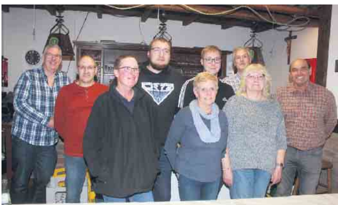
Die fleißigen Helferinnen und Helfer des Bürgervereins aus Lütxheim

ung im nächsten Jahr beispielsweise an Muttertag gibt, schauen sie sich die Revue wieder an und werden damit Teil einer großartigen Show werden. Für die Verpflegung der Besucher sorgte der Bürgerverein Lütxheim. FH