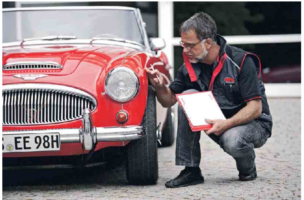
Vor der Erteilung eines H-Kennzeichens muss erst ein Ingenieur das Auto überprüfen und die Originalität beurteilen.

Die Kfz-Steuer für Autos mit H-Kennzeichen beträgt unabhängig von Hubraum und Schadstoffausstoß 191,73 Euro pro Jahr. Das macht sich vor allem bei alten, großvolumigen Motoren bezahlt, die bei einer herkömmlichen Zulassung schnell die 1.000-Euro-Grenze überschreiten. Zudem darf man mit H-Kennzeichen in Umweltzonen fahren - auch ohne grüne Plakette. Für Oldtimer mit H auf dem Schild gelten bei den meisten Versicherungen zudem günstigere Tarife, jedoch fordern die Assekuranzen kostenpflichtige Wertgutachten von anerkannten Bewertern wie Classic-Analytics oder Classic Data.