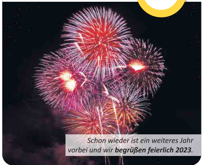
Schon wieder ist ein weiteres Jahr vorbei und wir begrüßen feierlich 2023.