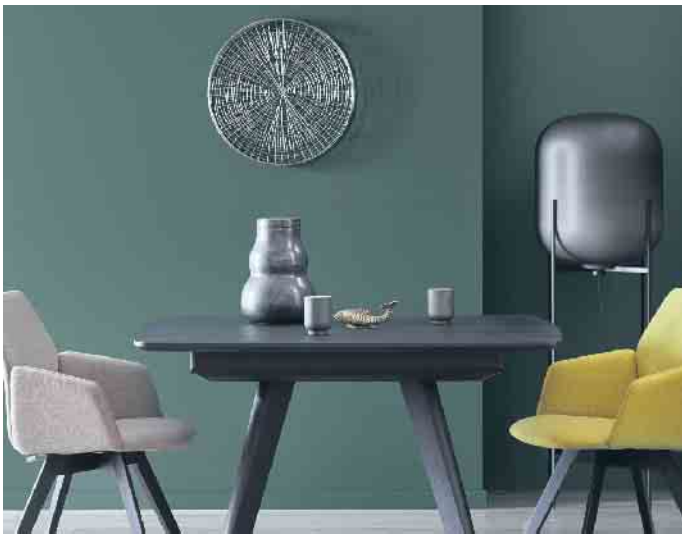
Der Dschungel in den eigenen vier Wänden: Der Name dieser Trendfarbe für die Wand ist hier Programm.

märkten erhältlich. Unter www.schoener-wohnen-farbe.com etwa gibt es mehr Details und Videos mit praktischen Tipps für das eigene Zuhause. Neben der Optik sind ebenso die inneren Werte