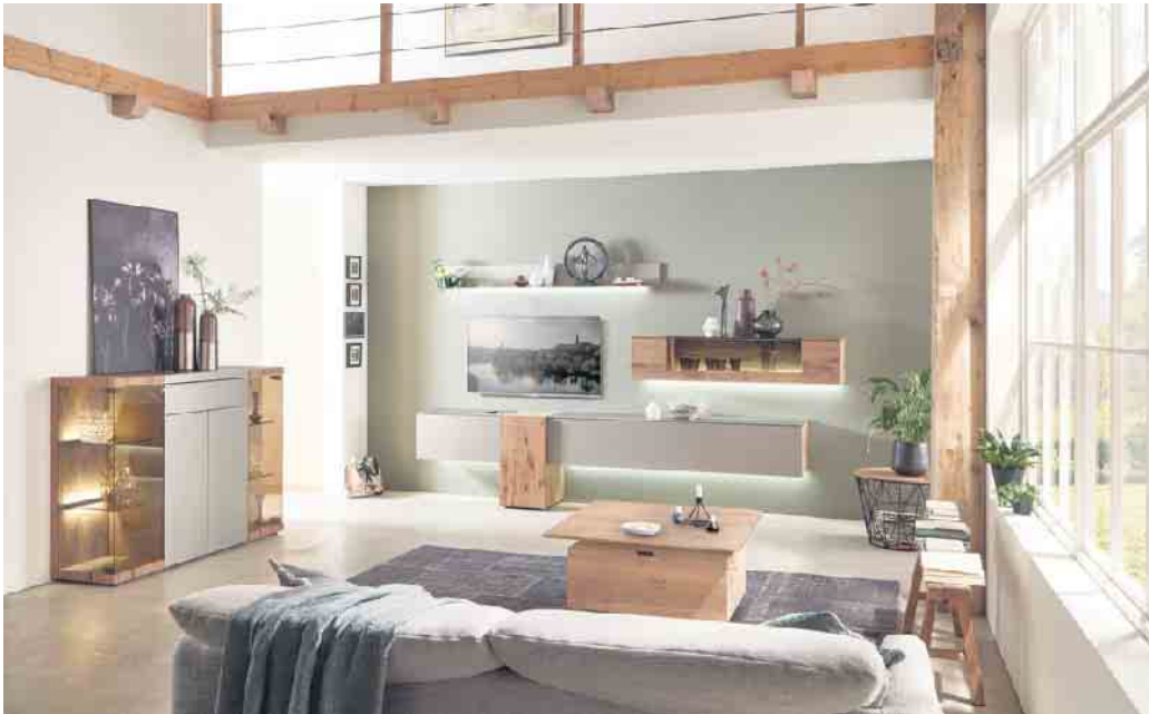
Wer klimafreundlich einrichten möchte, sollte beim Möbelkauf genau hinschauen.

Drei Tipps für den umweltbewussten Möbelkauf