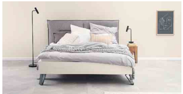
Eine Alternative zu immer nur weißen Wänden: Die Trendfarbe Cosy steht für entspannte Gelassenheit.

wichtig. Daher enthalten die Wandfarben keine Konservierungsstoffe oder Lösemittel, sind für Allergiker geeignet und tragen das renommierte Umweltzeichen Blauer Engel. (djd)