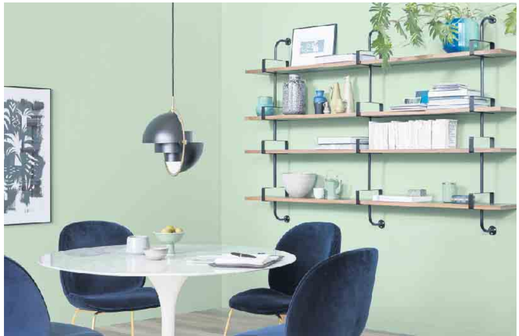
Mehr Mut zur Farbe: Das kreative Kombinieren von Wandfarben, Bödenbelägen und Möbeln verleiht dem eigenen Zuhause mehr Ambiente.