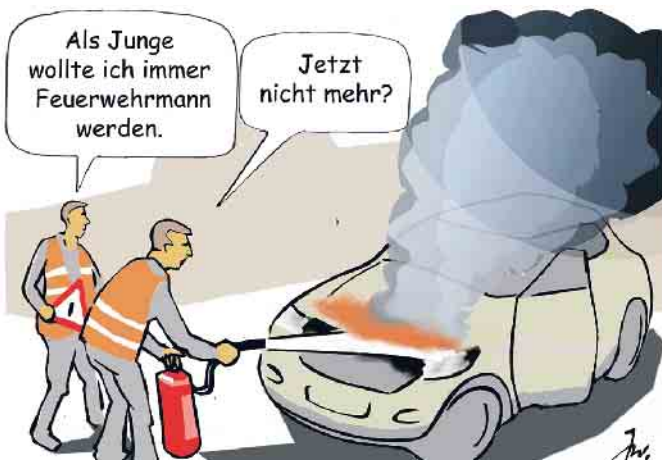
Ein Brandherd in einem Kfz kann sich durch auslaufenden Treibstoff sehr schnell ausbreiten.

Unnötig zu betonen, dass selbstverständlich noch im Auto befindliche Personen so schnell wie möglich aus dem Fahrzeug herausgezogen werden müssen. Wenn es sich noch um einen kleinen Brand handelt, kann man versuchen, diesem mit einem Feuerlöscher beizukommen. (mid/ak-o)