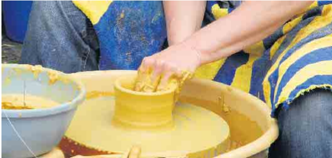
Vor Ort zeigen die Töpfer auch, wie die Ton-Stücke hergestellt werden.

Auch in diesem Jahr findet am Pfingstsonntag und am Pfingstmontag der Töpfermarkt auf dem Burghof in Denklingen statt. Töpfer und Keramiker aus ganz Deutschland und dem nahen Ausland werden dort erwartet. Ob Feen, Elfen oder