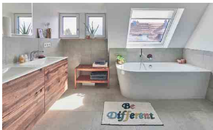
Dachfenster (rechts) und Gaube (links) in diesem Badezimmer zeigen den Unterschied: Während durch die Gaube mehr Wohnfläche mit voller Stehhöhe gewonnen wird, sorgt das Dachfenster für einen deutlich höheren Tageslichteinfall.

das bestehende Schrägdach, durch den zusätzliche Wohnfläche mit voller Stehhöhe gewonnen wird. Sie kann in unterschiedlichen Formen realisiert werden und verändert das Gesamterscheinungsbild eines Hauses maßgeblich. Das kann sich einerseits als interessanter archi-