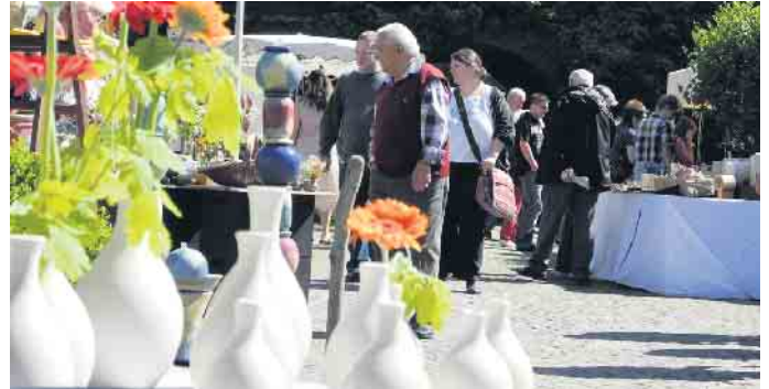
Hoffentlich wird auch in diesem Jahr die Sonne beim Töpfermarkt scheinen.

Engelschlösser, Unikate für den Innen- und Außenbereich oder geschmackvolles Geschirr und erlesene Küchenaccessoires, für jeden Geschmack ist etwas dabei. Das hohe künstlerische- und handwerkliche Niveau lockt jedes Jahr