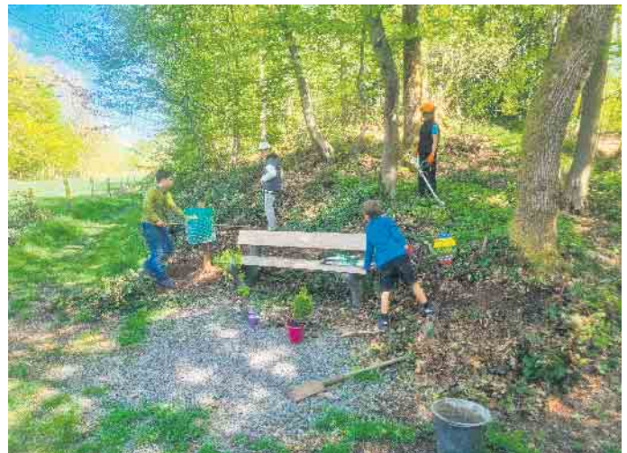
Nun kann der Sommer kommen, denn die Bänke wurden herausgeputzt.

Mittags gab es für alle bei schönstem Sonnenschein Pizza