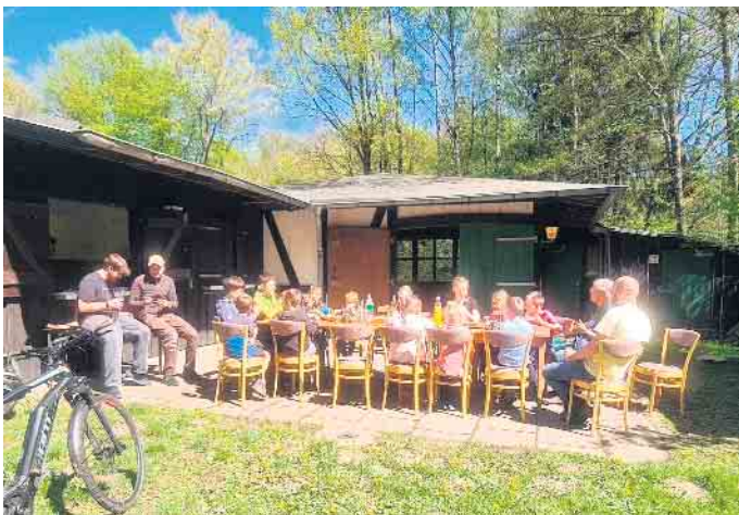
Nach getaner Arbeit schmeckte die Pizza noch mal so gut.

Wie schon im letzten Jahr gab es wieder eine Bank-Aktion in Sterzenbach. Seit die Kinder und Jugendlichen im Jahr 2023 die Bänke neu in Stand gesetzt und die Patenschaften für ihre „Wasserbank, Sonnenbank und Waldbank“ übernommen haben, gibt es jährliche Treffen zur Pflege und Bepflanzung rund um die Bänke.