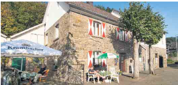
Beim Deutschen Mühlentag macht auch die Mühle in Nespen mit. Ab 11 Uhr ist die Mühlentür auf.

Pfingstmontag ist traditionell Mühlentag in Deutschland