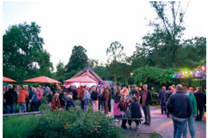
In bunte Lichter ist der Kurpark getaucht und mit toller Musik wird dies ein unvergesslicher Abend.

Wichtiger Hinweis: Bei Starkregen / Unwettergefahr fällt die Veranstaltung aus.