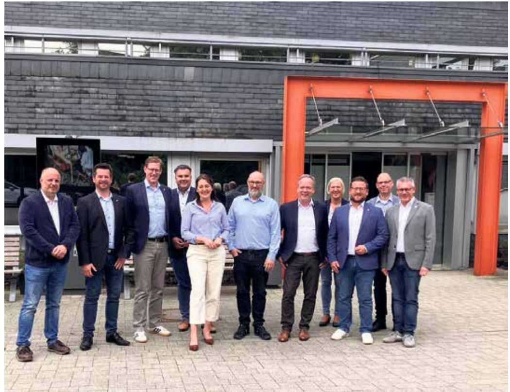
Die Kooperationsvereinbarung wurde im Rahmen eines Treffens der Bürgermeister in Nümbrecht unterzeichnet.

allen Grundschulstandorten zur Verfügung zu stellen", betont Klaus Grootens und ergänzt, dass die vergangenen Jahre gezeigt haben, dass durch eine enge Abstimmung und vertrauensvolle