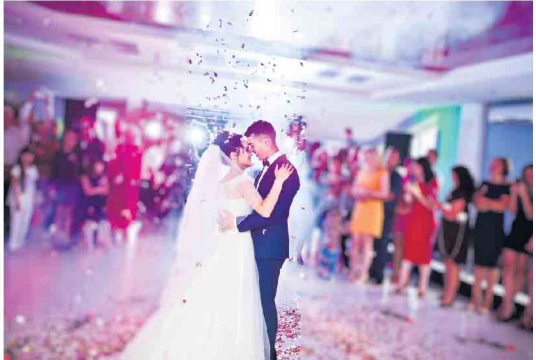
Am schönsten Tag des Lebens soll alles perfekt ablaufen. Eine spezielle Versicherung schützt vor Überraschungen wie Erkrankungen oder einer Absage.

Dass die Liebe ein Leben lang hält, lässt sich naturgemäß nicht versichern. Doch für die finanziellen Folgen einer geplatzen Hochzeitsfeier gibt es spezielle Versicherungen. Wenn es wenige Tage vor dem Ja-Wort zu einem Unfall kommt oder etwa der Trauzeuge plötzlich schwer erkrankt, kommen zu den gesundheitlichen Sorgen auch noch finanzielle Aspekte hinzu. Schließlich sind mit einer kurzfristigen Absage oder Verlegung des Festes meist hohe Kosten verbunden. Angehende Eheleute können dieses Risiko beispielsweise mit der Hochzeitsversicherung der Waldenburger absichern. Sie haftet bei gesundheitlichen Problemen des Brautpaares, ihrer engeren Angehörigen und der Trauzeugen. Das gilt auch, wenn Dienstleister wie der Cateringlieferant oder der Vermieter des Festsaals ausfallen oder Insolvenz anmelden. Auch dann tritt die Versicherung für den finanziellen Schaden ein. Dazu gehören Stornokosten und Mehrausgaben für einen neuen