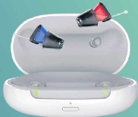
Silk Charge&Go IX

Das beliebteste Im-Ohr-Hörgerät von Signia