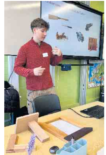
Die Faszination für das Tischlerhandwerk brachte ein Auszubildender aus diesem Bereich auch mit verschiedenen Anschauungsstücken rüber.

Diese Schulen nahmen teil: Hauptschule im Kleefeld, Integrierte Gesamtschule Paffrath, Johannes-Gutenberg-Realschule, Nelson-Mandela-Gesamtschule, Nicolaus-Cusanus-Gymnasium, Otto-Hahn-Realschule, Realschule Herkenrath (alle Bergisch Gladbach), Johannes-Löh-Gesamtschule Burscheid, Ganztagsrealschule Odenthal, Gesamtschule Kürten, Gesamtschule Rös-rath, Gymnasium Leichlingen, Gymnasium Rös-rath, Sekundarschule Leichlingen und die Sekundarschule Overath.