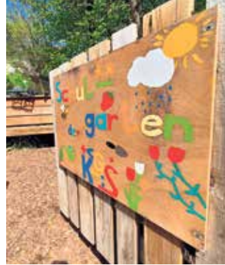
Der Eingang zum Schulgarten an der KGS Rösrath