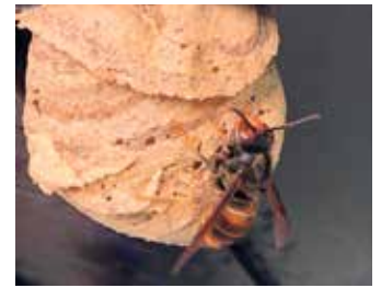
Asiatische Hornisse mit Nest.

Eintritt frei, das Netzwerk freut sich über Spenden.