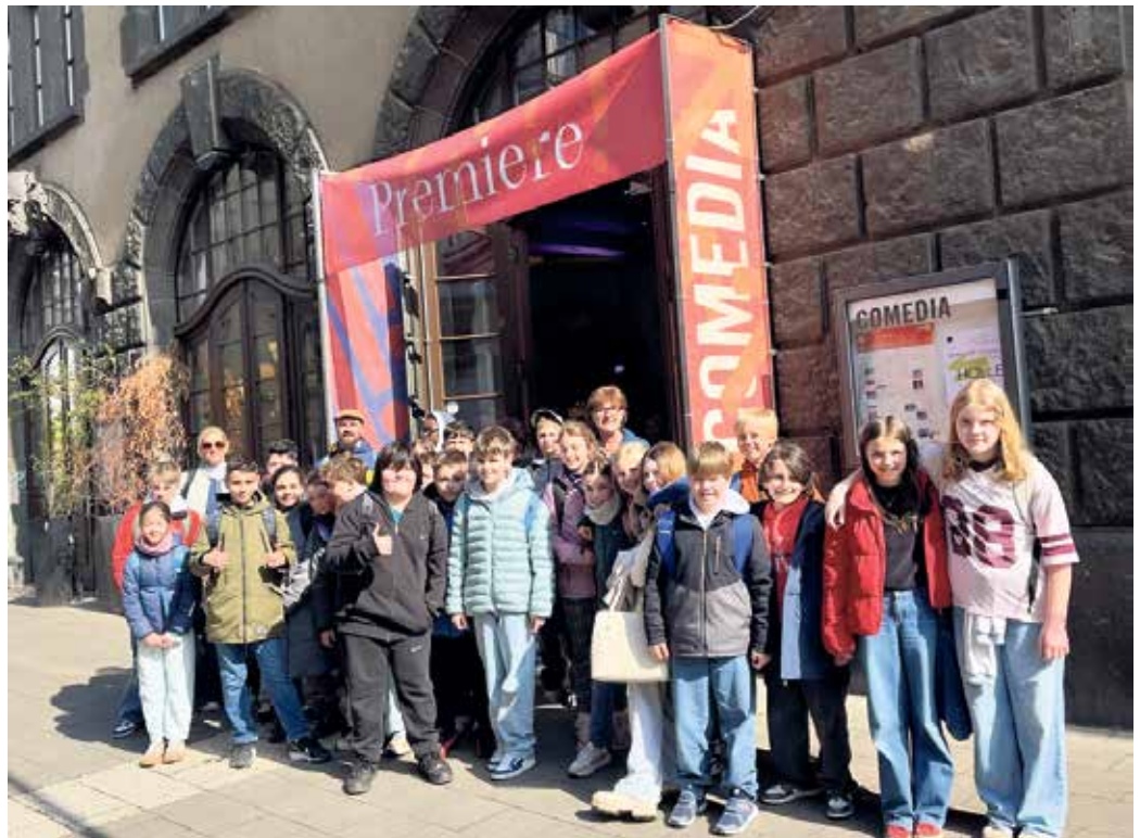
Die Klasse der GS Rösrath vor dem Comedia-Theater.

Weitere Informationen zum Friedensplakat-Wettbewerb und zum ehrenamtlichen Engagement der Bergischen Löwinnen finden Sie unter www.bergische-Loewinnen.de oder auf Instagram: "#bergische_loewinnen".