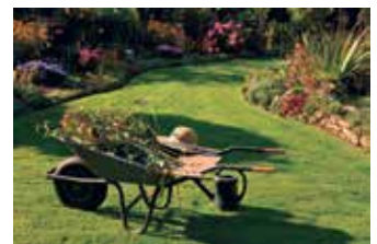
Nun ist der richtige Zeitpunkt für den Rückschnitt.

Mit diesen Pflegeschritten starten Gartenfreunde bestens vorbereitet in die neue Saison - und können sich schon bald über frisches Grün, bunte Blüten und gesunde Früchte freuen. (akz-o)