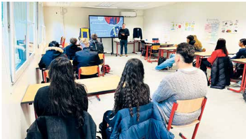
Schulsanitäter*innen der GE am Michaelsberg im Workshop „Resilienz aufbauen“

In alters- und zielgruppengerechter Form setzten sich die Schüler*innen mit typischen Belastungssituationen, deren evolutionären Hintergründen sowie mit konkreten Bewältigungs-