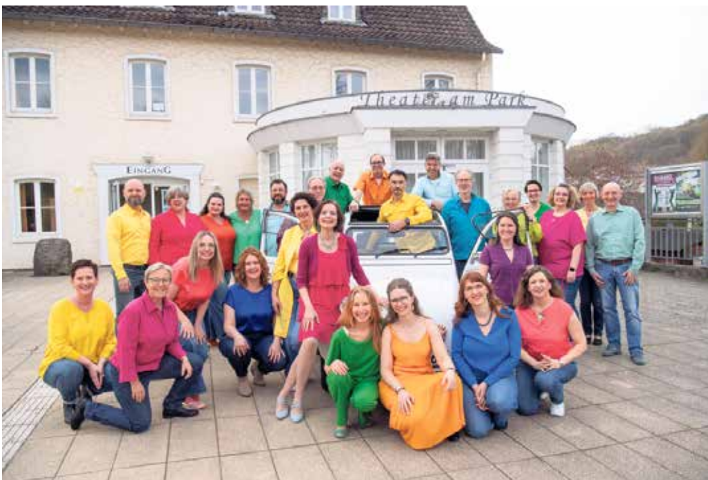
Die KlangFarben im Stadtmuseum Siegburg am 26. April.

Ein Benefizkonzert für den Ambulanten Hospizdienst im Stadtmuseum Siegburg