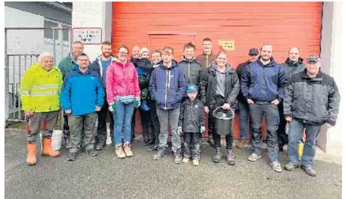
Gemeinsam für ein sauberes Dorf - Dorfaktionstag in Vinsebeck

Der erfolgreiche Vormittag wurde durch ein gemeinsames Grillen mit leckerem Essen und kühlen Getränken abgeschlossen.