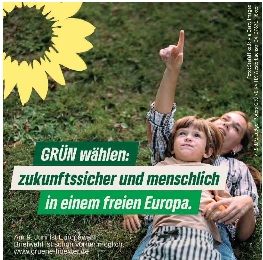
V.i.S.d.P.: Lüdger Roters GRÜNE KV HX Westerbachstr. 34 37671 Hötter

Stoppelbergstraße 11 32839 Steinheim Rolfzen Tel. 05233 7468 zum-koerter@t-online.de