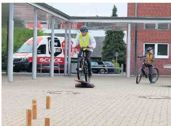
Die neuen Räder werden gleich am Geschicklichkeitsparcours auf dem Schulhof ausprobiert.

erreichen, werden die Lehrerinnen und Lehrer als starke Partner gebraucht. Dieses Ziel ist hier an der Realschule vollumfänglich erreicht. Wir freuen uns über das Engagement der Schule und auch die Unterstützung des Schulträgers, der Stadt Steinheim. Deshalb haben wir heute nochmal zehn Fahrräder verschiedener Größen mitgebracht, um noch mehr Schülerinnen und Schülern die Teilnahme zu ermöglichen.“ Seitens der Stadt Steinheim drückt Gerd Engelmann den Dank auch des Bürgermeisters für die Unterstützung aus. Er betont, dass durch die Schaffung des MountainBike Parks am Sportzentrum die Kinder und Jugendlichen der Stadt auch in ihrer Freizeit ein hervorragendes Gelände vorfinden würden, um mit dem Rad Spaß zu haben. Ebenso weist er auf den vielfältigen Ausbau der Radwege in der Region hin.