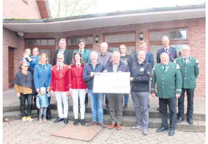
Die Spendervertreter von Bürgerstiftung Nieheim, Kulturstiftung und Bilster Berg überreichen die Spende an die Vereinsvertretungen.