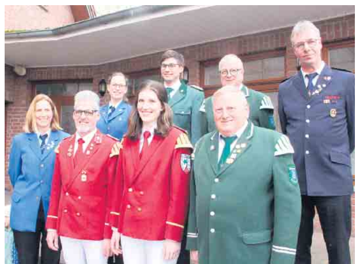
Einige Spendenempfänger sind extra in Vereinsuniform erschienen.