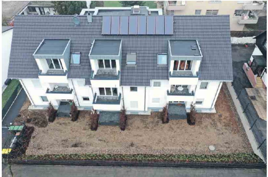
Das Dachdeckerhandwerk, der richtige Ansprechpartner für die Solaranlage auf dem Dach.

Dachdecker sind Klimaschützer Zunehmend wird es auch wichtig, den bereits deutlich spürbaren Veränderungen durch den Klimawandel zu begegnen, zum Beispiel der Hitzebelastung in Ballungsgebieten. „Dachdecker und Dachdeckerinnen sorgen mit ihrer fundierten Arbeit nicht nur für eine trockene und behagliche Wohnung, sondern tragen als Teil einer klimabewussten Gesellschaft mit ihrer Arbeit dazu bei, dass unsere Welt auch in Zukunft lebenswert bleibt. Denn neben der Sanierung bringen Dachdecker auch Fotovoltaikanlagen aufs Dach oder planen Gründächer. In Deutschland gibt es immerhin 120 Millionen m 2 begrünte Dachflächen. Das sorgt für Kühlung und Luftbefeuchtung,