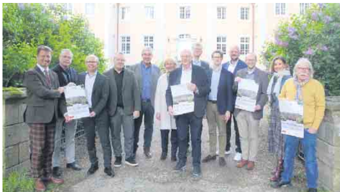
Die Beteiligten und Sponsoren freuen sich auf das vierte Landluftkonzert der NWD auf Schloss Rheder.