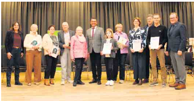
Zum Abschluss gab es großen Applaus für alle Geehrten des Abends.