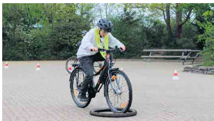
Hier ist Standsicherheit und Balance gefragt.