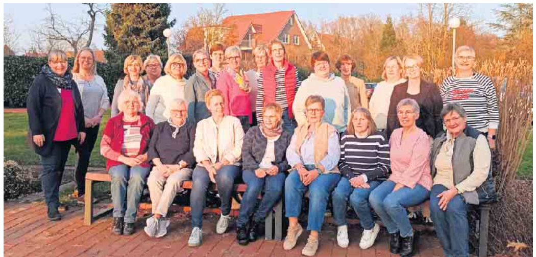
Landfrauen Stemwede mit den beiden Koordinatorinnen vom Hospiz- & Palliativ Beratungsdienst Lemförde

Ein weiterer wichtiger Baustein war das Thema Vorsorge. Patientenverfügung und Vorsorgevollmacht wurden erläutert und die Teilnehmenden ermutigt, sich frühzeitig Gedanken über die eigenen Wünsche und Vorstellungen vom Lebensende zu machen. Deutlich wurde: Sterben ist untrennbar mit dem Leben verbunden. Wenn sich das Lebensende ankündigt, können Angehörige vor allem durch Ruhe, Zuwendung und Dasein unterstützen. Auch die Bedeutung von Essen und Trinken in den letzten Tagen wurde thematisiert. So kann es hilfreich sein, mit Sterbenden im Gespräch zu