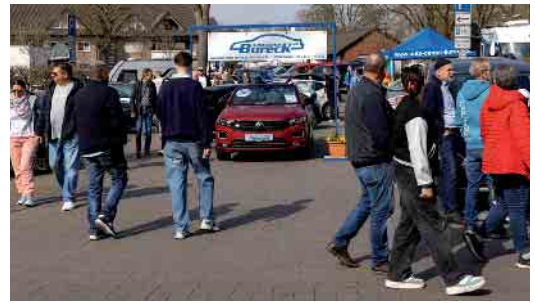
Die Rahdener Automesse steht am Samstag, den 28. und Sonntag, den 29. März, ganz im Zeichen von Mobilität. Es werden neben den Topmodellen des aktuellen Modelljahres auch Jahreswagen und Gebrauchtwagen präsentiert.