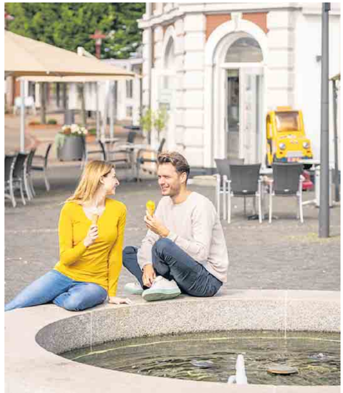
Die Veranstalter laden ein: Nutzen Sie die Rahdener Automesse für einen Frühlingbummel und lassen Sie sich das erste Eis in der Sonne schmecken.

Bausubstanz strahlt der Stadtkern Charme aus, der durch die Wohngebiete, sowohl im Zentrum als auch in den Außenbezirken, zu einem angenehmen Familienleben einladen. Rahden begeistert als lebendige Stadt mit einer sanierten Innenstadt, ideal für Einkaufen, Bummeln und Verweilen. Erleben Sie Rahden - eine Stadt, die mit ihrer Vielfalt, Natur und Kultur begeistert und die Gemeinschaft stärkt.