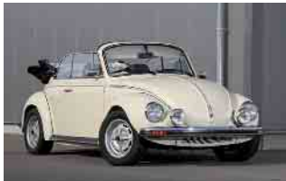
In diesem Jahr ist auch die Firma Knepper „bugs & more“ dabei. Das heimische Unternehmen bietet maßgeschneiderte Lösungen für die Restauration klassischer VW-Modelle. Foto: bugs & more

Vertreten sind die Autohäuser Ortgies, Rehling, Bureck, Pollert und Piper, Sie präsentieren unter anderem Modelle der Marken Citroën, Ford, Mazda, Toyota und Volvo sowie weitere Hersteller. In diesem Jahr ist auch die Firma Knepper „bugs & more“ dabei. Das heimische Unternehmen bietet maßgeschneiderte Lösungen für die Restauration klassischer VW-Modelle. Foto: bugs & more