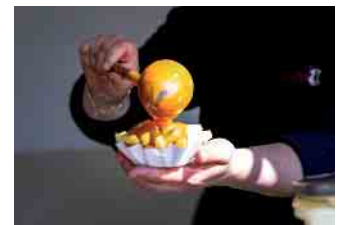
Für das leibliche Wohl sorgt in diesem Jahr an beiden Tagen das Team der Fleischerei Schröder.

Mit einem abwechslungsreichen Programm, attraktiven Angeboten und hoffentlich bestem