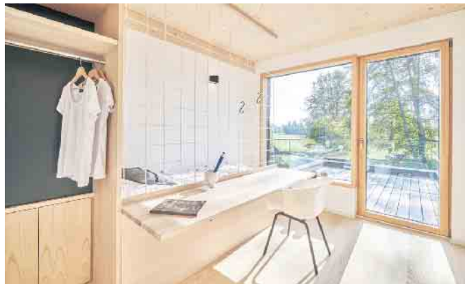
Offene Grundrisse und viel Tageslicht lassen auch kleine Wohnflächen großzügig wirken - funktional geplant entsteht hoher Komfort auf kompaktem Raum.

Damit kleine Häuser gut funktionieren, muss der Grundriss effizient sein. Der vielgenutzte Wohnbereich bietet offen gestaltet mit Verbindung zur Küche ausreichend Bewegungsfreiheit. Bei Bad, Küche und Schlafzimmer zählen Funktionalität und ausreichend Stauraumlösungen. Durchdachte Räume können mehrere Funktionen erfüllen - etwa ein kombinierter Wohn-Ess-Bereich oder ein integrierter Arbeitsplatz. Für eine großzügige optische Wirkung ist der Übergang zwischen Innen- und Außenbereich entscheidend. Hannott ergänzt: „Gute Planung bedeutet, bereits bei der Grundrissgestaltung zu