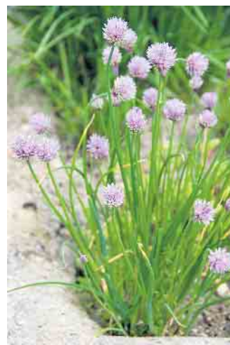
Der Schnittlauch aus dem eigenen Garten ist Schmuck ... und leckere Salatbeigabe.

Ob im reinen Ziergarten oder auch im Nutzgarten mit Gewächshaus: