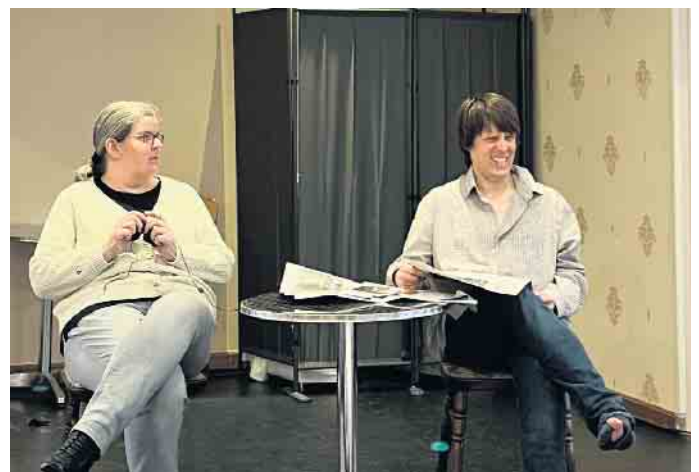
Die „Theatergruppe Bahnhof Rahden“ sorgte mit einem bunten und unterhaltsamen Programm unter dem Motto „Missverständnisse“ für beste Stimmung.