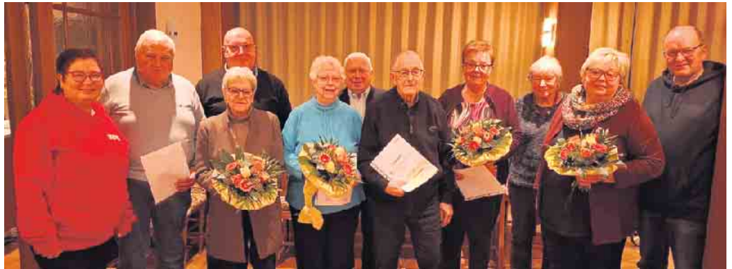
Bei der Jahreshauptversammlung des SoVD Oppenwehe standen Vorstandswahlen und Ehrungen für langjährige Mitgliedschaft auf der Tagesordnung.