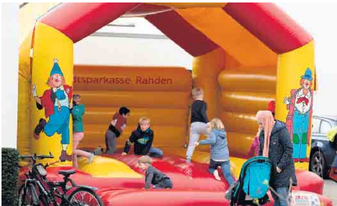
Die Kinder können sich auf der Hüpfburg der Stadtparkasse Rahden austoben.

Einkaufsmöglichkeiten und heimische Gastronomie mit besonderen Spezialitäten. Die verkehrsberuhigte Innenstadt lädt zum Bummeln ein, während die Rahdener Parklandschaft und die Umgebung perfekte Kulissen für Radtouren bieten. Die Stadt bietet mit dem Museumshof, der Burgruine und der St.-Johannis-Kirche Einblicke in ihre reiche Geschichte. Mit einer Mischung aus moderner Bebauung und erhaltener