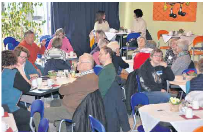
Bei Kaffee und Kuchen lässt sich gut klönen

wieder seine Pforten und lädt ins Life House, Am Schulzentrum 14, in Stemwede-Wehdem ein.