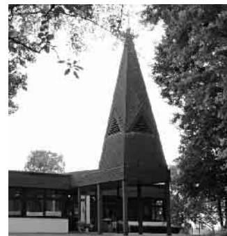
Haldem, im April 2023