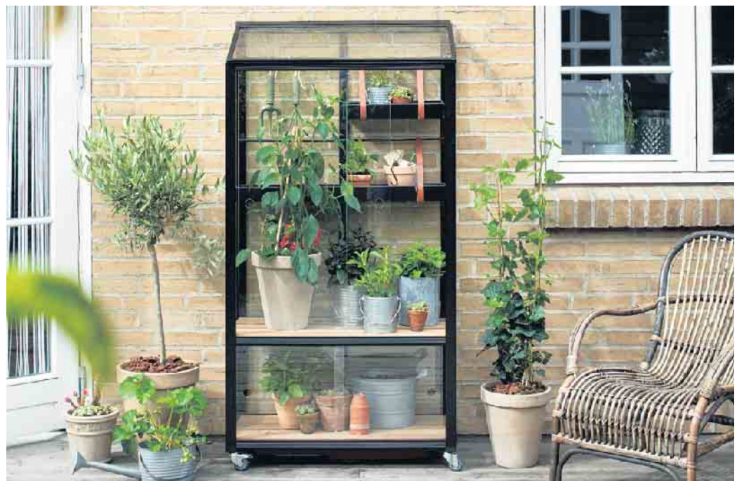
Im Mini-Gewächshaus gedeihen Kräuter und Gemüse auf kleinstem Raum

Es gibt sie mit Folie überspannt, in Form von kleinen Schränken