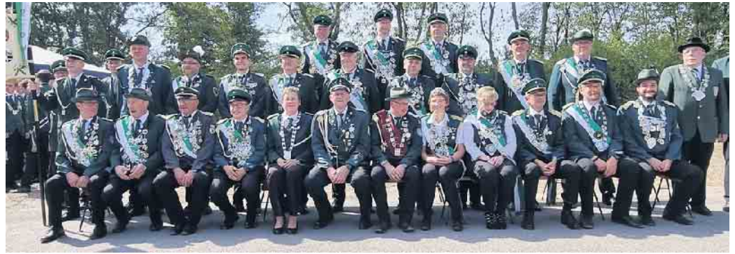
Schützenkönige 2022.

Mit sehr viel Engagement und Kreativität werden die Festkonzepte überarbeitet und auch an die Majestäten