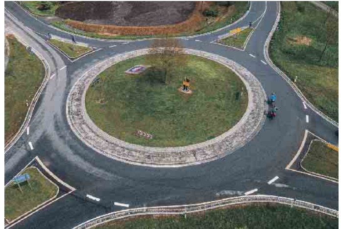
Berühmter Kreis: Diesen Kreisverkehr kennen TV-Zuschauer aus den Eberhofer-Krimis.

Im Ausland gelten zum Teil abweichende Regelungen. So haben in Österreich einfahrende Fahrzeuge grundsätzlich Vorfahrt vor denjenigen, die sich bereits im Kreisverkehr befinden. In Frankreich haben in den Kreisverkehr einfahrende Fahrzeuge zwar grundsätz-