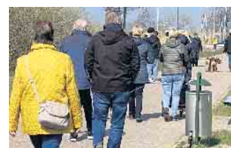
Die Promenade am Dümmer See war Ostern ein beliebtes Ausflugsziel für viele Besucher.