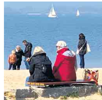
Der Dümmer See gehört zu den beliebten Naherholungsgebieten in der Region.

Für andere ist es die Ruhe, die man genießen kann, sobald man ein paar 100 Meter auf dem Deich entlang spaziert ist, andere wiederum lieben das turbulente Treiben in den Touristenhochburgen Lembruch und Hüde.