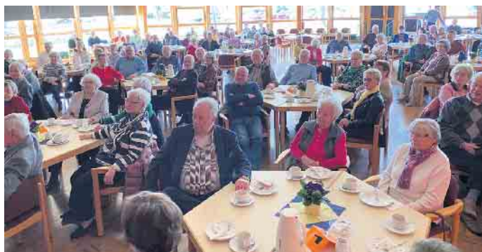
Die „Original Salzsieders“ sorgten beim Seniorenachmittag für beste musikalische Unterhaltung.