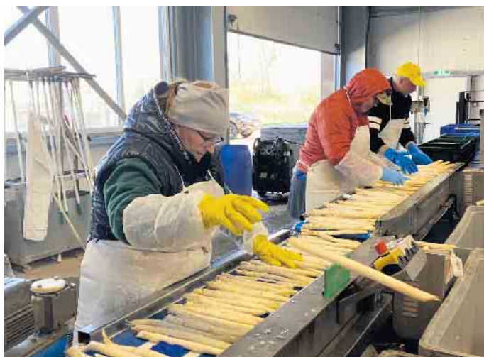
Qualitätskontrolle: Auf dem Spargelhof Winkelmann gelangt nur beste Qualitätsware an den Verbraucher.