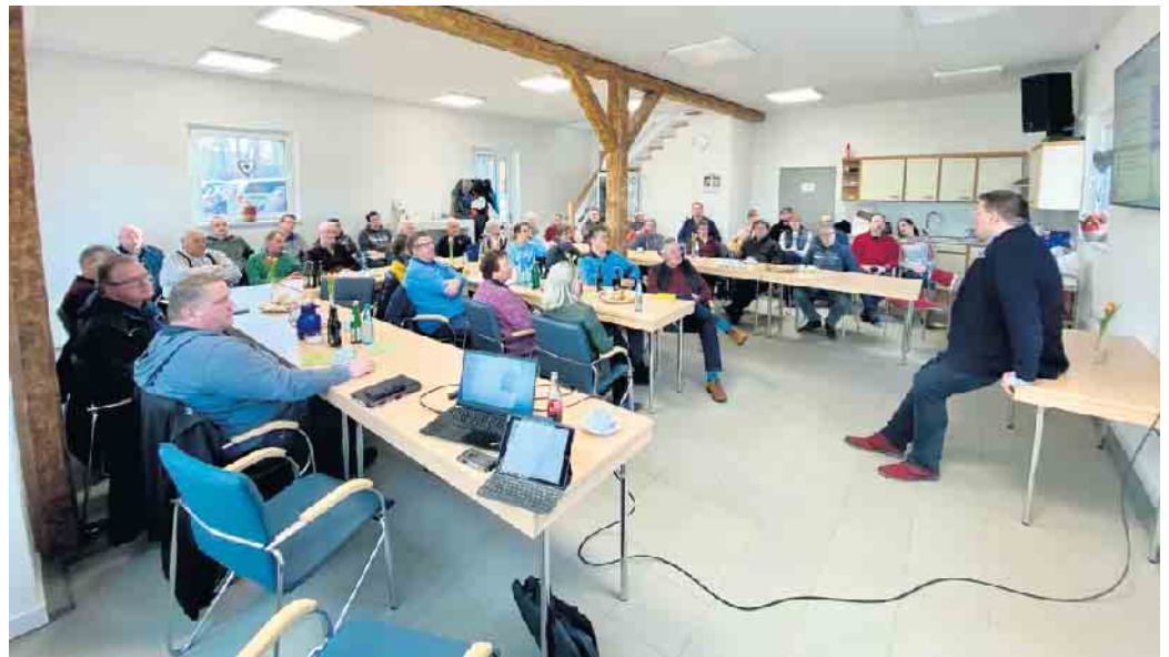
Viel los im Dorfgemeinschaftshaus Niedermehnen: Das Interesse am Austausch mit Bürgermeister Kai Abruszat war groß.

Es war das inzwischen schon neunte Ortsteilgespräch von Stemwedes Bürgermeister Kai Abruszat und diesmal war das Interesse besonders groß. Mehr als 40 Interessierte verfolgten die Präsentation von Bürgermeister Kai Abruszat im Niedermehner Dorfgemeinschaftshaus und beteiligten sich an der Diskussion. Gesprächsbedarf bestand vor allem bei der Frage nach der Zukunft der AWO-Kindertagesstätte „Wutzelhausen“. Bekanntlich ist die Kita nach einem erneuten Wasserschaden ein Sanierungsfall und die Suche nach einer Lösung läuft. Bürgermeister Abruszat informierte die anwesenden Niedermehnerinnen und Niedermehner deshalb ausführlichen über den Stand der Dinge und die Bemühungen von Rat und Verwaltung, eine Lösung, im Sinne der Niedermehner Kinder und Eltern sowie der Mitarbeiterinnen, zu finden.