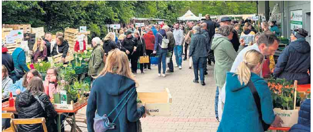
Schon im vergangenen Jahr kamen über 5.000 Besucherinnen und Besucher, um sich mit Tomaten, Paprika, Gurken, Zucchini und zahlreichen Küchenkräutern einzudecken.

Der Jungpflanzenmarkt ist jedoch mehr als ein reiner Verkaufsmarkt. Das Gärtnersteam steht vor Ort für persönliche Beratung zur