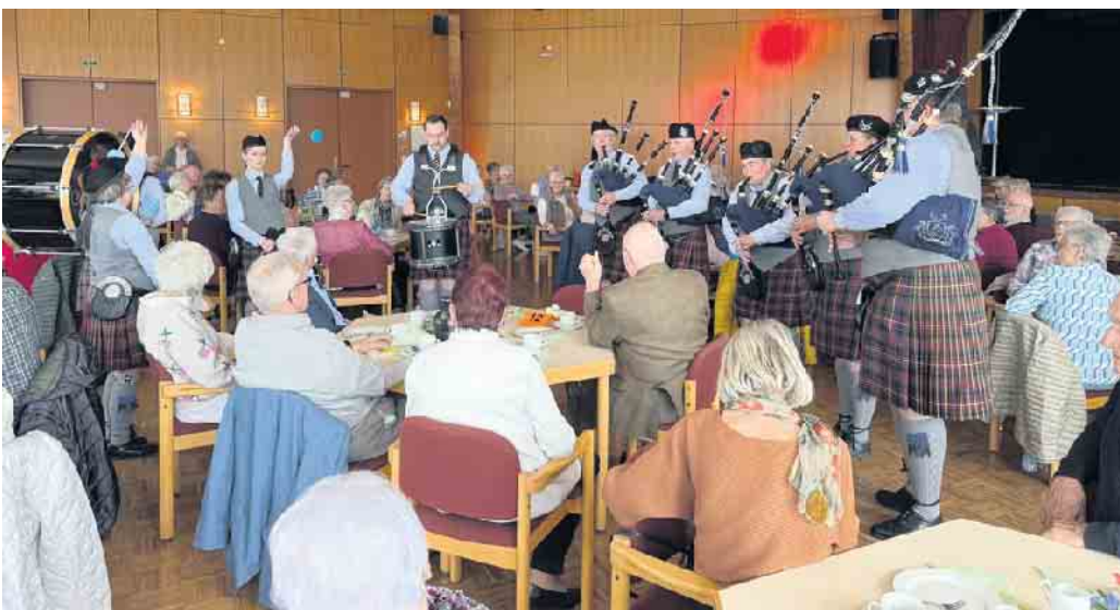
Die Essern Highlanders Pipe Band sorgte beim Seniorenachmittag für beste musikalische Unterhaltung.

Die positive Resonanz zeigte einmal mehr, wie wichtig solche Begegnungen für das gesellschaftliche Miteinander sind. Viele der Gäste nutzten die Gelegenheit alte Bekannte wieder zu treffen und neue Kontakte zu knüpfen. Die Stemweder Seniorenachmittage (der zweite Teil folgt Sonntag, 12. April) sind weit mehr als nur ein gemütliches Beisammensein: Sie stärken den sozialen Zusammenhalt, fördern die Teilhabe und schaffen wertvolle Begegnungen.