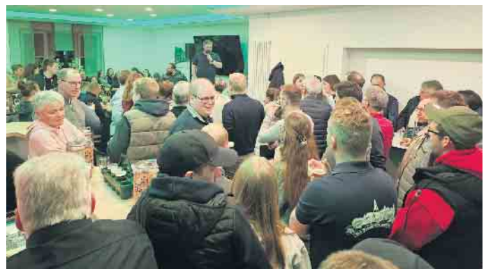
Gespannte Gesichter bei der Siegerehrung