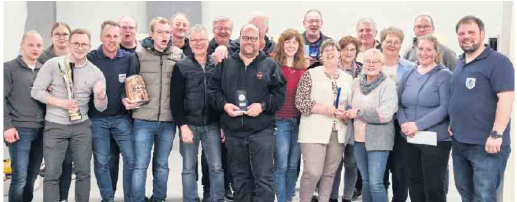
Sieger und Plazierte des Dorfpokals 2026