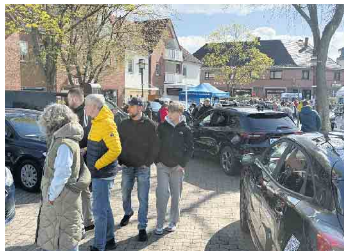
Zahlreiche interessierte Passanten flanierten die Automeile im Herzen Rahdens entlang.