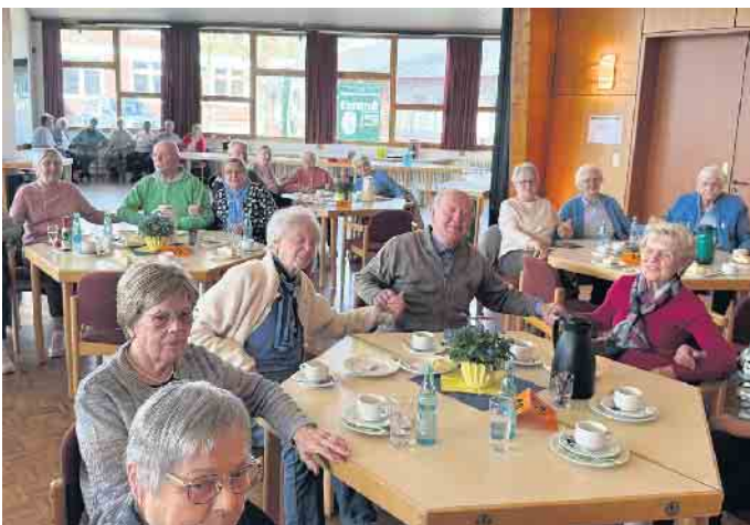
Viele Gäste ließen es sich nicht nehmen, fröhlich zum Walzer zu schunkeln.