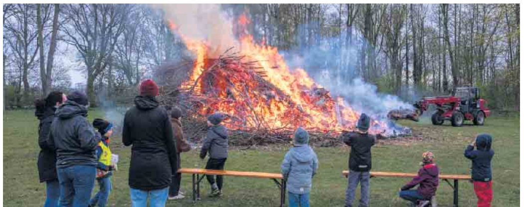
Jung und Alt standen um die lodernden Flammen des Osterfeuers in Drohne.

(hm). Den Winter durch ein möglichst großes und weithin sichtbares loderndes Feuer endgültig vertreiben und zusammen mit Nachbarn und Freunden den Frühling feiern. Das ist schon seit Jahrhunderten der Sinn eines traditionellen Osterfeuers, wie es an den Abenden des Ostersonntags oder -sonnabends auch in vielen Ortschaften Stemwedens abgefackelt wurde. Die „Brandstifter“ hatten allerorts ganze Arbeit geleistet und nach anfänglich dickem Qualm loderten die feuerroten Flammen durch gewaltige Baumabfallhaufen.