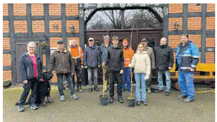
Rund zehn fleißige Helfer starteten zur jüngsten Baumpflanzaktion des Schützenvereins Oppenwehe.