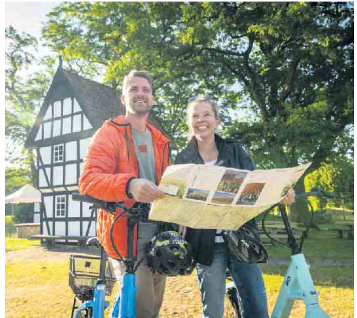
Mühlenensemble Levern.

Nach der großen Begeisterung im vergangenen Jahr geht die Pick-