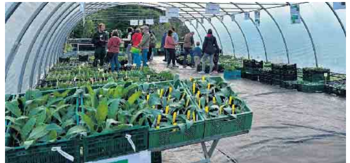
Ein Großteil der Pflanzen stammt direkt aus der Bio-Gärtnerei in Kalkriese. Dort werden sie ohne chemisch-synthetische Pflanzenschutzmittel und mit viel Handarbeit großgezogen.

dafür genau an der richtigen Adresse. Adresse: Alte Heerstraße 20, 49565 Bramsche