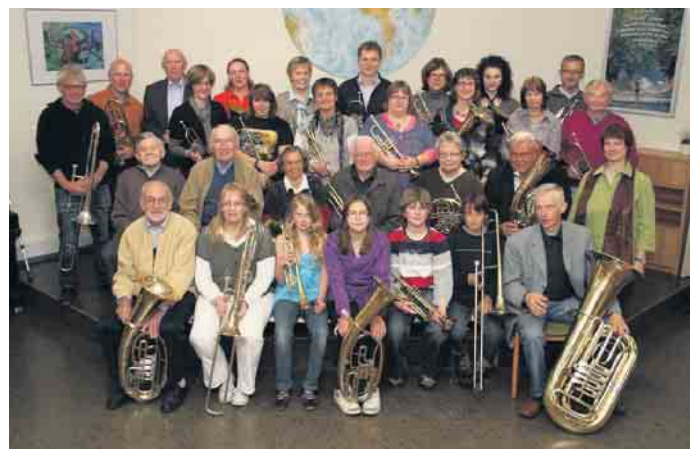
Vor 15 Jahren waren noch 30 Musikerinnen und Musiker beim Posaunenchor dabei.