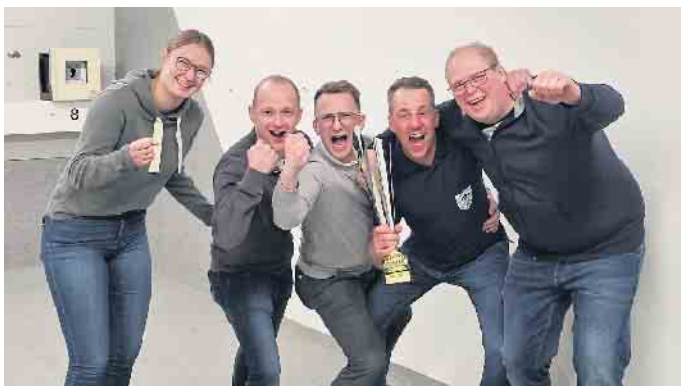
Die Gewinnermannschaft „die Lamas“