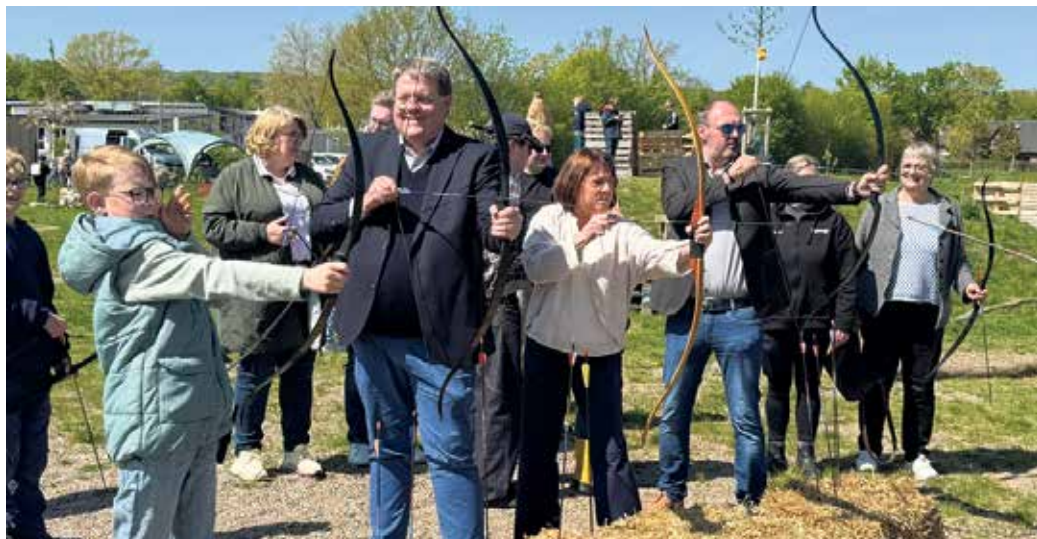
Beim Frühlingsfest des Abenteuerspielplatz „KuhLandia“ durften sich die Gäste im Bogenschießen ausprobieren.

„Wir wollen draußen sein, wir wollen in den Garten“, lautete der Wunsch vieler Kinder und das, obwohl man im ländlichen Raum eigentlich Anderes vermuten könnte. Gleichzeitig wurde ein weiteres Problem sichtbar: praktische Fähigkeiten gingen zunehmend verloren. „Zehn von 15 Kindern konnten keine Knoten machen“, erinnerte Schulz. Daraus entstand die Idee, einen Ort zu schaffen, an dem Kinder wieder