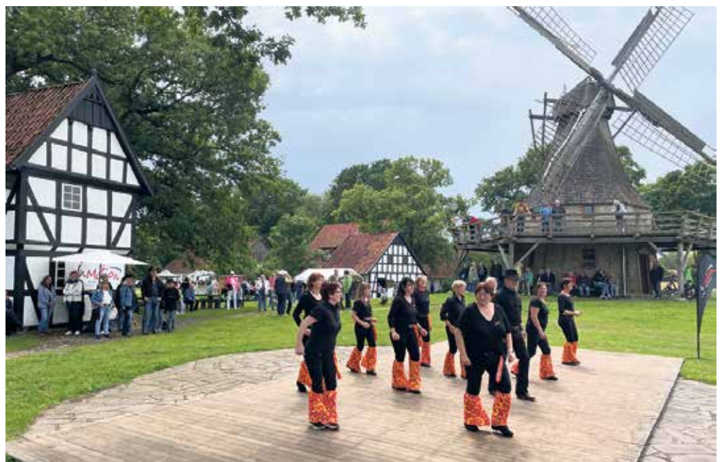
In Motion Dancern aus Oppendorf

Kommt vorbei und erlebt schöne Stunden rund um die Levern Mühle!