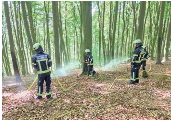
Im Ernstfall kann auch im Stemweder Berg ein Feuer gelöscht werden.