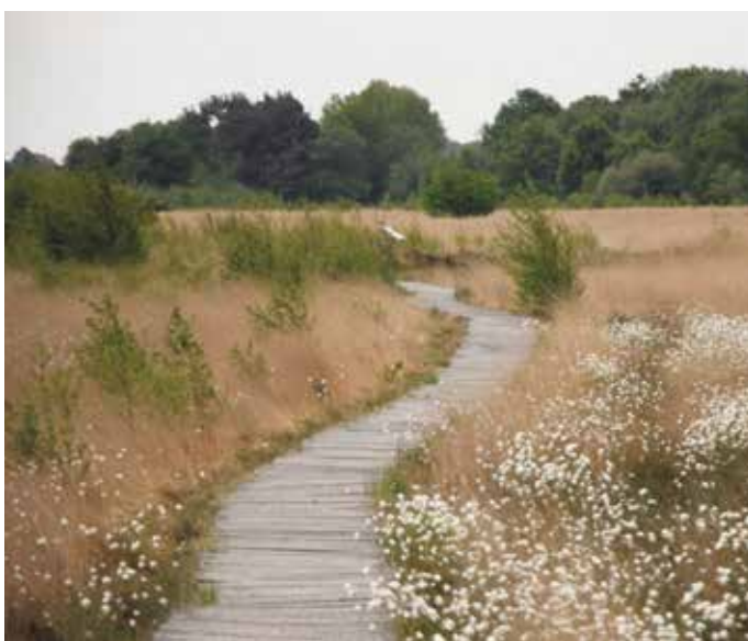
Das Oppenweher Moor lockt von Mai bis Juni mit zauberhaftem Wollgras.

Die Veranstaltung wird von der Koordinierungsstelle der Naturparke in NRW getragen, die die zwölf Naturparke bei gemeinsamen Projekten unterstützt und ihre Sichtbarkeit stärkt. Gefördert wird sie vom Ministerium für Umwelt, Naturschutz und Verkehr des Landes Nordrhein-Westfalen. Umweltminister Oliver Krischer betont: „Die Naturparke sind ein Gewinn für Mensch und Natur gleichermaßen.“