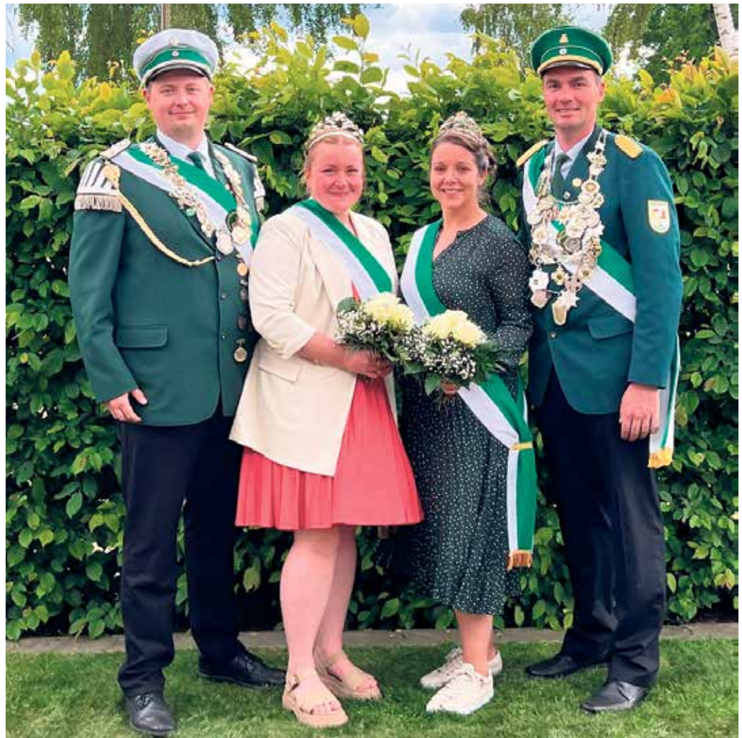
Die amtierenden Oppendorfer Königspaare freuen sich auf zahlreiche Besucherinnen und Besucher, die gemeinsam ein Wochenende voller Tradition, Gemeinschaft und guter Stimmung erleben möchten.

Bereits um 18 Uhr startet das Schießen der „Alten Garde“ um den Kaiser-Wilhelm Pokal.