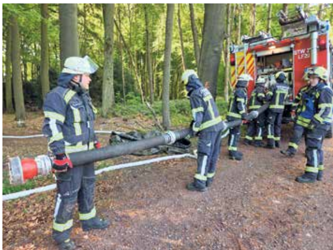
Die Löschwasserversorgung wurde sichergestellt.

Ein wichtiger Bestandteil, um im Ernstfall noch besser vorbereitet zu sein. Die Organisatoren zeigten sich am Ende zufrieden: die Übung habe eindrucksvoll gezeigt, wie wichtig koordinierte Zusammenarbeit und gute Vorbereitung bei Einsätzen im schwierigen Gelände sind.