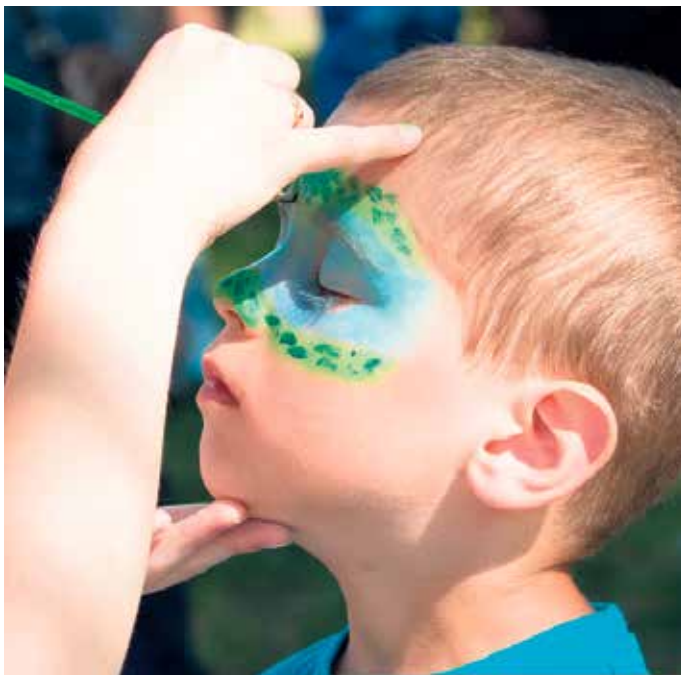
Am Samstagnachmittag warten beim Kinderschützenfest ab 15:30 Uhr zahlreiche Attraktionen wie Hüpfburg, Kinderschminken, Luftballonfiguren, ein Stationenlauf und Glitzertattoos auf die jungen Gäste. (Symbolfoto).

sowie die Jungschützen aus Haldem und Varl erwartet. Den krönenden Abschluss bildet eine große Party mit Live-Musik der Band „6th Avenue“. Der Schützenverein Oppendorf freut sich auf zahlreiche Besucherinnen und Besucher, die gemeinsam ein Wochenende voller Tradition, Gemeinschaft und guter Stimmung erleben möchten.