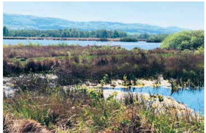
Das Schöne liegt oft so nah und die Landfrauen schauen genau hin.

die Moorschnucken, die durch ihr Fressverhalten die Landschaft offenhalten. In der Vogelwelt sind unter anderem Kiebitze, Wildgänse und Enten heimisch.