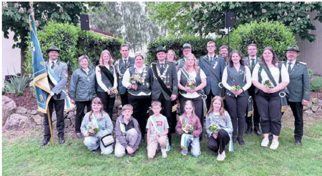
Die Reininger Majestäten mit ihrem Hofstaat und Verantwortlichen des Vereins.