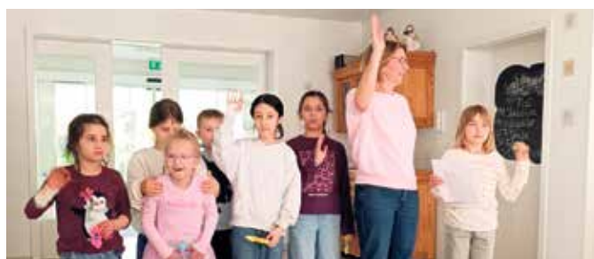
Beim gemeinsamen Nachmittagskaffee kamen die Seniorinnen und Senioren sowie die Schülerinnen und Schüler schnell miteinander ins Gespräch. Es wurde gelacht, erzählt und gemeinsam genossen.

schönes Dekorationsstück mitzunehmen, sondern gleichzeitig den Förderverein der Grundschule Levern zu unterstützen, denn den Erlös aus dem Verkauf hatte die Tagespflege dem Förderverein zugesagt. Und während die Gäste der Tagespflege zu Gast beim Flohmarkt waren, besuchten Kinder der Offenen Ganztagschule Levern - deren Träger das Deutsche Rote Kreuz ist - anlässlich des Weltrotkreuztages