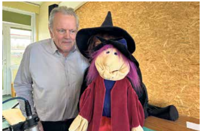
Das Team um die Hexe Bohnenstroh

603 Bücher gelesen worden. Durch eine großzügige Spende der Volksbank konnten wir viele Buchpreise in den Klassen verlosen und alle fleißigen Leser mit einem Lesezeichen und einer Urkunde belohnen. Im Rahmen dieser Aktion fand auch eine beeindruckende Autorenlesung statt. Die „Hexe Bohnenstroh“ kam aus dem Tecklenburger Land angefliegen, um den Kindern der 1. bis 3. Klassen Geschichten aus ihrem Leben zu erzählen. Die Autorin Birgit