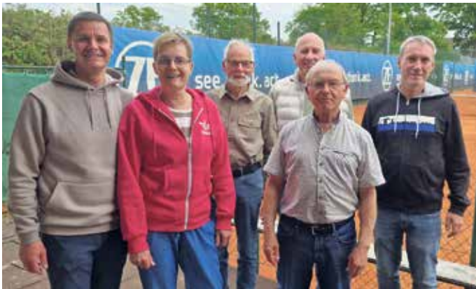
Einige Teilnehmer/Mitglieder aus dem Saison-Eröffnungsturnier.