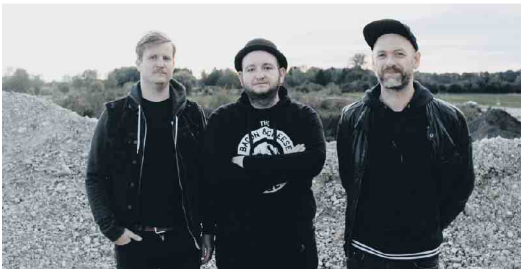
Go Go Gazelle.

2015 das wegweisende Albumdebüt „Große Freiheit“ und inzwischen etliche Nachfolger.