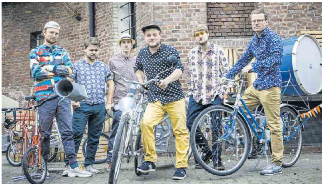
Betrayers of Babylon.

46 Jahre „Umsonst & Draußen“ im Zeichen der Kuh und kein bisschen leise. Wohl kein anderes „Umsonst und Draußen Festival“ hat in Deutschland so oft stattgefunden wie das STEMWEDER OPEN AIR FESTIVAL. Mittlerweile ist es eines der größten Festivals dieser Art in Norddeutschland. Es geht in diesem Jahr am 19. und 20. August in die nächste Runde. Eine lange Zeit, auch für die unermüdlichen Helfer des veranstaltenden Vereins für Jugend, Freizeit und Kultur in Stemwede e.V. (JFK), die zum Teil seit der ersten Stunde dabei sind. Nach den Jahren der Pandemie freuen sie sich darauf, wieder ein ganz normales Festival durchzuführen. Die Altdame unter den Open Air Festivals erfreut sich größerer Beliebtheit denn je. Jährlich pilgern tausende Besucher nach Stemwede. Auch in diesem Jahr wird das Ilweder Wäldchen im fast ganzjährig idyllisch wirkenden Stemwede wieder Kopf stehen. Das überregional bekannte Festival verdankt seine Attraktivität vorwiegend der wunderbaren und unkommerziellen Atmosphäre sowie seines vielseitigen Angebots. Ein buntes Treiben mit einem ganz