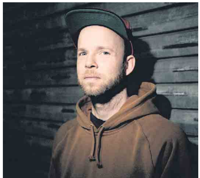
Quichotte - Rapper, Stand-up-Comedian und Autor.