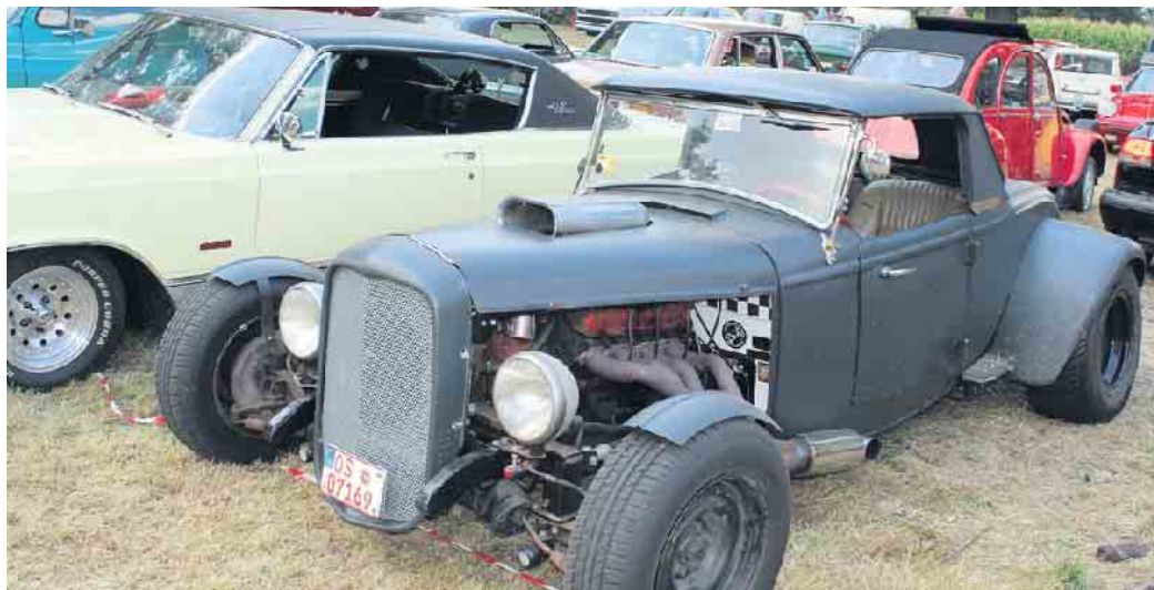
Das Spektrum des „rollenden Museums“ war breit gefächert. Chromglänzende Schätzchen...

HAGEWEDDE/MARL (hm). Jede Menge auf Hochglanz polierte Schätzchen und einige Hundert Oldtimerfans kamen im Laufe des Wochenendes zur vierten Auflage des „H.O.T.“ (Hageweder Oldtimer-Treffen) auf das Gelände am Landgasthof „Zur Eiche“ nach Hagewede. Selbst die Organisatoren zeigten sich einmal mehr freudig überrascht von dem großen Zuspruch. Sowieso hätten die Bedingungen kaum besser sein können. Strahlender Sonnenschein und ein mit Oldtimern, ein bunter Mix aus Treckern, Nutzfahrzeugen, PKWs, Motorrädern, Campern und Caravans, gefülltes Gelände. Vom chromblitzenden Cadillac und Morgan-Threewheeler über einen VW-Käfer aus den Achtzigern, Trabis aus dem letzten Jahrhundert oder knatterten Motorrädern - hier konnte alles bestaunt werden. Historische Traktoren und flotte Camper weckten ebenso das Interesse eines breit gefächerten, mehr oder weniger fachkundigen Publikums. Historische Fahrzeuge sind für alle Generationen ein besonderer Hingucker. Besonders dann, wenn sie blitzblank poliert präsentiert werden. Freunde von Zwei- und Viertaktern hatten ausreichend Gelegenheit zum Fachsimpeln. Immer wieder ging es um das Restaurieren der Fahrzeuge und den damit verbundenen Kosten sowie den aufwendigen Schraub- und Lackierarbeiten. Das Hageweder Oldtimer-Treffen hat inzwischen eine große Fangemeinde. Kamen die Fahrzeugbe-