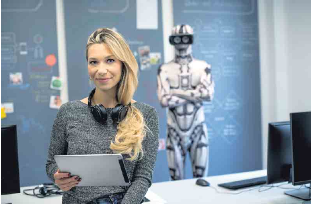
Im Master-Studiengang kann man zur Digital-Expertin werden.

Neue Geschäftsmodelle dank digitaler Transformation