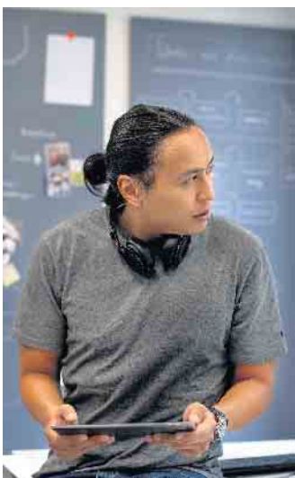
Technologisches und digitales Fachwissen erwerben - mit dem Master „Business Transformation Management“.