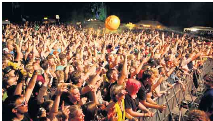
Stewweder Open Air.