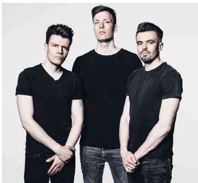
Black Stains.