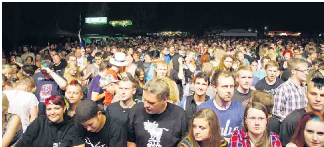
Stemweder Open Air.

Die EXCREMENTORY GRINDFUCKERS sind die uneingeladenen Gäste, die auf jeder Party alles wegsaufen. Die fünf Grindcore-Trottel aus Hannover haben es sich zur Aufgabe gemacht, die Grenzen des schlechten Geschmacks neu zu definieren, was sie seit mehr als 20 Jahren und mittlerweile acht in Eigenproduktion erstellten Tonträgern erfolgreich tun. Ihr Ziel: Die ach so ernste Metalszene komplett zu verhorsten. Mit einem Sound zwischen Hans Zimmer, Schlager, und platzender Luftpolsterfolie verschleiern sie Anspruch und Ambi-