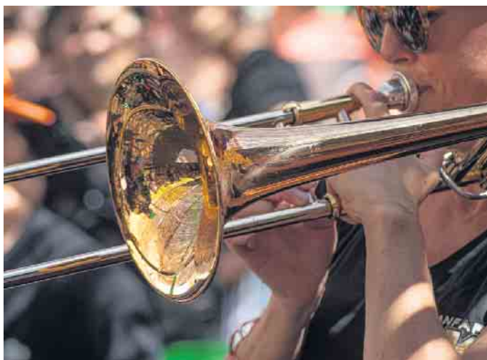
Alle aktiven und ehemaligen Bläserinnen des Posaunenchores Oppenwehe sind eingeladen, beim Jubiläumskonzert mitzuwirken (Symbolfoto).