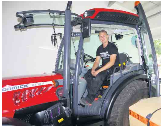
Schweres Gerät sicher beherrschen: Die Leidenschaft für Technik ist eine gute Voraussetzung für eine Ausbildung im Motorgeräte-Fachhandel.