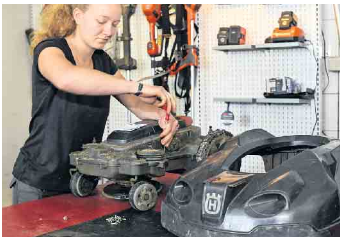
Bei mechatronischen Berufen stehen Wartung und Reparatur von Garten- und Outdoorgeräten im Mittelpunkt.

info@siefker-haustechnik.de www.siefker-haustechnik.de