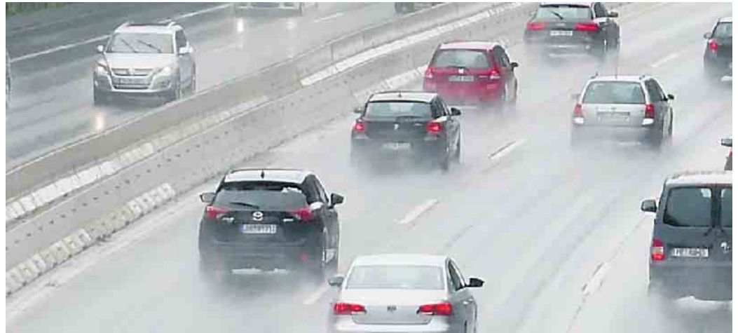
Starkregen kann zur echten Gefahr für Autofahrer werden.