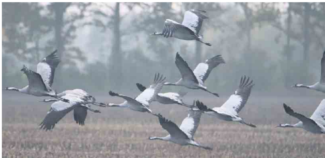
Kraniche fliegen vom Feld auf (Symbolfoto).

Dort sind viele interessante Schautafeln über die heimischen Pflanzen und Tiere zu finden. Vom Turm aus hat man einen schönen Blick über das Moor. Mit etwas Glück sind von dort aus und auch entlang der Strecke die beeindruckenden „Vögel des Glücks“ zu beobachten. Tagsüber bei der Nahrungssuche sind sie häufig auf den abgeernteten Maisäckern zu finden. Im Herbst rasten bis zu 80.000 Kraniche auf ihrem