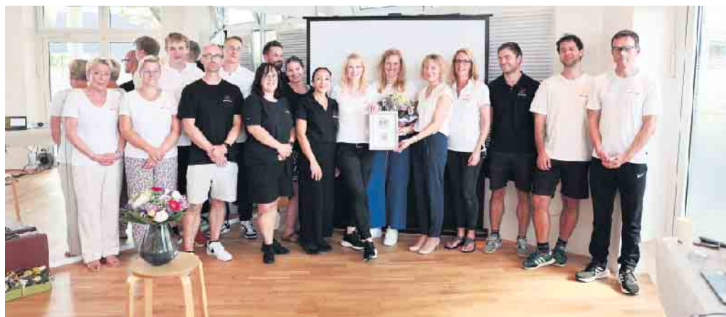
Ein Teil des AKTIVITA-Teams am Gesundheitstag.

Das Team des AKTIVITA Kur- und Gesundheitszentrums freut sich darauf, Sie an den Standorten SoleSpa, PhysioMed und B.E. GYM willkommen zu heißen.