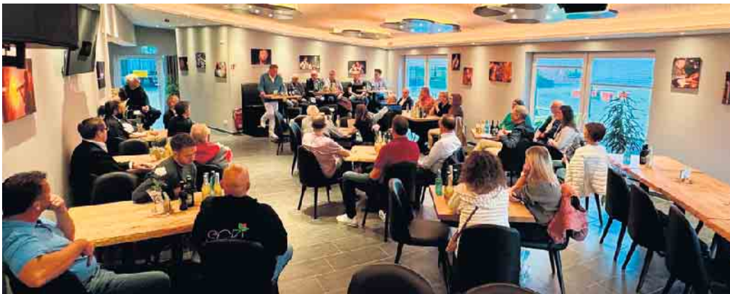
Im Kulturtreff Q am Life House informierte Bürgermeister Kai Abruszat über das Projekt und betonte die Bedeutung und die Strahlkraft des neuen Jugend-, Sport- und Freizeitzentrums.

Spiel- und Abenteuerparadies, welches östlich der neuen Parkplätze entsteht. „Dies wird weit und breit einmalig sein“ stellte der Bürgermeister heraus. Es enthält ein Turm- und Klettermodul, eine Seilbahn, eine Sandanlage und einen Rutschbereich auf einem naturnahen Spielplatz mit Toiletten.