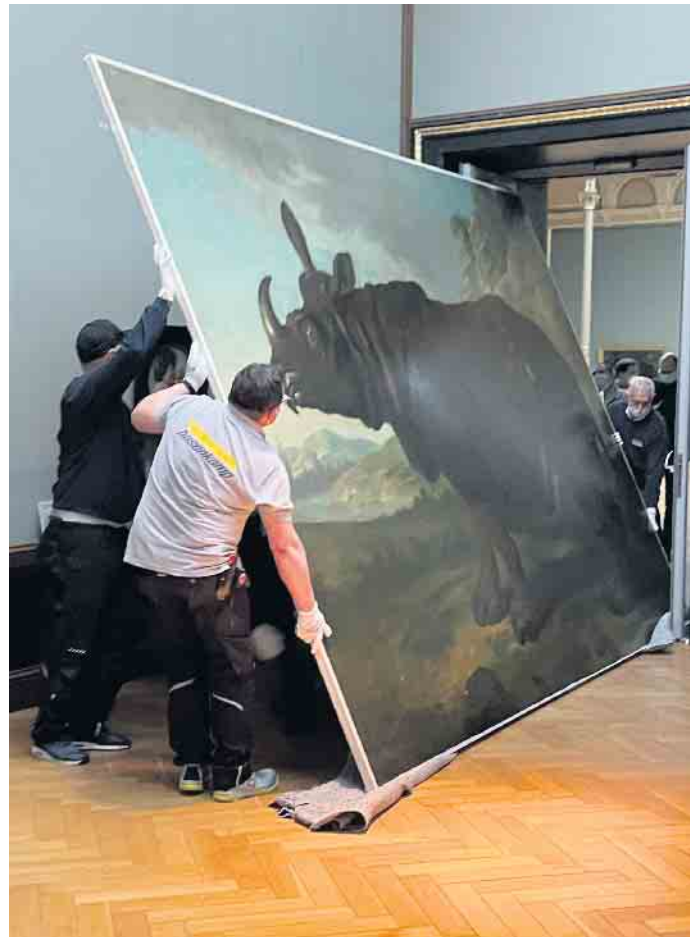
Das Gemälde von Nashorn Clara hängt üblicherweise im Staatlichen Museum Schwerin. Da das Haus wegen Renovierungsarbeiten für drei Jahre geschlossen ist, ging Clara mit großem Aufwand auf Reisen - unter anderem ins berühmte Rijksmuseum nach Amsterdam.

Das Kölner Traditionsunternehmen hat sich im Firmenbereich „Fine Arts“ auf den Transport von Kunst- und Kulturgütern