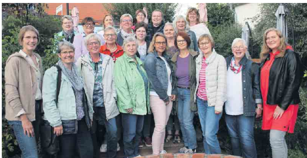
Das Vorstandsteam freut sich über viele Lesepaten.

Verbindung zwischen den Vorlesern und den Kindern, die begeistert den Erzählungen lauschen. Doch nicht nur die Kinder profitieren von der Aktion, auch die Vorlese-Paten selbst gewinnen viel durch ihr Ehrenamt. Es ist eine persönliche Bereicherung, Wissen weiterzugeben und aktiv und engagiert zu bleiben. Durch das Vorlesen können sie ihre Freizeit sinnvoll nutzen und gleichzeitig einen wertvollen Beitrag für die Gesellschaft leisten.