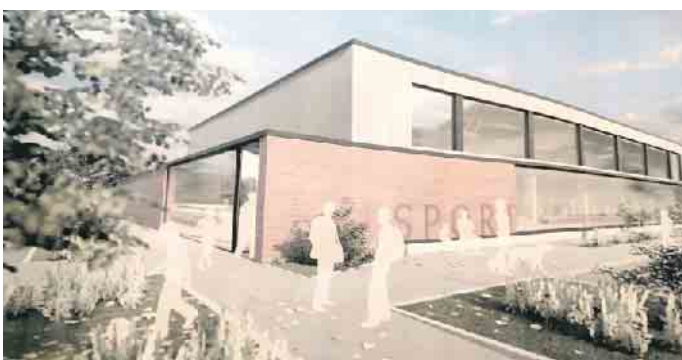
Blick in die Zukunft: So soll der zukünftige, moderne Eingangsbereich zur Zweifach-Sporthalle einmal aussehen.

Abruszat dankte zudem den Vereinen und Schulen für ihr Verständnis für die vorübergehenden baulichen Einschränkungen und wünschte den bauausführenden Partnern, Architekten, Planern und Unternehmen gutes Gelingen und viel Freude an diesem ganz besonderen Projekt. Denn: „Kinderlärm ist Zukunftsmusik“, versicherte Kai Abruszat.