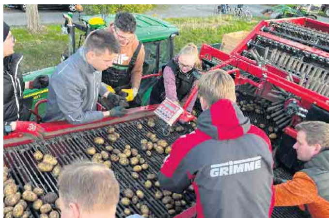
Die fleißigen Helfer bei der Kartoffelernte.