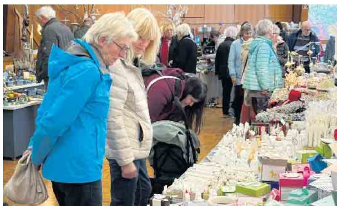
Mehr als 50 Kunsthandwerkerrinnen und Kunsthandwerker präsentierten bei der „STiK“ in Wehdem ihre, mit viel Liebe und Einfallsreichtum, gefertigten Werke.