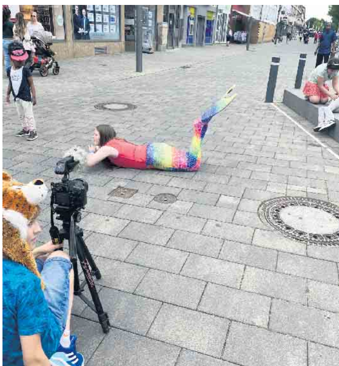
Teilnehmer*innen lernten das Handwerkszeug zur Erstellung ihrer allerersten eigenen Filme.