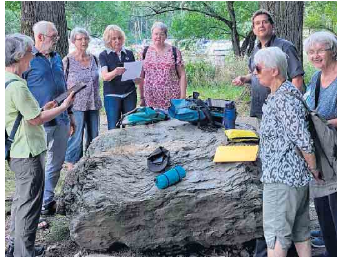
Fröhliche Singwanderung des Troisdorfer Gospelchores

„Let's Go Gospel“ der Chor in dem du willkommen bist!