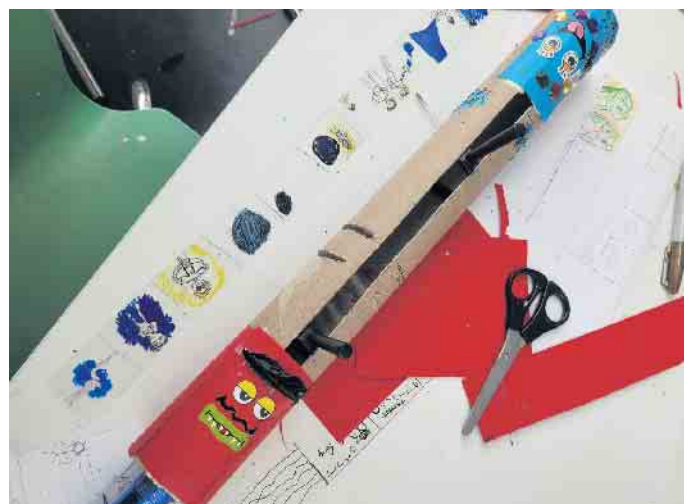
Teilnehmer*innen bastelten einen eigenen analogen Beamer, mit dessen Hilfe Bilder mit Licht an die Wand projiziert werden konnten.