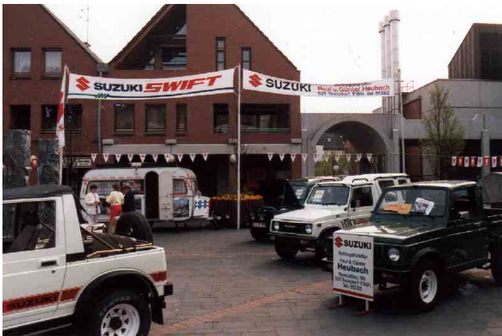
Seit 1982 Partnerschaft mit Suzuki. 1987 Ausstellung auf dem Wilhelm-Hamacher-Platz in Troisdorf-Mitte.