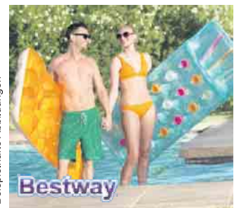
* Beispielhafte Abbildungen