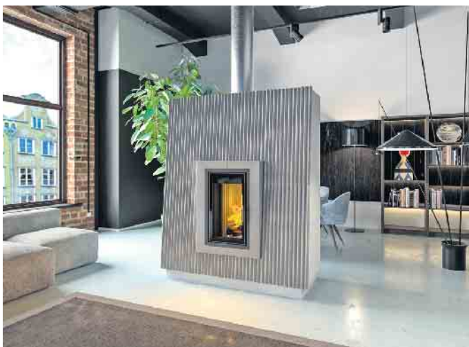
Ein Kachelofen mit modernem Design verleiht dem Raum einen individuellen Charakter.