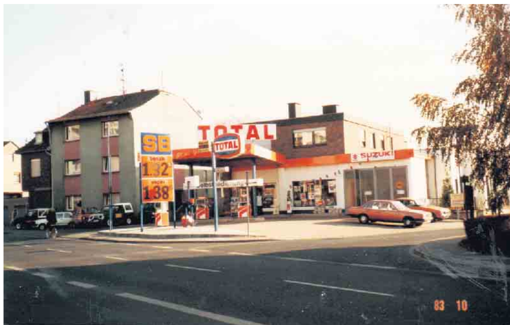
Die Tankstelle im Jahr 1984.