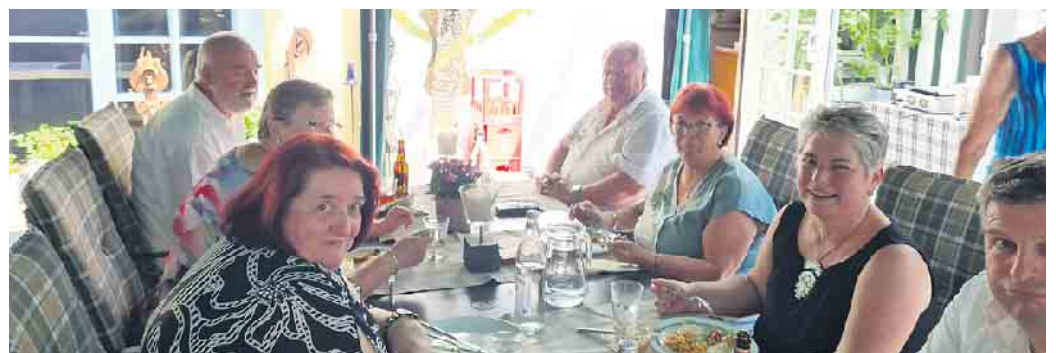
„Verzällche un Laache“ beim Sommerfest