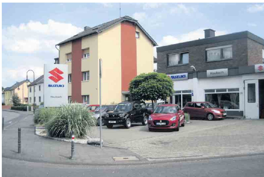
Autohaus Heubach 2023.