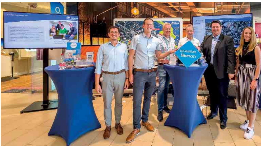
Bürgermeister Alexander Biber und das Team der Stabsstelle Digitalisierung präsentieren das digitale Rathaus beim diesjährigen Digitaltag Mitte Juni in der Galerie Troisdorf.

Mit der Einführung des digitalen Rathauses setzt die Stadt Troisdorf einen Wunsch vieler Bürger*innen und gleichzeitig ein weiteres Projekt der Troisdorfer Smart City Strategie um. Über 1.400 Rückmeldungen Troisdorfer Bürger*innen sind in die Smart City Strategie eingeflossen. Mehr Informationen zu der Strategie und den 28 Smart City-Projekten unter: www.troisdorf.de/smart-city .