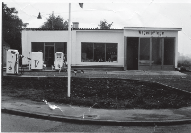
Die Tankstelle nach der Fertigstellung 1963.