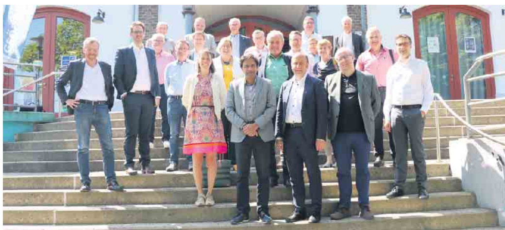
Energieagentur Rhein-Sieg: Anfang Juni trafen sich die Mitgliedskommunen der Energieagentur zur jährlichen Mitgliederversammlung in der Hennefer Meys Fabrik.

Wie könnte es anders sein - auch der Alltag der Energieagentur Rhein-Sieg wurde im Jahr 2022 maßgeblich von den Entwicklungen der Energiemärkte geprägt. Angesichts explodierender Gas- und Strompreise sowie einer drohenden Energie-