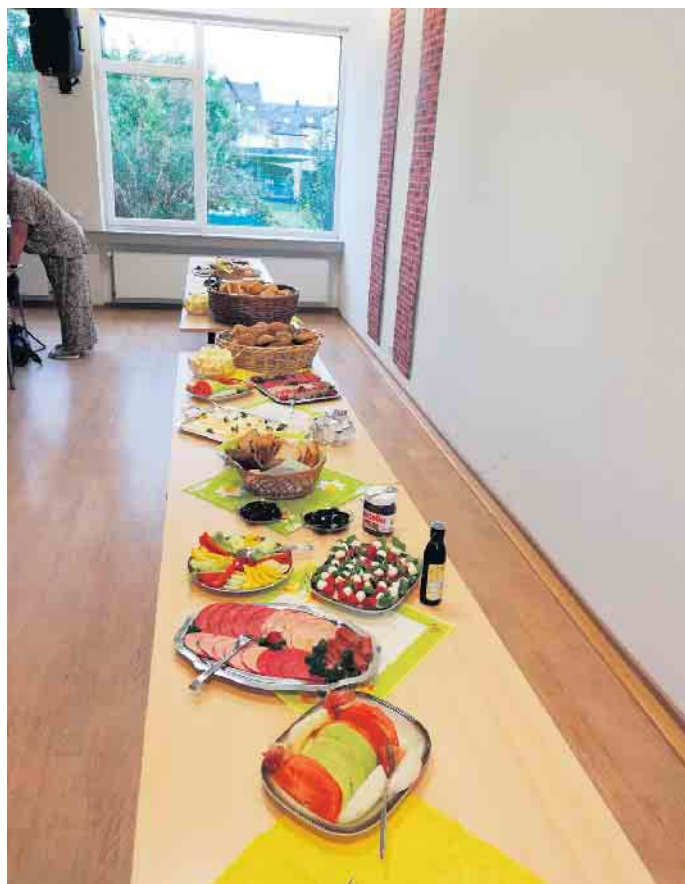
Vorbereitung für das Frühstücksbuffet