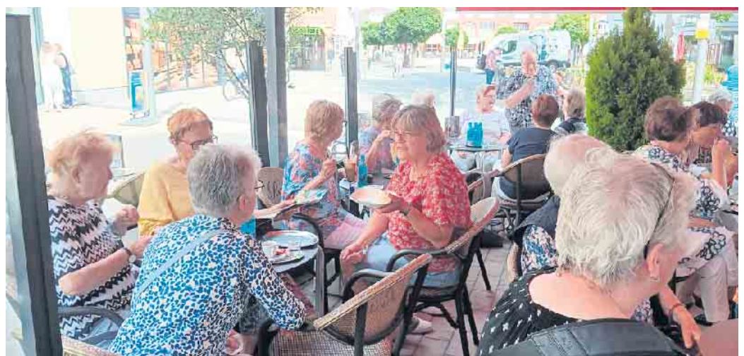
Kleine Verschnaufpause vor der Probe