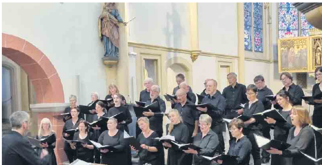
Konzert in Siegburg im Juni: Englische Kathedralmusik

Weitere Informationen finden Sie unter www.konzertchor-rhein-sieg.de , oder Sie melden sich direkt beim Chorleiter Georg Bours unter 02242 -866792.