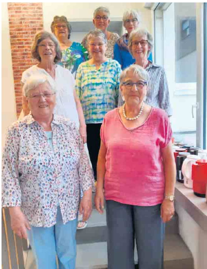
Das Leitungsteam kfd St Mariä Himmelfahrt Spich