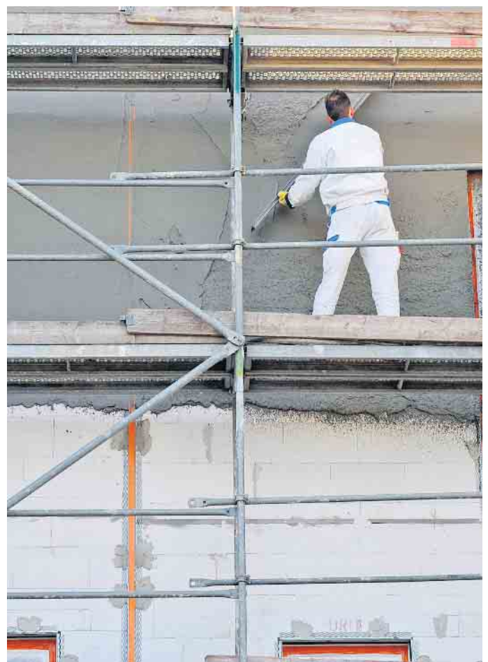
Wenn das „richtige“ Unternehmen als Vertragspartner gefunden wurde, kann es mit dem Bau endlich losgehen.