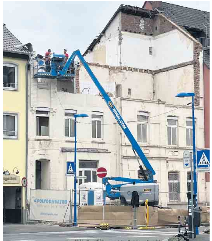
Die alten Fassaden an der Wilhelmstraße „weichen“ einer neuen Nutzung.

die Pflicht zu nehmen. Vor wenigen Jahren wurden die Häuser schließlich aus der Denkmalliste gestrichen und damit der Weg frei gemacht für eine andere, sicherlich auch sehr sinnvolle Nutzung der Grundstücke. Manchmal muss Altes weichen, um Neues zu entwickeln; allerdings schmerzt der Verlust angesichts einer mit historischen Fassaden nicht besonders reich gesegneten Stadt doch sehr, zumal auch die Umgebung - in der Denkmalpflege spricht man von Ensembles - noch wenige schöne Denkmäler, u.a. die Johanneskirche, aufweist. Mit etwas gutem Willen wären zumindest die Fassaden der Häuser zu retten gewesen. In Siegburg ist dies beispielsweise beim Stammhaus der Firma Henrich an der Wilhelmstraße vorbildlich gelungen, in dem man hinter die historische Fassade ein modernes Haus gesetzt hat. Dies ist allerdings oft mit erhebli-