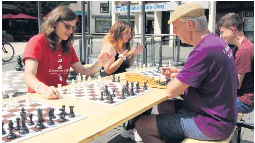
Während auf dem Hamacher-Platz die schon Versierteren antraten...

Anfänger sind genau so gerne gesehen wie Fortgeschrittene.