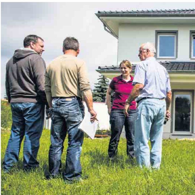
Bei der Suche nach einem geeigneten Baupartner kann auch die Besichtigung bereits errichteter Referenzobjekte dieses Anbieters helfen.

Werbeprospekte des Baupartners enthalten nur allgemeine Informationen und taugen daher nicht als Grundlage für ein Hausangebot. „Bauherren sollten auf komplette Unterlagen bestehen“, lautet der Rat von Erik Stange. Dazu gehöre eine umfassende, gesetzeskonforme Bau- und Leistungsbeschreibung, der Vertrag mit Zahlungsplan und die Grundrisse mit Angaben zur Wohnfläche und zur genauen Bemaßung. Auch ein detailliert aufgeschlüsselter Preis darf nicht fehlen. Gegebenenfalls muss er zudem gewünschte Sonderleistungen oder Gutschriften für Eigenleistungen enthalten, die nach Lohn- und Materialanteil aufgeschlüsselt sind. (djd)