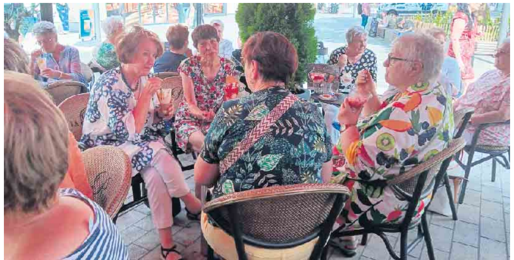
Mitglieder des Chores