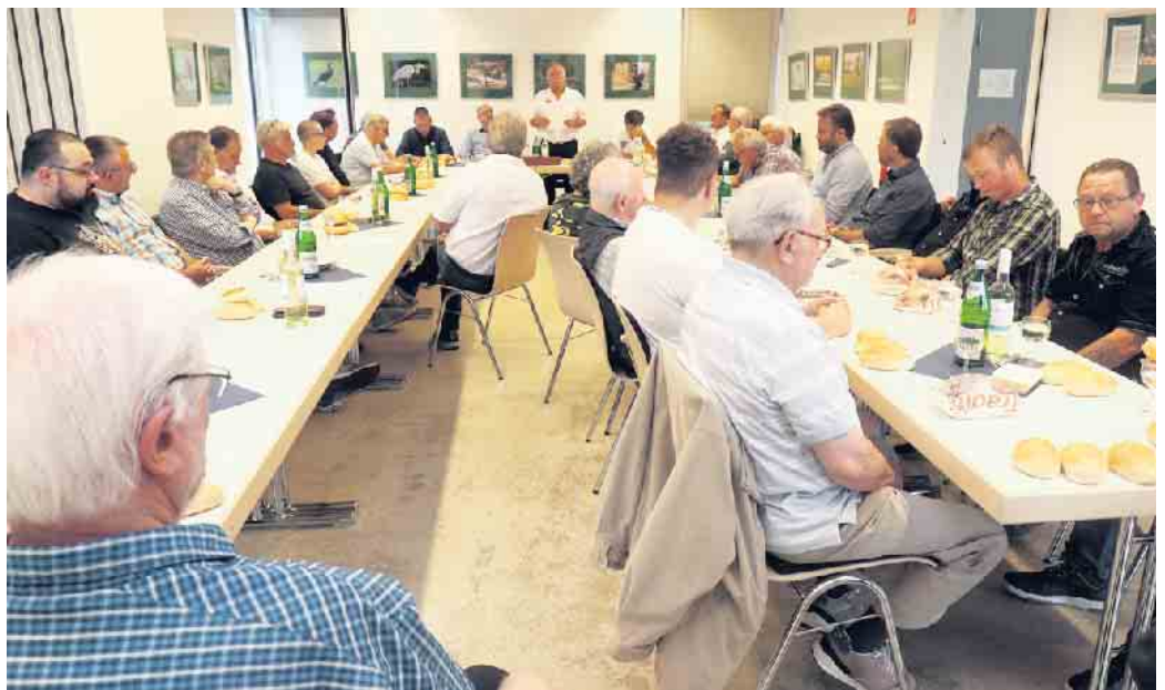
Fast 40 Mitglieder folgten der Einladung zum Johannesgeding der Fischereibruderschaft.