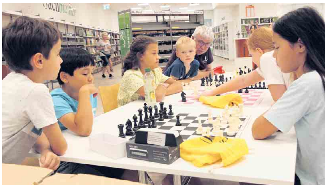
... waren es später in der Stadtbibliothek die Jüngsten, die sich im Mattsetzen versuchten.