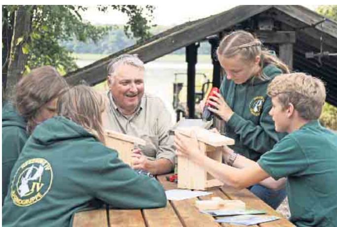
Aus unbehandeltem Holz lässt sich ein neuer Nistkasten ganz leicht selberbauen.

Eine einfache und ausführliche Bauanleitung findet sich unter www.jagdverband.de . Gut geeignet ist 20 Millimeter dickes unbehandeltes Holz, etwa von Eiche, Robinie oder Lärche. Beim Anbringen sollte man darauf achten,