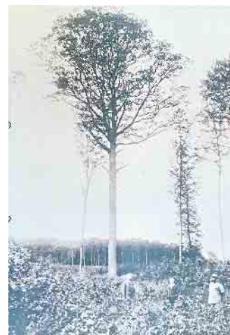
Die Schnacke Eiche