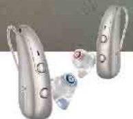
Pure Charge&Go BCT IX