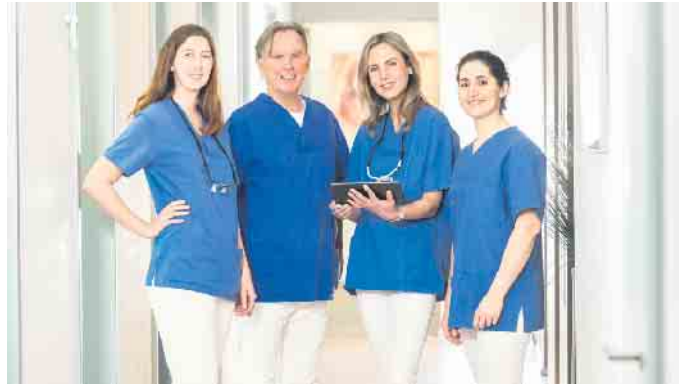
Das Team der dental suite im Kölner Rheinauhafen

Herausnehmbarer Zahnersatz stört nicht selten beim Sprechen und auch die Angst vor dem Versagen der Haftcreme bleibt immer im Hinterkopf präsent. All-on-4® Zahnersatz ist hingegen