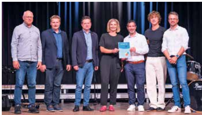
Mit einer Feierstunde würdigte das Gymnasium die Anerkennung seiner Arbeit im Sinne der UNESCO.

Die Feier wurde von musikalischen Beiträgen, Präsentationen von Schülerprojekten und Grußworten begleitet. Schülerinnen und Schüler präsentierten Projekte zur nachhaltigen