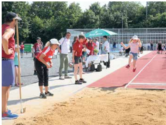
Zum kleinen Eröffnungs-Sportfest gehörte ein Weitsprungwettbewerb für Kinder und Erwachsene, durchgeführt von Aktiven des BV 09 Drabenderhöhe.

Der Dank von Bürgermeister Ulrich Stücker galt allen an dem Projekt Beteiligten, darunter dem Stadtrat, dem Stadtsportverband, den Ver-