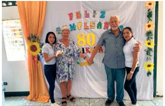
Vorstand der Nicaragua-Hilfe Bonn: (v.l.)