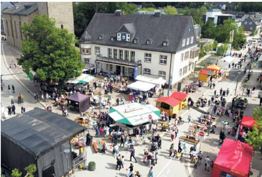
Rund ums Rathaus steigt am 4. Juli das Fest „Wiehl feiert!“.

Haben Sie Fragen zur Verteilung dieser Zeitung?