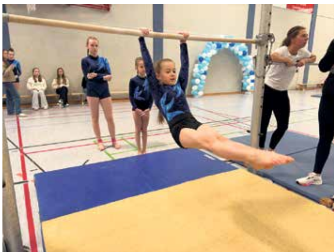
Tolle Leistung am Barren