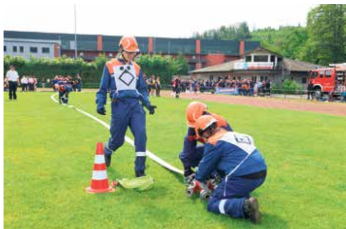
Aufbau eines Löschangriffs bei der Abnahme der Leistungsspange im Stadion