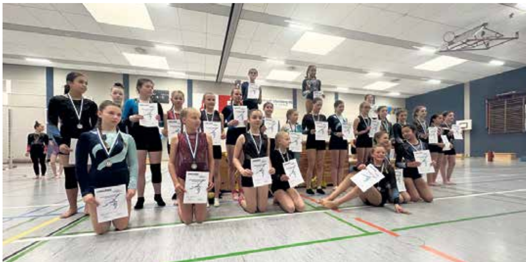
Turnerinnen bei der Siegerehrung.

Spannende Wettkämpfe bei den jungen Turnerinnen