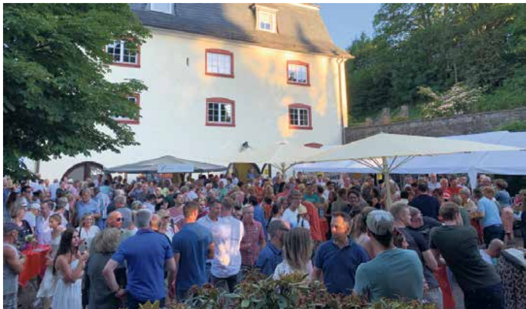
Das Fest „Wein & Musik“ zieht Jahr für Jahr zahlreiche Gäste ans Bielsteiner Burghaus.