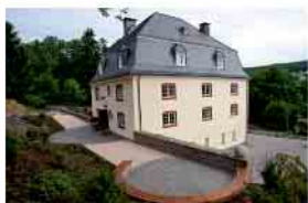
Burghaus Bielstein Frühjahr 2026