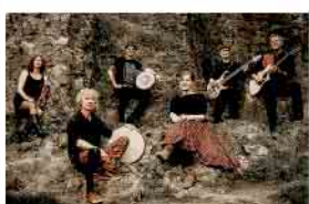
Irish Stew 27.03.26 · 20 Uhr