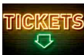
Tickets ab dem 27.10.25 erhältlich!