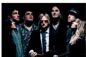
Echo 13.03.26 · 20 Uhr