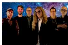
The Right Thing 14.03.26 · 20 Uhr