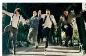
Monsieur Pompadour 26.02.26 · 20 Uhr