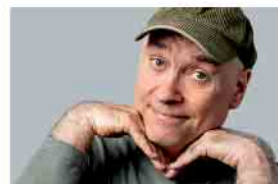
HG. Butzko 05.02.26 · 20 Uhr