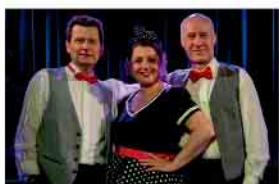
Ich zähle täglich meine Sorgen 19.02.26 · 20 Uhr