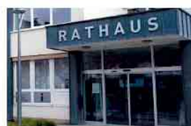
Wiehl-Ticket Tel. 02262-99285