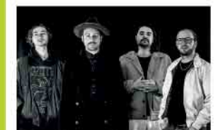
Mr. Tambourine Man 12.03.26 · 20 Uhr