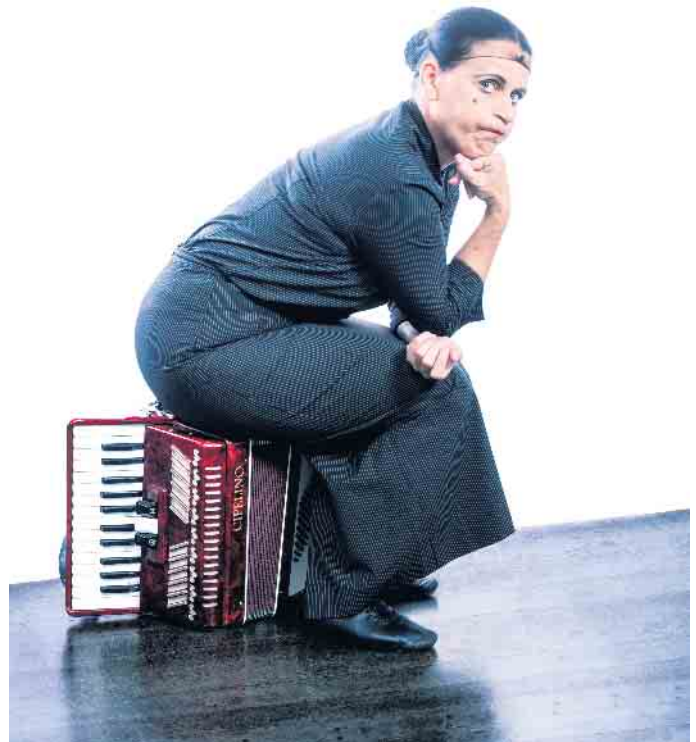
Als „Kakerlake of Kalauer“ feiert La Signora ihr 20-jähriges Bühnenjubiläum - mit einem Auftritt im Stadtteilhaus Drabenderhöhe.

Tickets und weitere Infos über die Internet-Seite: kulturkreis-wiehl.de