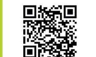
oder über www.kulturkreis-wiehl.de