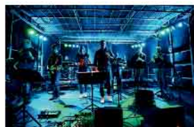
Nachtexpress 29.01.26 · 20 Uhr