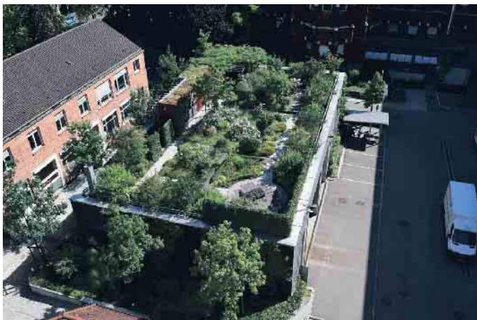
Auch Gärten sind auf Dächern möglich, es wird dann von einer intensiven Dachbegrünung gesprochen.

neuen Inhalten, einer freiwilligen Lehrwoche Energietechnik und zusätzlichen Qualifikationen wie dem PV-Manager. Das Fazit: Wer heute Dachdecker*in wird, entscheidet sich für einen Beruf mit Zukunft - und mit Verantwortung für eine klimafeste Gesellschaft. Wer mehr über eine Ausbildung im Dachdeckerhandwerk erfahren möchte, wird zum Beispiel hier fündig: www.dachdeckerdeinberuf.de (akz-o)