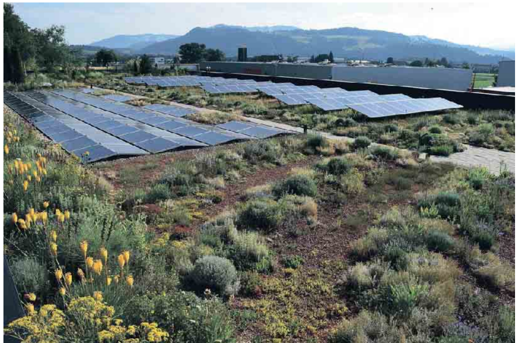
Die perfekte Kombi: Photovoltaik und Gründach.

Laut des Berichts bringt das Dachdeckerhandwerk das nötige Fachwissen mit und arbeitet gewerkeübergreifend, etwa mit Elektrikern, Landschaftsbauern oder dem SHK-Handwerk. Genau solche Kompetenzen werden aktuell in der Aus- und Weiterbildung weiter gestärkt - mit