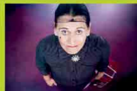
La Signora 19.03.26 · 20 Uhr