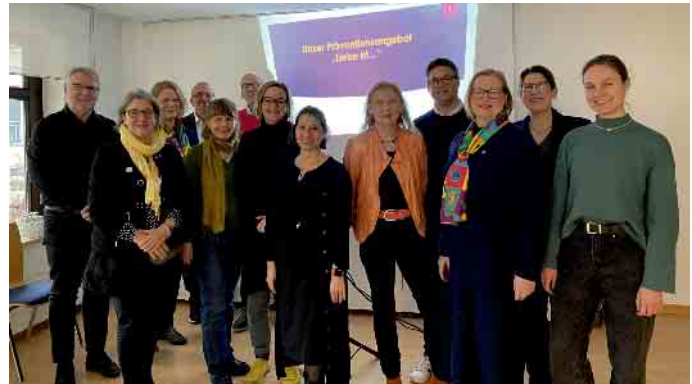
Das Team des Frauenzentrums und Mitglieder des Lions Club Rhein-Sieg

Dazu bieten wir im Oktober 2025 ein „Train the Trainer“-Seminar