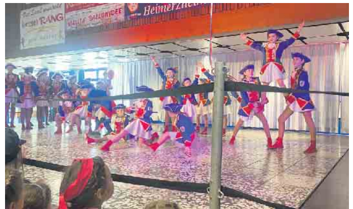
Die Tanzgruppen der Ehrengarde bereicherten das Bühnenprogramm.