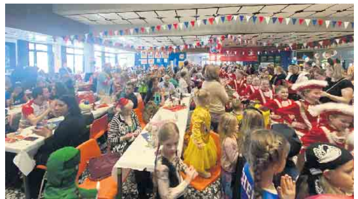
Gute Stimmung in der vollbesetzten Aula