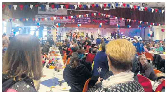
Groß und Klein feiern bei der Kindersitzung in Heimerzheim.