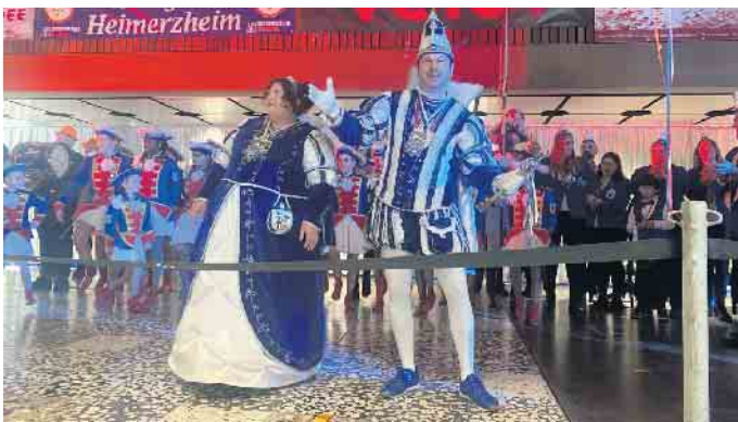
Das Heimerzheimer Prinzenpaar 2025

kestände, ein großes Kuchenbuffet sowie eine Pommestube vor der Eingangstüre, in der Mitglieder der Ehrengarde keine Mühen an der Fritteuse scheuten, um die Gäste zu versorgen. Die Kinder feierten mit ordentlich Power und guter Laune bei Spielen auf der Bühne und davor. Und auch der eine oder andere Elternteil kam bei soviel guter Laune ins Schunkeln und Tanzen (svs).