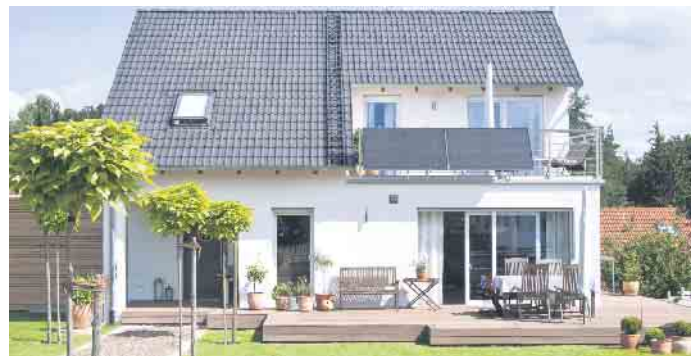
Balkonkraftwerke sind aber auch für Hauseigentümer interessant, die sich eine Photovoltaik-Anlage auf dem Dach nicht leisten können oder wollen.

Der mögliche Ertrag eines Balkonkraftwerks lässt sich berechnen, indem man online einen sogenannten Stromspar-Checker nutzt. Wo soll die Anlage aufgestellt werden? Wo in Deutschland scheint wie oft und wie lange die Sonne? An wie vielen Tagen regnet es und in welchem Winkel trifft die Sonne am eigenen Standort auf die Solarmodule? All das sind Variablen, die für die Berechnung des Ertrags eine Rolle spielen. Der Rechner unter www.yuma.de greift dabei auf verlässliche Daten aus nationalen und internationalen Quellen und Datenbanken zurück und gewährleistet möglichst realistische Ergebnisse. (DJD)