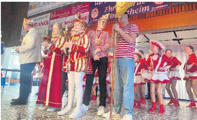
Hoher Besuch der Tollitäten aus Ollheim