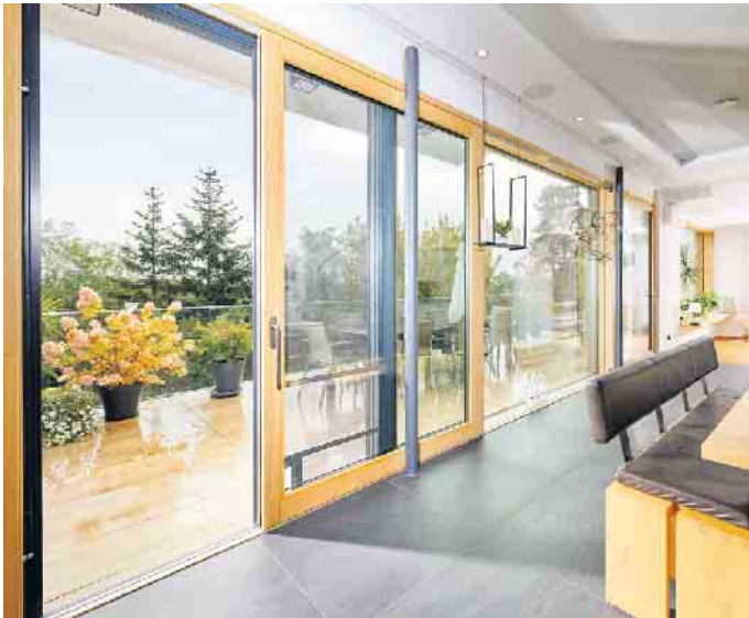
Holzfenster: der nachhaltige Klassiker.

reinigen. Gerade im Herbst vor der kalten Jahreszeit ist das wichtig. Das erhöht die langfristige Funktionssicherheit von Fenstern und Balkontüren beträchtlich.“ (VFF/FS)