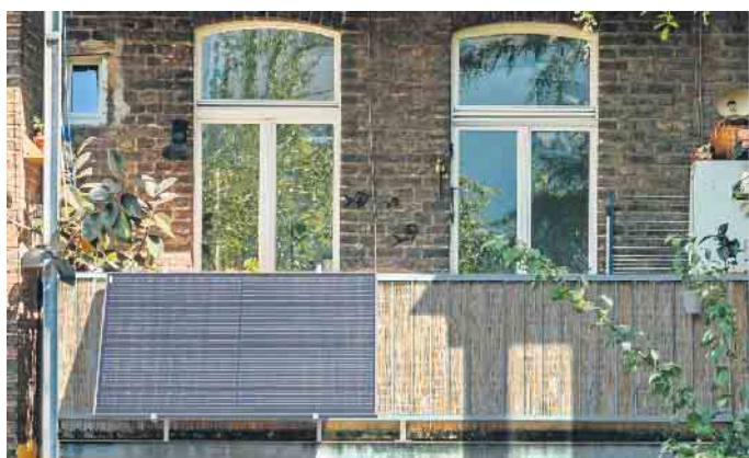
Mit einer Mini-Solaranlage können sich nicht nur Mieterinnen und Mieter auf unbürokratische Weise an der Energiewende beteiligen, sie ist auch für Hauseigentümer interessant, die sich eine größere PV-Anlage auf dem Dach nicht leisten können oder wollen.