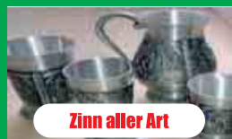
Zinn aller Art