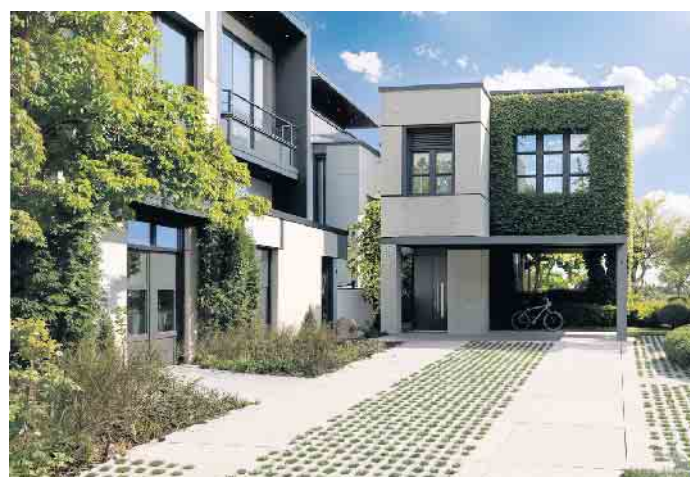
EXEO®Green - die moderne Lösung für nachhaltige Außenanlagen mit Format