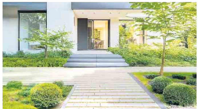
Tinella®Naturfuge - Platz für Grün, Wasser und mehr in der Fuge