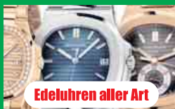
Edeluhren aller Art

Wir zahlen zur Zeit bis zu 150,- Euro* pro Gramm für M-Schmuck