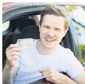
Den Führerschein in der Tasche zu haben, ist für junge Leute ein Meilenstein.

Eine wichtige Rolle bei der Auswahl der Kfz-Versicherung spielen für die meisten jungen Menschen der Umfrage zufolge vor allem der Preis (72,1 Prozent) und der Kundenservice (52,6 Prozent). Interessant dabei: Es gibt nur geringe Unterschiede zwischen den Geschlechtern, was die Prioritäten angeht. Allerdings legen Männer etwas mehr Wert auf Online-Services, während Frauen eine persönliche Geschäftsstelle vor Ort wichtiger finden. (DJD)