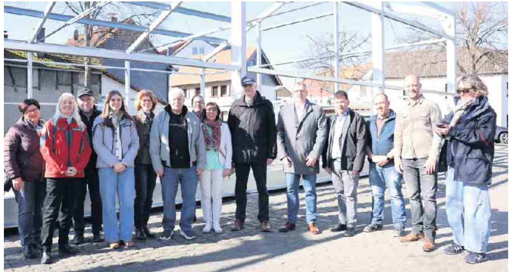
Bürgermeister, Ortsausschuss, Johanniter, Malteser und Gäste besichtigen die Baustelle der Leichtbauhalle.

Die Johanniter-Unfall-Hilfe stellt eine Leichtbauhalle bereit, die bis zur Fertigstellung der neuen Mehrzweckhalle Flerzheim als Zwischenlösung auf dem Dorfplatz bleiben wird. Gefördert wird das Projekt von den Johannitern mit 289.016 Euro . Die Malteser beteiligen sich mit 100.000 Euro an dem Bauprojekt, das beide Organisationen