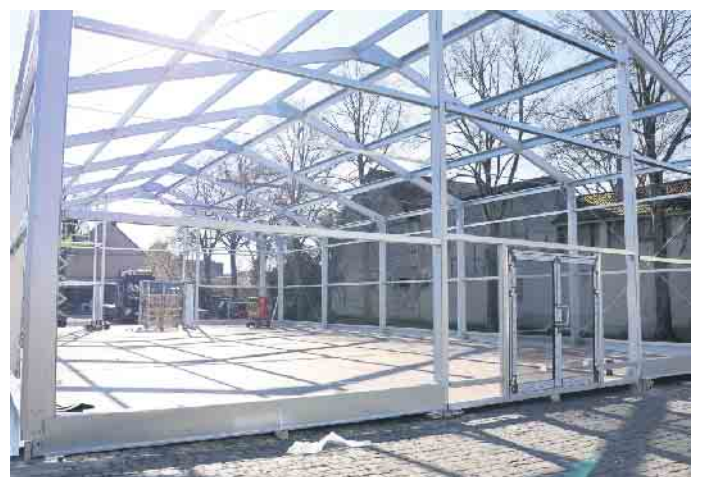
Das Gerüst der neuen Leichtbauhalle steht bereits, bald können hier wieder Veranstaltungen stattfinden und Vereine aktiv werden.