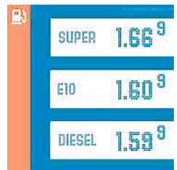
Auch der ADAC rät, das deutlich preiswertere Super E 10 zu tanken. Infos unter dat.de/e10 .

Mein genereller Tipp: Im Sommer leichte, helle Kleidung tragen und immer viel trinken. Werner Müller