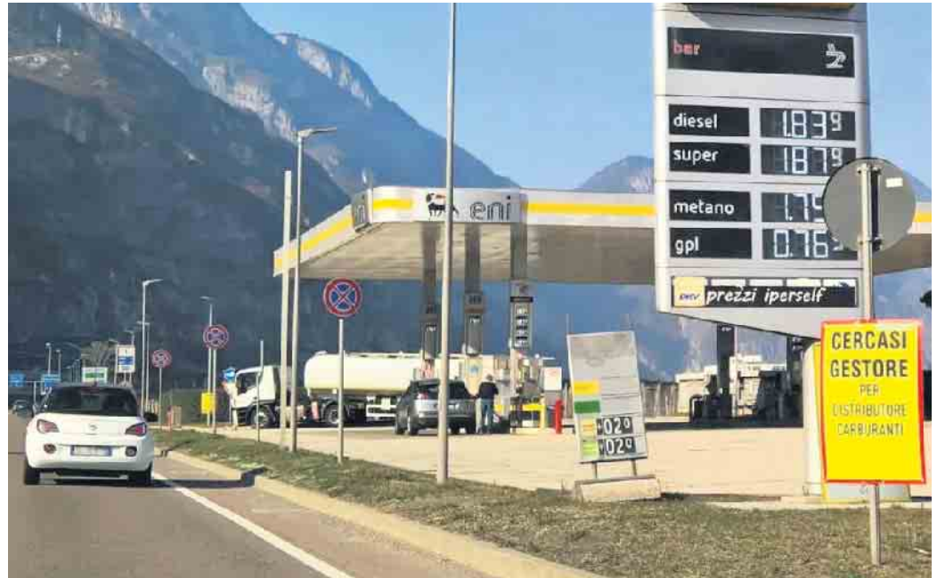
Tanken im Urlaubsland kann teuer werden. Vorher informieren und eventuell in Deutschland noch mal voll tanken.

Nach der Arbeit oder dem Einkauf steht das Auto in der sengenden Sonne und ist innen über 50 Grad heiß. Abhilfe: das Fahrzeug im