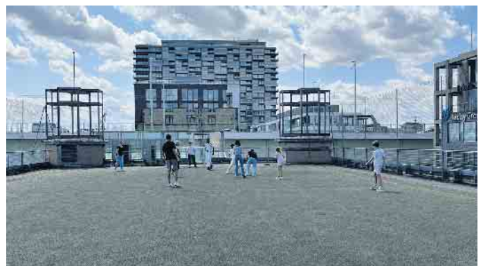
Einige Teilnehmer der Gruppe beim Fußballspiel

Der Tag zeigte eindrucksvoll, wie niedrigschwellige Begegnungsformate im Sport Brücken bauen können - zwischen Herkunft und Zukunft, zwischen Teilnehmenden und Gestaltenden. Der Ausflug war damit nicht nur eine lehrreiche Reise in die Geschichte des Sports, sondern auch ein motivierender Impuls für die Zukunft.