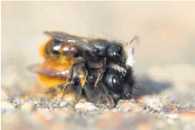
Gehörnte Mauerbiene.

Tipps vom Amt für Umwelt - und Naturschutz des Rhein-Sieg-Kreises