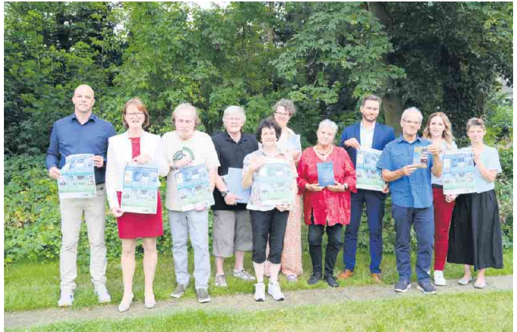
Teilnehmerinnen und Teilnehmer der diesjährigen Lesetage mit den Vertretern der Gemeinde Swisttal

Am Montag, 30. September, um 19 Uhr findet ein Event zum historischen Motorsport im Dorf-