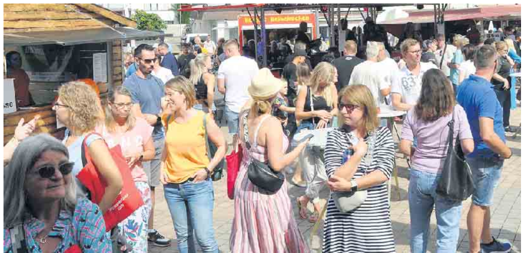
Dicht an dicht flanieren die Besucher in Bornheims City.

Besuchen Sie uns auf der Gewerbeschau Bornheim am 1.9.2024!