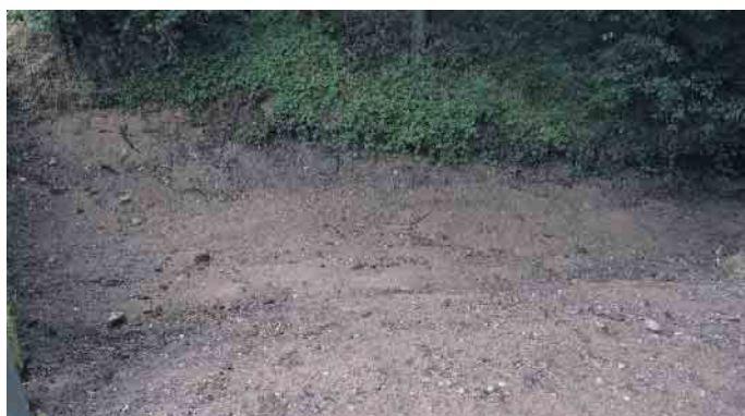
Die Sedimentablagerungen im Bachbett

und hinter der Brücke ein Teil des Bachbettes abgetragen; der Kies unter der Brücke wird in den freigeräumten Bereich ins Unterwasser gespült. Diese Arbeiten werden erledigt, wenn der Orbach kein Wasser führt. Der Bereich unter der Brücke wird sozusagen „durch den Bach gesäubert“ - das unter den Brücken befindliche Geschiebe wird durch den Wasserlauf in die freigeräumten Bereiche geschwemmt und bei den nächsten Unterhaltungsarbeiten entfernt.