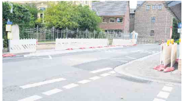
Die Fahrbahn mit den neuen Markierungen

rienzzeit- zur Umsetzung der Maßnahme vorgesehen. Erfreulicherweise konnte die Maßnahme durch die ausführende Firma Scheiff vor dem Zeitplan fertiggestellt werden. Nachdem zum Abschluss die Markierungsarbeiten durchgeführt wurden, kann die Fahrbahn seit dem 31. Juli wieder befahren werden.