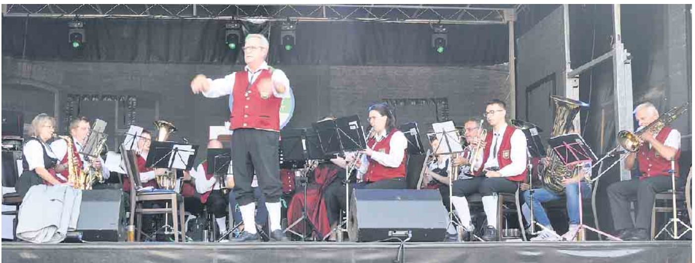
Die örtlichen Musikvereine sorgen mit ihren Konzerten für tolle Stimmung.