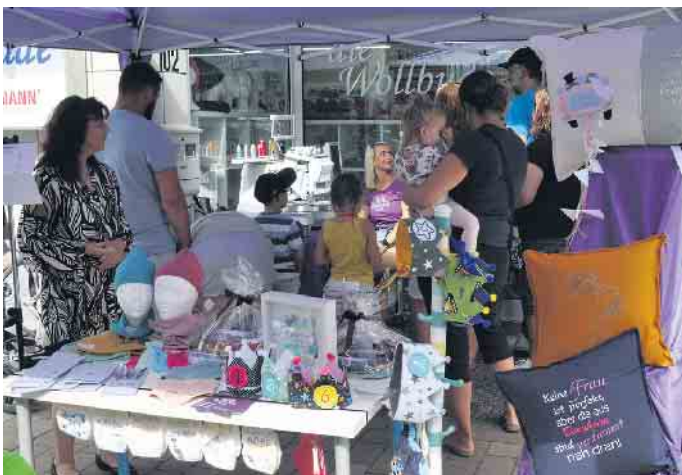
Am Tag der offenen Tür dürfen sich die teilnehmenden Geschäfte wieder auf großes Interesse freuen.

Sie werden mit vielen neuen Eindrücken, bester Laune und vielleicht dem einen oder anderen Geschenk oder Erwerb nach Hause gehen. (WDK)