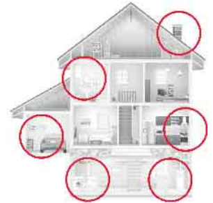
Es gibt viele potenzielle Kohlenmonoxid-Gefahrenquellen.

Sofort das Gebäude verlassen! Insofern es keinen unnötigen Zeitverlust bedeutet, sollten dabei noch Fenster und Türen geöffnet werden, um möglichst viel Sauerstoff ins Gebäude zu lassen. Hierin liegt ein wesentlicher Unterschied zum Verhalten im Brandfall, wo empfohlen wird, Türen und Fenster zu schließen. Beim Verlassen