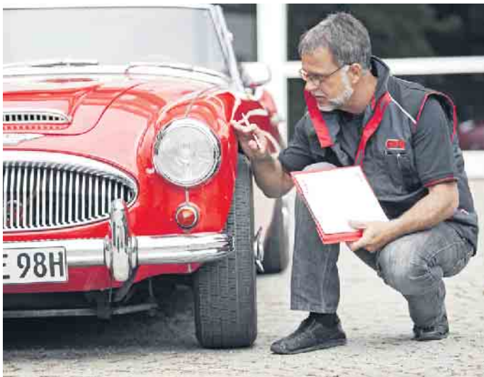
Vor der Erteilung eines H-Kennzeichens muss erst ein Ingenieur das Auto überprüfen und die Originalität beurteilen.

Exakt drei Jahrzehnte nach ihrer Erstzulassung können Autos ein H-Kennzeichen bekommen. Aber längst nicht alle Oldtimer fahren auch mit H.