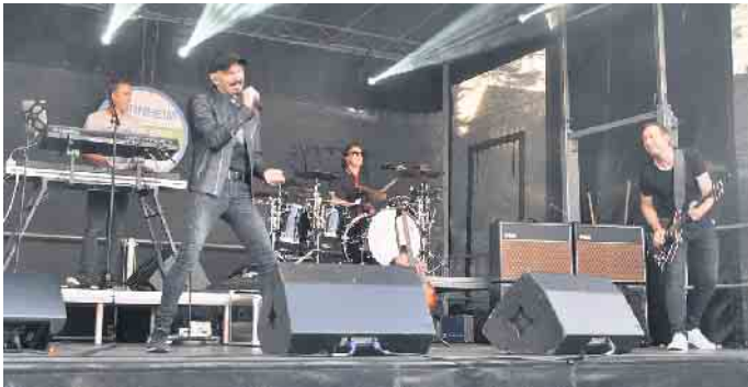
Auf der Showbühne lassen es auch dieses Jahr die Künstler wieder richtig krachen.