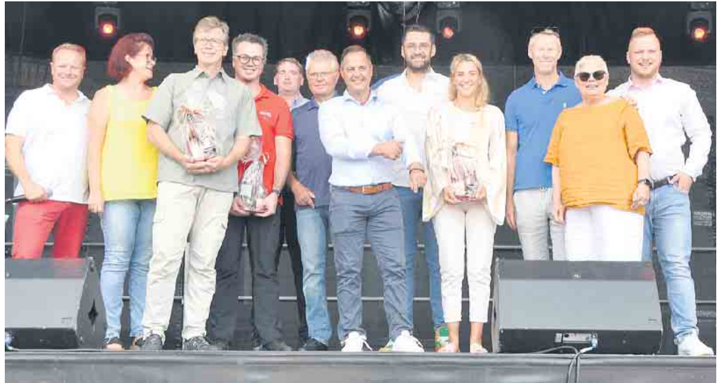
Repräsentanten des Gewerbevereins und aus Politik und Wirtschaft werden auch dieses Jahr wieder ein gelungenes „Bornheim Live!“ feiern können.

Komplettiert wird die Gewerbeschau durch die Automeile . Gezeigt werden viele Modelle, die die Herzen von Autofreaks höher schlagen lassen. Natürlich spielt Elektromobilität eine wichtige Rolle Auf der Showbühne auf dem Peter-Fryns-Platz sorgen am Samstag ab 17 Uhr und am Sonntag am späten Nachmittag angesagte Bands für Stimmung. Vorher stellen sich Bornheimer Vereine vor und präsentieren ihre Angebot.