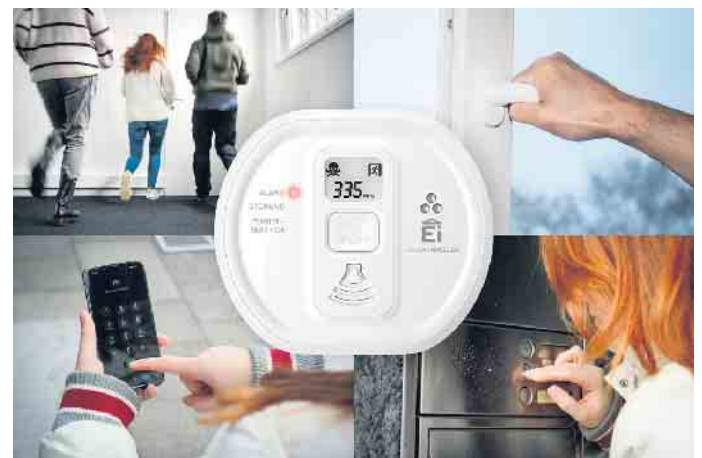
Bei einem CO-Alarm gilt es, schnellstmöglich das Gebäude zu verlassen und dabei die Fenster zu öffnen. Draußen angekommen sollte man den Notruf 112 wählen und weitere Personen im Gebäude über die Gegensprechanlage oder telefonisch informieren.