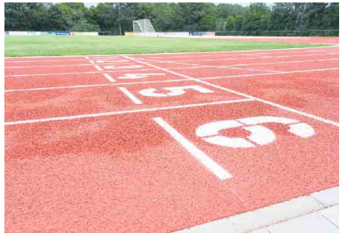
Die Tartanbahn mit den frischen Markierungen

als auch die Gesamtschule mit Sportprofil eine gute Nachricht; der Platz wird zum vorgesehenen neuen Termin des Distanzduells am 3. September zur Verfügung stehen. Sobald die Arbeiten abgeschlossen sind und der Platz wieder freigegeben wird, werden Sie durch die Gemeindeverwaltung entsprechend informiert. Über eine Förderung durch das Investitionspaket „Soziale Integration im Quartier 2020“ wurden 770.000 Euro von Bund und dem Land Nordrhein-Westfalen für die Sanierungsarbeiten bereitgestellt. Die zunächst neunzigprozentige Förderung wurde nach den Ereignissen der Flut auf hundert Prozent angehoben. Bei der Sanierung wird unter an-