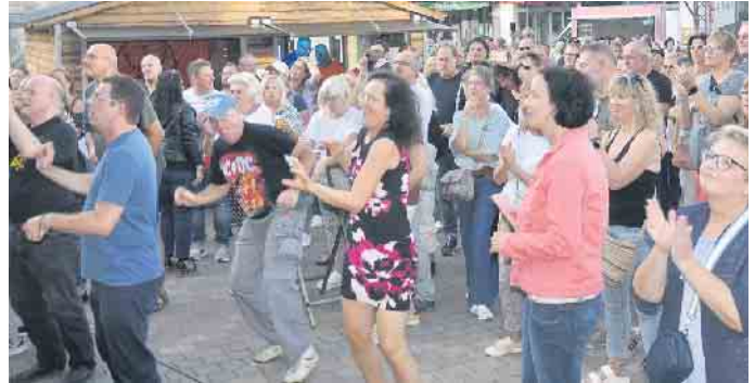
Mitreibende Musik-Acts finden ein begeistertes Publikum

Parallel lockt die Bornheimer Großkirmes auf dem Peter-Fryns-Platz die Besucher sogar von 11 bis 22 Uhr und das an allen vier Kirmestagen (30. August bis 2. September).