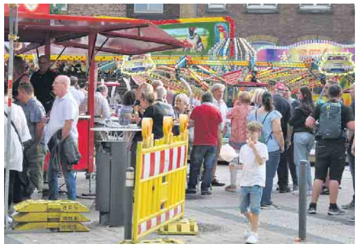
Kirmesspaß vom Feinsten warten auf Groß und Klein auf dem Peter-Fryns-Platz.