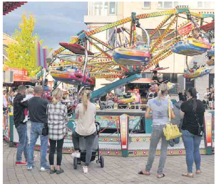
Mit vielen attraktiven Angeboten lockt die Großkirmes Jahr für Jahr Groß und Klein in die Bornheimer Innenstadt.

Der Begriff „Kirmes“ leitet sich ursprünglich von „Kirchmess“ beziehungsweise „Kirchweihfest“ ab. An diesem Tag gedachte man vor Jahrhunderten der Einweihung der jeweiligen Dorfkirche. Die heutigen Volksfeste im Spätsommer haben vielfach, neben dem Erntedankfest, hierin ihren Ursprung. Die Bezeichnungen „Großkirmes“ und „Kleinkirmes“ sagen nichts über die Größe der jeweiligen Veranstaltung oder die Zahl der teilnehmenden Schausteller und Buden aus, sondern sie richten sich nach deren zeitlicher Dauer. Eine Großkirmes wie die Bornheimer