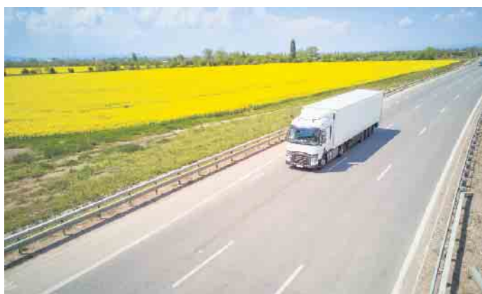
Kraftstoffe, die von unseren leuchtend gelben Rapsfeldern stammen, sparen bereits heute große Mengen CO 2 ein. Sie können eine wichtige Rolle bei der Verkehrswende spielen.

Biokraftstoffe besitzen Vorteile für Umwelt, Klima, Wirtschaft und Gesellschaft. (DJD)