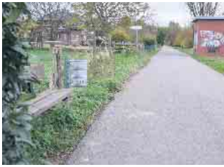
Morenhoven: Neuer Mülleimer

Swisttal. Ortsvorsteher sind ein wichtiges Bindeglied zwischen den Wünschen und Anregungen der Bürgerinnen und Bürger und der Gemeindeverwaltung. So werden die Anliegen über die Ortsvorsteher direkt an die Gemein-