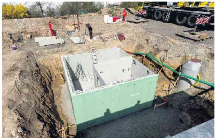
6,50 mal 6,50 Meter Baugrube reichen für einen kompakten Teilkeller meist schon aus.

Heizungsanlage, Sicherungskasten, Warmwasserspeicher, Automations- und Lüftungssystem - diese und weitere technische Anlagen im Haus nehmen heute