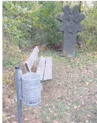
Odendorf: Die versetzte Bank vom Gedenkbaum ans „Stumpe Krüzchen“