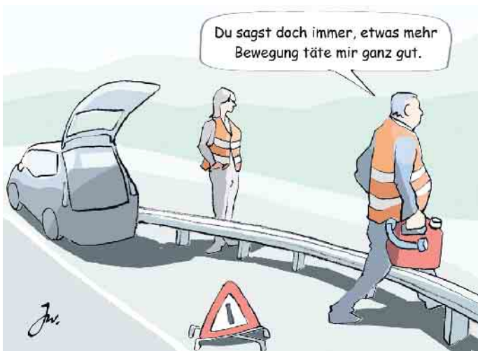
Liegenbleiben ohne Sprit.

Fahrer alter VW Käfer werden sich noch erinnern. Lang ist es her, dass man in Autos mit einem Hebel auf den Reservetank umschalten musste, wenn der Sprit zur Neige ging. In modernen Fahrzeugen hingegen macht einen die Elektronik bereits frühzeitig darauf aufmerksam, dass der Wagen bald auf Reserve fährt. Sogar über die Fahrtstrecke, die mit dem verbleibenden Treibstoffvorrat noch zurückgelegt werden kann, wird der Fahrzeuglenker informiert. Das bedeutet, dass heutzutage