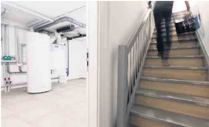
Ein kleiner Keller kann die oberen Stockwerke gut und effizient entlasten.

Gartenmöbel oder auch Winterreifen und eine Werkbank bleibt. Nicht nur bei der Herstellung und Montage sowie bei den Materialkosten für Dämmung, Abdichtung und Ausbau eines Minikellers kommen Bauherren günstiger weg als bei einer Vollunterkellerung, sondern auch schon beim Tiefbau: Weniger Erde muss aus-