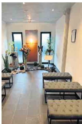
Räumlichkeiten nach der Sanierung