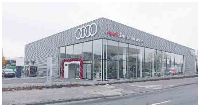
Straßenansicht des neuen AUDI Zentrums an der Bornheimer Str. 222 in Bonn

Das Traditionsunternehmen Fleischhauer-Franz hat am 17. November sein neues, dreigeschossiges AUDI Zentrum am Standort Bonn in der Bornheimer Str. 222 eröffnet.