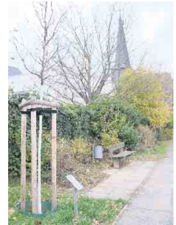
Odendorf: Bankerhöhung am Gedenkbaum