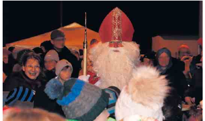
Weihnachtsbaum-Ansingen mit Nikolaus in Heimerzheim

Der weihnachtlich geschmückte Baum auf dem Gottfried-Velten-Platz.