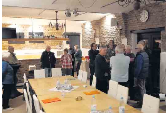
Schöpferische Pause bei der Strategiediskussion im ehemaligen Pferdestall