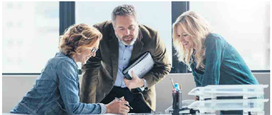
Einer Studie zufolge empfinden Mitarbeiterinnen und Mitarbeiter das Angebot einer betrieblichen Krankenversicherung als Wertschätzung durch den Arbeitgeber.

Im aktuellen Fachkräftereport der Deutschen Industrie- und Handelskammer (DIHK) gab über die Hälfte von 22.000 befragten Firmen an, nicht mehr alle offenen Stellen besetzen zu können. Und in einer Umfrage des Ifo-Instituts befürchtet mehr als ein Drittel der Betriebe sogar, wegen fehlender Arbeitskräfte weniger wettbewerbsfähig zu sein. Wie also lassen sich gut ausgebildete und motivierte Leute gewinnen und langfristig halten? Eine weitere Studie weist auf eine immer beliebtere Möglichkeit hin: indem der Arbeitgeber seinen Beschäftigten eine betriebliche Krankenversicherung (bKV) finanziert. Darüber erhalten die Mitarbeitenden zusätzliche Gesundheitsleistungen, für die ihre gesetzliche Krankenversicherung (GKV) nicht oder nur teilweise aufkommt - etwa hochwertigen Zahnersatz, Behandlungen beim Heilpraktiker oder Zuschüsse für Brillen und Kontaktlinsen.