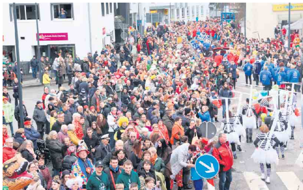
Tausende bevölkerten den Zugweg