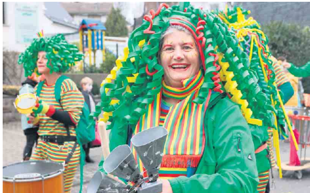
Bunter Kopfschmuck bei der Gruppe Sambawind