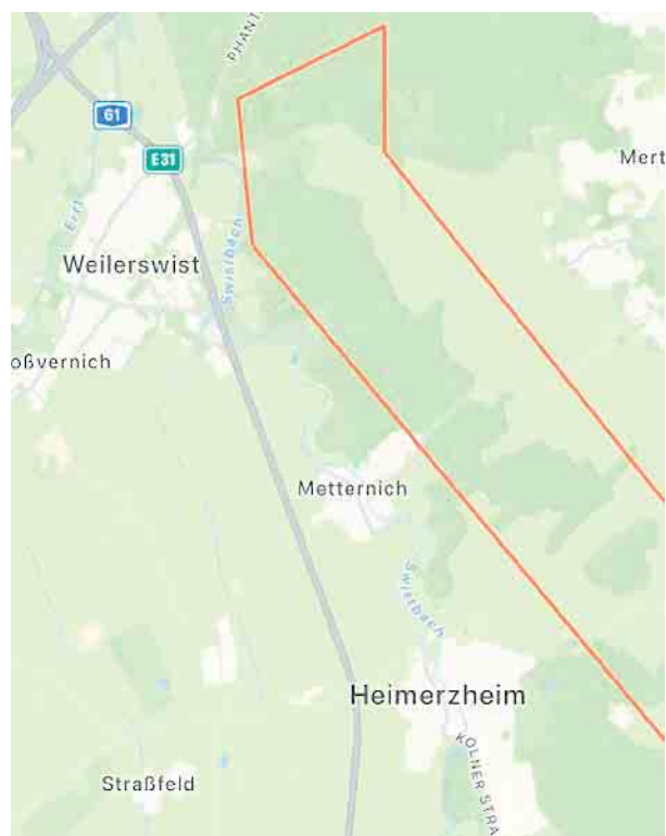
Die rot markierte Fläche zeigt den ungefähren Bereich des Bundeswehr-Übungsgeländes zwischen Heimerzheim und Weilerswist.

Aula der Gesamtschule, Martin-Luther-Straße 26