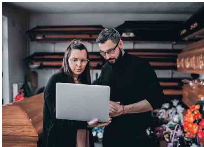
Alles digital bei der Bestattungsplanung? Wie helfen digitale Services bei einer Bestattung - und wann ist der Mensch das bessere Gegenüber?

Greifen Sie auf persönliche und menschliche Unterstützung zu-