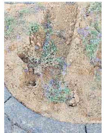
Autofahren will gelernt sein! Innerhalb von wenigen Tagen wurde das neu angelegte Beet zwei Mal beschädigt.

Vielleicht würde es ja helfen, die Vandalen couragiert anzusprechen - wenn man sie beobachtet. Den Schaden zu melden, so wie die Passantin, hilft auch. Wenn Verursacher und Zeugen bekannt sind, kann gehandelt werden. Dies war in der Vergangenheit schon mehrfach erfolgreich und der Schaden wurde von den Verursachern bezahlt.