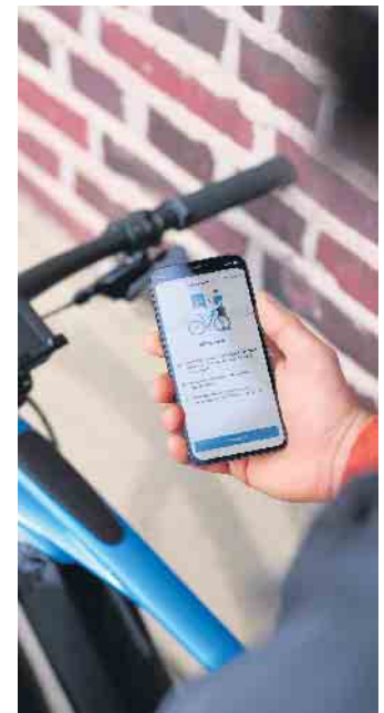
Abschreckende Wirkung: Zusätzlicher digitaler Diebstahlschutz macht das E-Bike unattraktiver für Diebe.