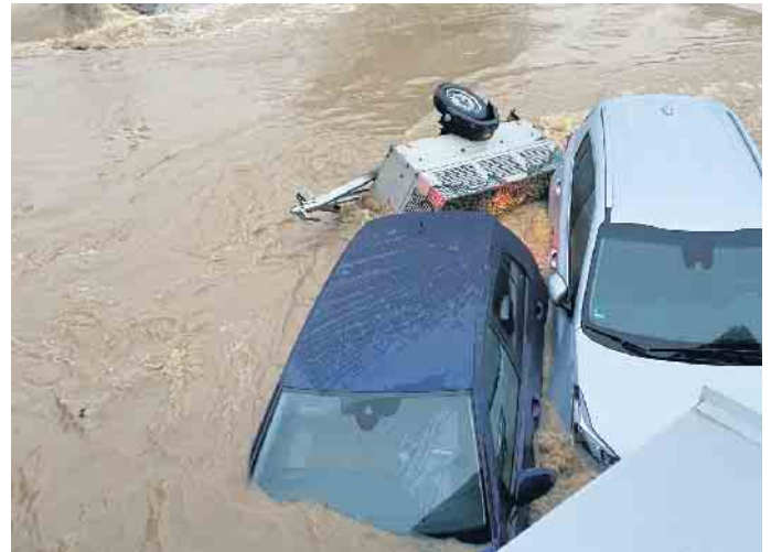
Autos werden von der reißenden Flut weggeschwemmt.

An diesem Wochenende jährt sich die Hochwasser- und Flutkatastrophe vom 14. auf den 15. Juli zum zweiten Mal. Die schrecklichen Bilder haben sich in den Erinnerungen vieler Menschen, vor allem den von der Flut betroffenen Bürgerinnen und Bürgern unserer Gemeinde, tief ins Gedächtnis eingegraben. Wir alle trauern um