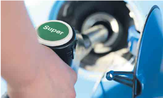
Nicht immer super: Benzin kann im Dieselfahrzeug erhebliche Schäden anrichten.

Es kommt öfter vor als viele denken: Beim Tanken greifen Autofahrer zur falschen Zapfpistole. Das kann für die Technik fatale Folgen haben.