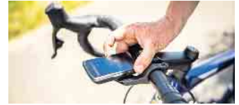
Mit zeitgemäßem Zubehör lassen sich auch ältere Räder gestiegenen Anforderungen anpassen.

Noch bequemer wird es mit Elektroantrieb: „E-Bikes werden von Jahr zu Jahr beliebter. Sie bieten eine tolle Möglichkeit, auch längere Strecken ohne große Anstrengung zurückzulegen.“ Außerdem sind E-Bikes mit vielen Zusatzfunktionen ausgestattet, die sich zum Teil auch für klassische Räder nachrüsten lassen: GPS-Tracker, Streckenmesser oder elektronischer Diebstahlschutz - Angebote gibt es etwa unter www.bike24.de . „Fahrräder und Zubehör werden immer smarter. Viele Funktionen lassen sich mit Apps auf der Uhr oder dem Handy verknüpfen“, so Martin-Birner. Seine Empfehlung für kaufwillige Fahrradfans: „Mit Blick auf