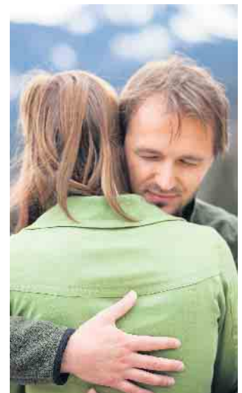
Die Nähe zu anderen Menschen und das Gefühl, gehört zu werden, helfen bei der Trauerbewältigung.

kommen ihre Berechtigung und werden in adäquater Form ausgedrückt. Mit dem Sterben von Angehörigen wird man vielleicht auch damit konfrontiert, was in der Beziehung an Anerkennung, Nähe und Wertschätzung vermisst wurde. Dabei bricht besonders bei Menschen, die in dysfunktionalen Familien aufwuchsen oder in Familien, in denen psychische oder physische Gewalt herrschte, viel Schmerz über die nicht gelebte Kindheit mit auf. In der therapeutischen Gruppe finden sie Halt, Trost und Frieden. Es wird gemeinsam geweint und gelacht. Mit heilsamen Ritualen können Abschiede nachgeholt und bewusst gestaltet werden. Am Ende des seelischen Genesungsprozesses steht die Erkenntnis, dass in jedem Herbst der nächste Frühling schon naht. (djd)