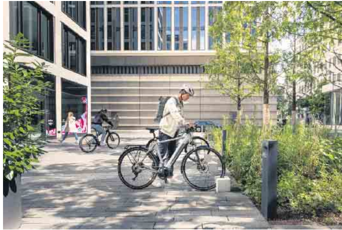
Sorgenfreier unterwegs: Mit einem digitalen Diebstahlschutz wird das Abstellen von E-Bikes noch sicherer.

E-Bikes sollten grundsätzlich immer mit einem robusten Fahrradschloss abgeschlossen werden. Damit Diebe kein leichtes Spiel haben, empfiehlt es sich, das E-Bike an einem fest verankerten Fahrradständer oder einem Laternenpfahl anzuschließen. Außerdem spielt auch der Abstellort des E-Bikes eine Rolle: Tagsüber eignen sich Plätze, die belebt und von allen Seiten einsehbar sind. Nachts sollten E-Bikes in der Garage oder im Keller abgestellt werden. Ist das nicht möglich, gilt es, einen Ort zu