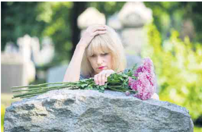
Der Tod eines lieben Menschen ist eine Ausnahmesituation für die Seele. Der Trauerprozess braucht Zeit und Raum.

Wie die Seele unseren Körper beeinflusst