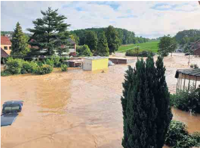
Ein Bild des Schreckens, was vielen Menschen in Metternich vor Augen ist: Die Meckenheimer Straße ist in Richtung Grundschule von der Swist überschwemmt.

Angebote zu Ihrer Unterstützung - Was ist bisher geschehen? Wir informieren Sie!