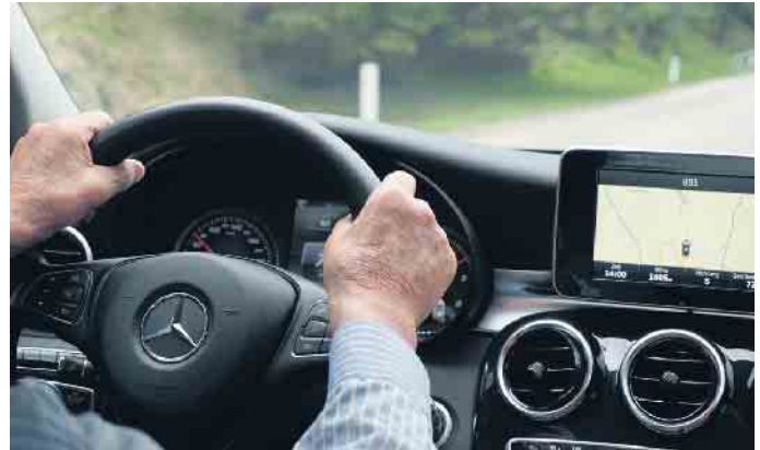
Senioren verursachen im Durchschnitt mehr Schäden als Autofahrer mittleren Alters.

Unterdessen ist in der Europäischen Union eine Führerscheinerform geplant. Die EU-Kommission schlägt vor, dass Führerscheine, die ab dem 19. Januar 2013 ausgestellt wurden, nur noch 15 Jahre lang gültig sind und ab dem 70. Lebensjahr eine Erneuerung alle fünf Jahre an eine Feststellung der Fahrtüchtigkeit gekoppelt werden soll. Die Art der Maßnahme soll aber im Ermessen des Mitgliedsstaates liegen. (mid/ak-o)