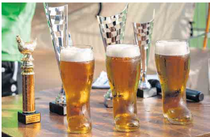
Die diesjährigen Pokale

- ganz in TuS Manier. Das nächste 9-Meter-Turnier findet am 20. Juni 2026 statt.