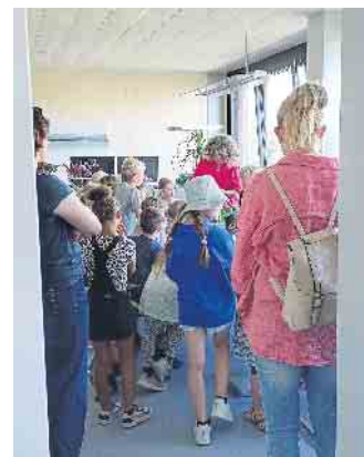
Die Grundschul Kinder der Josef-Schaeben-Schule hatten viele Fragen an die Bürgermeisterin.

mit neuem Wissen übers Rathaus und die Verwaltung.