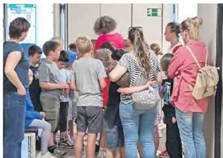
Die Geschichten um die Schatzkiste auf dem Flur des Rathauses zog die Zweitklässler in Bann.

Sie lauschten aufmerksam den Geschichten, vor allem über die große Schatzkiste im Flur. Als die Bürgermeisterin die Schatzkiste öffnete, und aus ihr für jedes Schulkind „Golddukat“ entnahm, war die Freude groß. Nach einem Besuch im Büro des Grünflächenamts und Christoph Zimmermanns Erklärungen zu den dort liegenden Baumscheiben verabschiedeten sich die Grundschul Kinder, vollgepackt