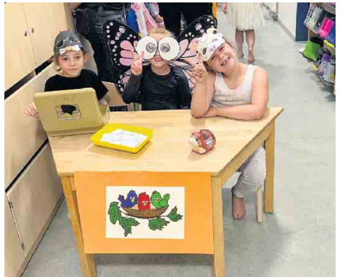
Begeisterung: Die Kinder hatten viel Spaß bei dem lustigen Stück