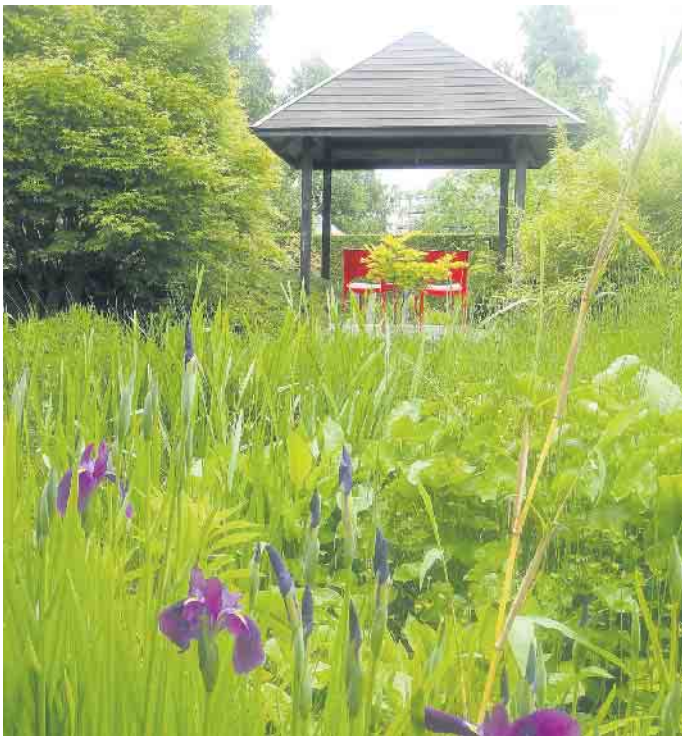
Mit Pflanzen, für die nasse Füße kein Problem sind, lassen sich auch Gartenbereiche mit Staunässe attraktiv gestalten.

ten findet.“ Weitere Informationen rund um professionelle Gartengestaltungen gibt es auf www.mein-traumgarten.de . BGL