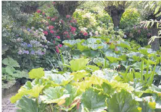
Pestwurz zählt zu den Stauden mit den größten Blättern Europas. Sie fühlt sich an sonnigen und halbschattigen Feuchtgebieten richtig wohl.

Mit der Anlage eines Sumpfbeckes wird der Garten um einen besonderen Lebensraum reicher, der nicht nur Platz für Pflanzen mit speziellen Vorlieben bietet, sondern auch für die heimische Tierwelt eine Bereicherung ist. Schmetterlinge, Bienen und Libellen werden angelockt sowie Vö-