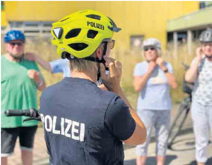
Kostenfreie Pedelec-Trainings für Seniorinnen und Senioren ab 65 Jahren - Polizei Euskirchen erweitert Angebot erstmals kreisweit.

Polizei Euskirchen erweitert Angebot erstmals kreisweit