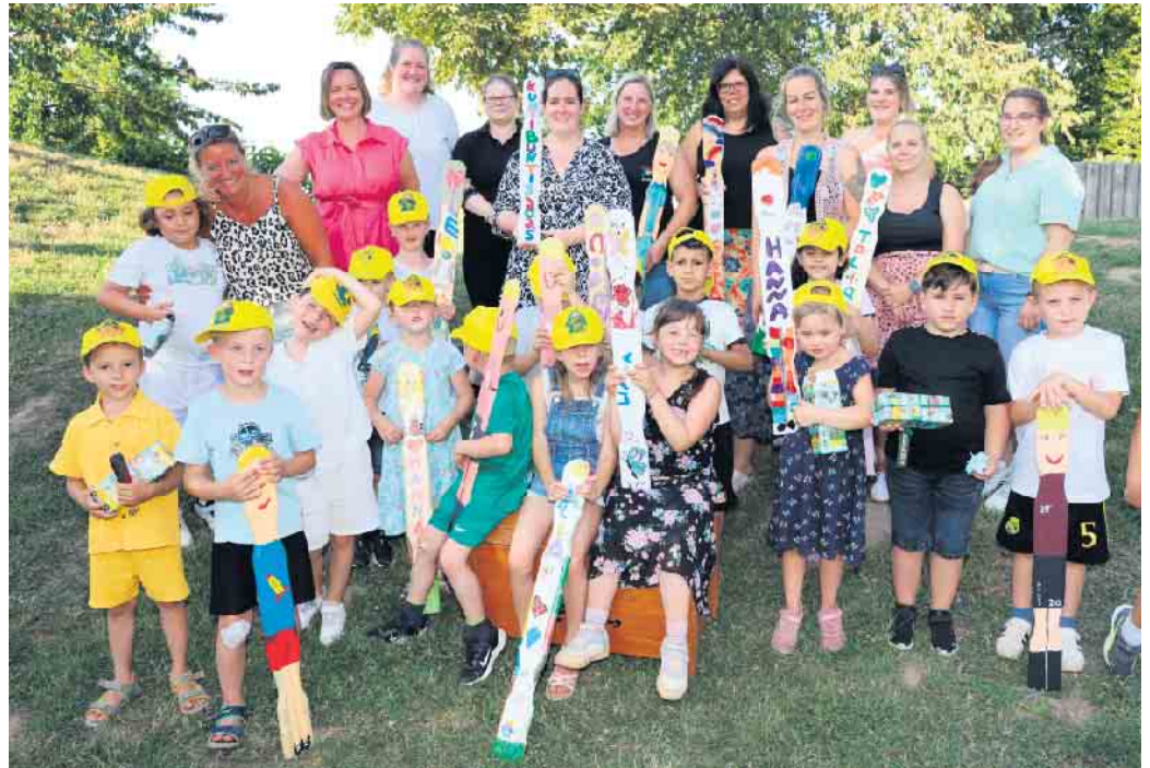
In der DRK Kindertagesstätte Groß-Vernich 2 wurde mit dem großen Tag der Vorschulkinder gebührend Abschied gefeiert. Die Schulanfänger durften einige wunderbare Stunden voller Überraschungen erleben.

Unter dem Motto „Segel setzen, Leinen los - Wir gehen auf Piratenreise“ verbrachten sie das letzte Jahr in der Einrichtung. Damit auch jeder weiß, dass die Kunti - Buntis da sind, hat jedes von ihnen eine eigene Käppi dem Spatzenest-Logo gestaltet.