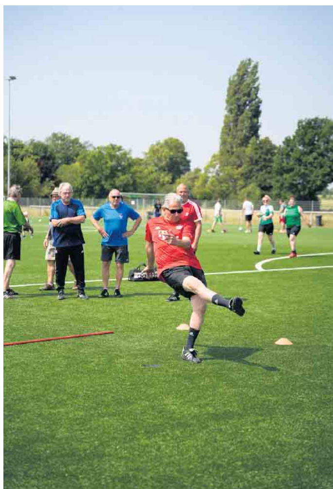
Auch die Körperhaltung stimmte fast immer.

Fertigarage + Garagentor Carport + Gerätehaus