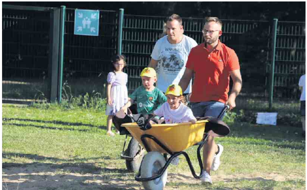
Sportliches Ritual: Schubkarren wurde jedes Kind von seinen Eltern durch einen Parcours über das Einrichtungsgelände gefahren. Im Start/Ziel angekommen ist es symbolisch so die letzte Fahrt der Kunti-Buntis gewesen, bevor die Schule ansteht.

Die Aufgabe der Kunti-Buntis bestand darin, während der Fahrt mit einer Stange in der Hand aufgehängte Luftballons zerplatzen zu lassen. Diese wa-