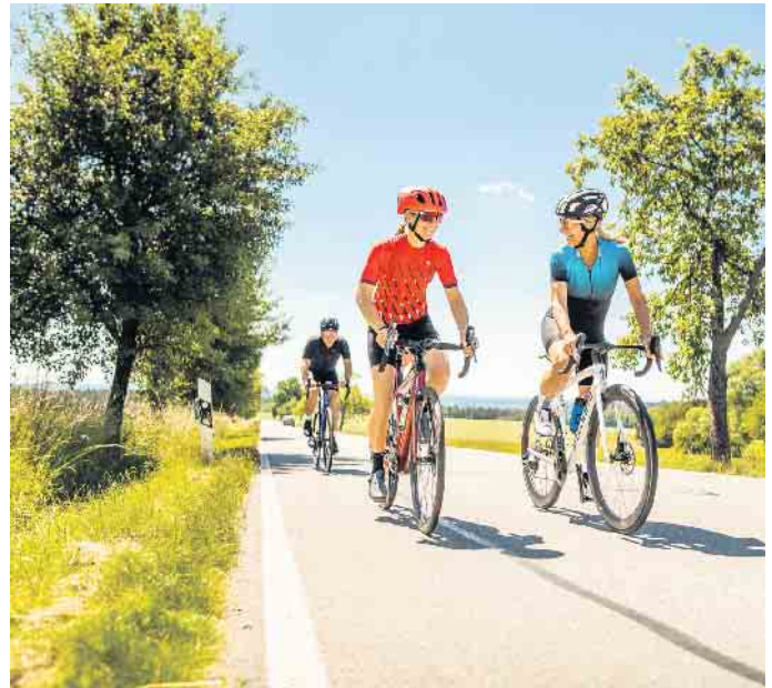
Alles Typsache: Für sportliches Fahren mit hoher Geschwindigkeit ist ein Rennrad das Richtige.

nachrüsten lassen: GPS-Tracker, Streckenmesser oder elektronischer Diebstahlschutz - Angebote gibt es etwa unter www.bike24.de . „Fahrräder und Zubehör werden immer smarter. Viele Funktionen lassen sich mit Apps auf der Uhr oder dem Handy verknüpfen“, so Martin-Birner. Seine Empfehlung für kaufwillige Fahrradfans: „Mit Blick auf die Nachhaltigkeit sollte man sich überlegen, ob das alte Rad nicht schon das richtige Fahrrad ist und mit passendem Zubehör wieder fit gemacht werden kann. Soll es doch ein neues sein, kann man an unseren Service-Points in Dresden und Berlin ein professionelles Bike Sizing mit Körpervermessung nutzen.“ Denn für das perfekte Radgefühl muss nicht nur der Typ, sondern auch die Größe stimmen. (DJD)