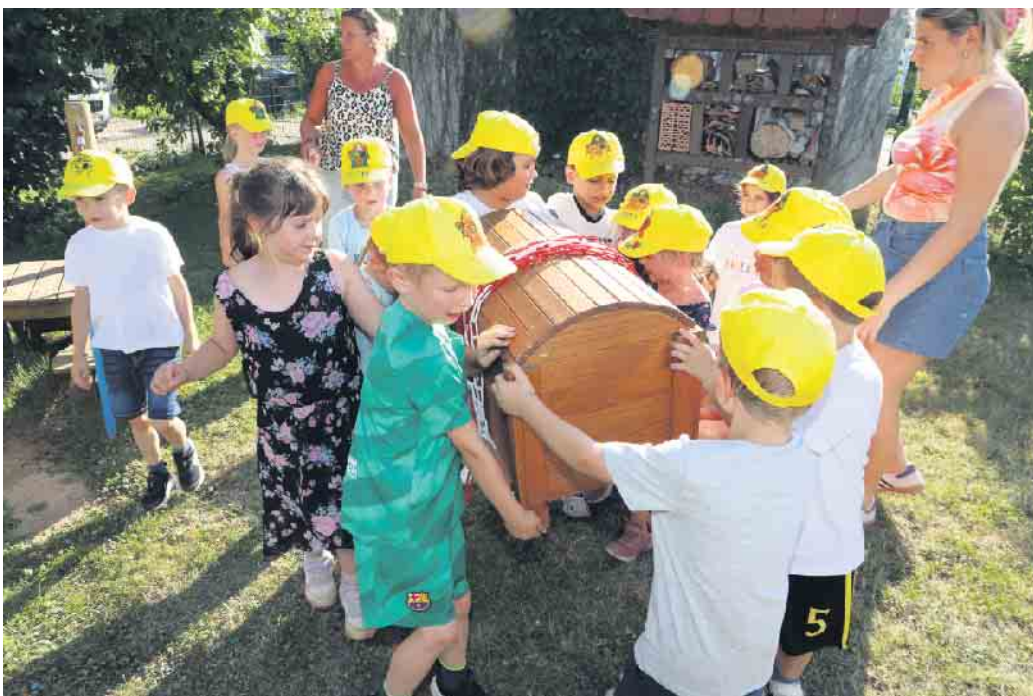
Passend zum Jahresthema war auf dem Kita Gelände eine große Schatzkiste versteckt. Diese musste von den Kunti-Buntis gemeinschaftlich gesucht werden. Am Ende warteten hier drinnen die Abschiedsgeschenke auf die Kinder.

„Einmal Spatz - immer Spatz“. Symbolisch erhielt jedes Kunt-Bunti-Kind eine Trinkflasche mit diesem prägenden Satz und dem Namen bedruckt als Abschiedsgeschenk überreicht, das veranschaulichte, dass es nun Zeit ist, auszufliegen. Alle