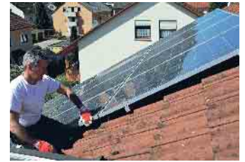
Der qualifizierte Dachdecker prüft die Befestigungen der Solarmodule und begutachtet die Unterkonstruktion im Rahmen des DachChecks.

Dächer rechtzeitig checken lassen Der Zentralverband des Deutschen Dachdeckerhandwerks (ZVDH) rät daher allen Hausbesitzern und Hausverwaltungen, nach dem Winter das Dach und seine Bauteile überprüfen zu lassen. Nur so können mögliche Schäden rechtzeitig behoben werden. Im Rahmen eines DachChecks wird das gesamte