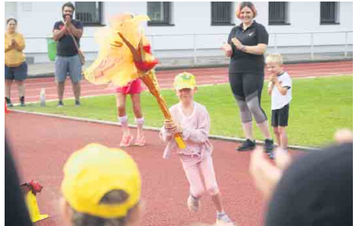
Wie bei dem namensgleichen Pendant, kam zu Beginn der Spiele ein Kind mit einer Fackel aus Tülltüchern die das echte Feuer symbolisieren, eingelaufen.

Wie bei dem namensgleichen Pendant, kam zu Beginn der Spiele ein Kind mit einer Fackel aus Tülltüchern die das echte Feuer symbolisieren, eingelaufen. Mit