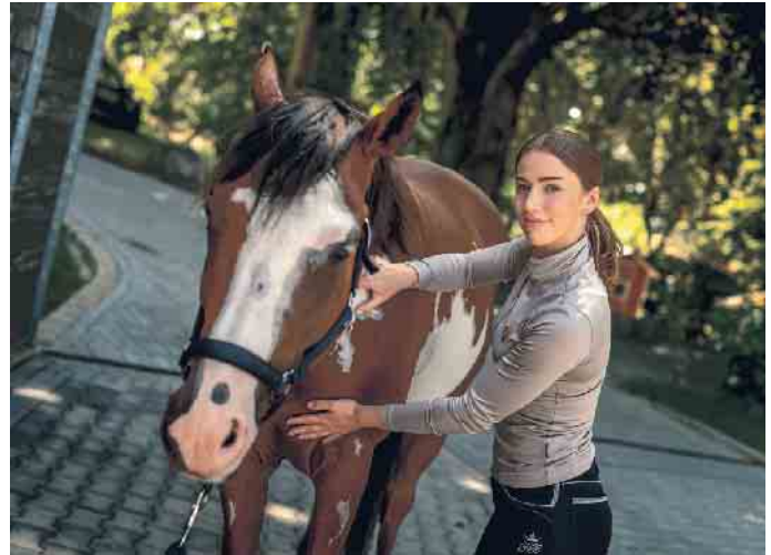
Mit der richtigen Weiterbildung zum Traumberuf.

reines „Pferdewissen“ vermittelt wird, sondern zum Beispiel auch betriebswirtschaftliche und rechtliche Themen intensiv behandelt werden. Für mich ist das Konzept des Fernstudiums ideal, denn das Lernen lässt sich flexibel in meinen Alltag integrieren. Und die Seminare sorgen für den ausreichenden Praxisbezug und geben die Möglichkeit zur Netzwerkbildung. Mit einigen Teilnehmer:innen stehe ich heute noch in Kontakt. Und meine breitgefächerte Ausbildung ermöglicht es mir, ganz unterschiedliche Aufgaben zu übernehmen und mich auch schnell in neue Themen einzuarbeiten, sagt Fenkner. (akz-o)