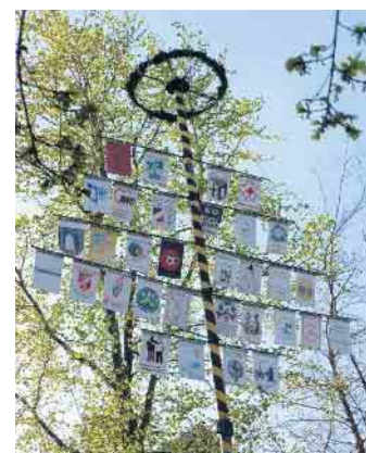
Der Vereinsbaum an der Kirche

Der Dorfverschönerungsverein freut sich, viele Mitglieder begrüßen zu können.