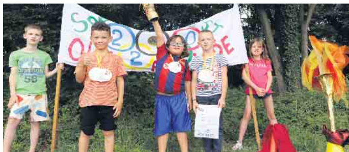
Olympische Sommerspiele im Spatzennest: Ein sportliches Projekt mit jeder Menge Spaß und Lerneffekt.

Ein sportliches Projekt mit jeder Menge Spaß und Lerneffekt