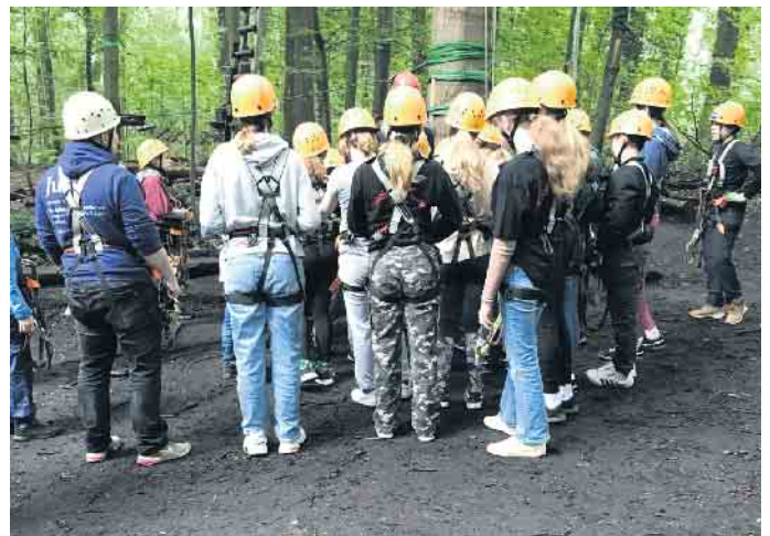
Judokas bei der Einweisung.

Infos zu unseren Trainingszeiten findet man unter www.judoclub-weilerswist.de .