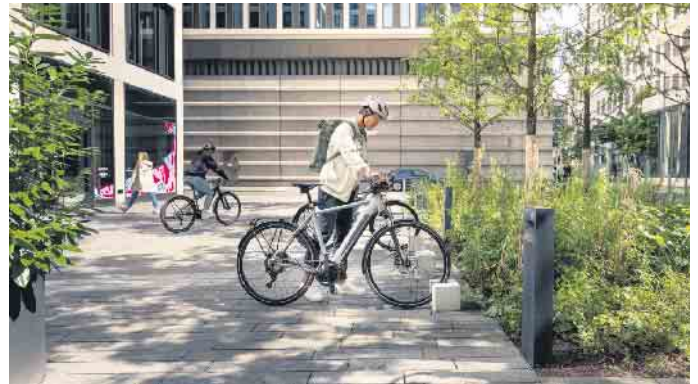
Sorgenfreier unterwegs: Mit einem digitalen Diebstahlschutz wird das Abstellen von E-Bikes noch sicherer.

Daneben sind zusätzliche digitale Schutzfunktionen wie „eBike Alarm“ von Bosch sinnvoll. Diese lässt sich über die „eBike Flow App“ aktivieren und sorgt für noch mehr Sicherheit und besseren Schutz. Wird das E-Bike ab-gestellt und ausgeschaltet, akti-viert sich das Alarm-Feature automatisch. Das Smartphone dient dabei als digitaler Schlüssel. Macht sich jemand ohne diesen am E-Bike zu schaffen, reagiert das System mit