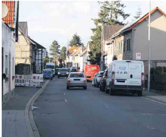
Die K3 wird in der Ortslage Müggenhausen vom Kreis Euskirchen saniert. Gleichzeitig wird der Erftverband hier das Kanalnetz sanieren.

Die Arbeiten in der Ortslage können nur unter Vollsperrung durchgeführt werden. Für Anlieger besteht die Möglichkeit, bis an den