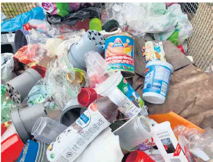
Hausmüll gehört nicht in die Abfallkörbe des Friedhofs

Die Gemeinde Weilerswist weist darauf hin, dass Hausmüll nicht in den Abfallbehältern der Friedhöfe entsorgt werden darf. Restmüll gehört ausschließlich in die graue Tonne, Verpackungsmüll in die gelbe Tonne. Sollte ihre graue Tonne einmal nicht ausreichen, erhalten Sie im Rathaus Müllsäcke, die von der Entsorgungsfirma zu den üblichen Abfuhrterminen mit entsorgt werden.