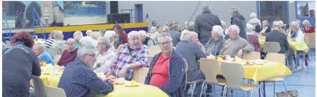
Bei Kaffee und Kuchen und belegten Brötchen genossen die Vernicher Seniorinnen und Senioren einen äußerst unterhaltsamen Nachmittag in der Tomberghalle.

Besonders erfreulich war es, dass ausschließlich einheimische Kräfte auf der Bühne auftraten. Warum in die Ferne schweifen, wenn es so tolle Tanzgarden wie „Schiff ahoi“ und die Tanzgarde des TuS Vernich vor Ort gibt? Vor ihren ersten „offiziellen Karnevalsauftreten“, die noch am selben Tag anstanden, präsentierten sie den Seniorinnen und Senioren schon einen kleinen Ausschnitt aus ihrem neuen Programm. Die „Dancing Dads“ der TuS-Tanzgarde sorgten mit Hilfe eines großen Banners auf der Bühne dafür, dass sich einige Tänzerinnen in Windeseile umziehen konnten und in neuem Outfit ihren Tanz darboten. Eine gelungene Überraschung! Musiker und Sänger Peter Heeg