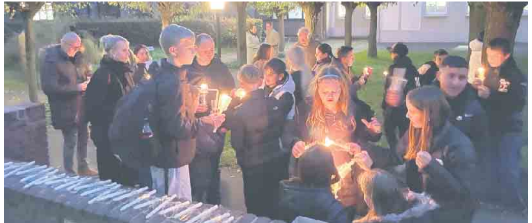
Die Schülerinnen und Schüler der Gesamtschule Weilerswist verteilten Kerzen an die Teilnehmer der Gedenkveranstaltung im Hochzeitsgarten.