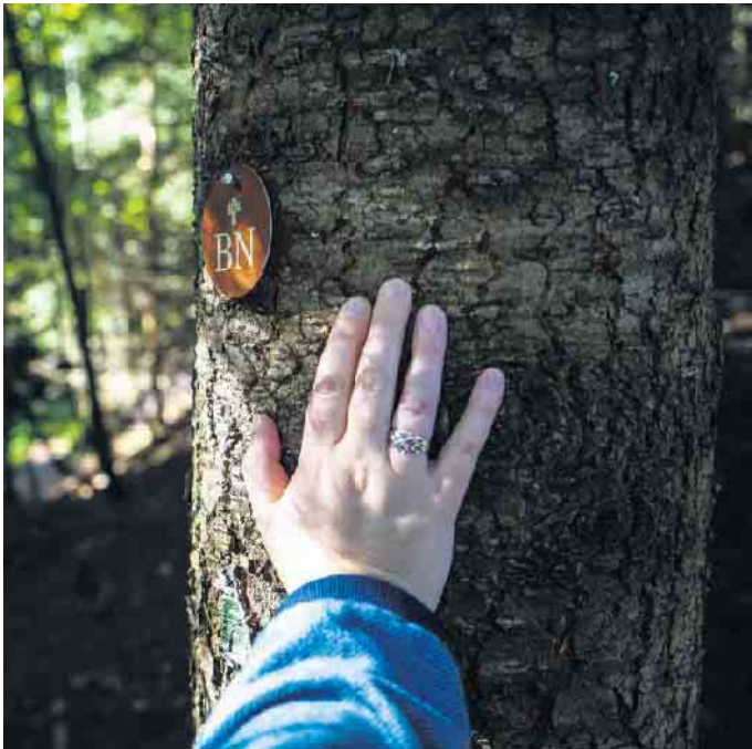
Der letzte Fußabdruck kann auch naturnah und damit umweltfreundlich sein.

Die Bestattung eines Verstorbenen ist nur bedingt umweltverträglich. Sowohl bei der Kremation, als auch bei der klassischen Erdbestattung bleiben regelmäßig Stoffe übrig, die das Ökosystem belasten können. „Grüner“ wird das Ableben, wenn auf die Materialien von Sarg und Urne geachtet wird. Dazu gehört auch die Wäsche, mit der der Sarg ausgekleidet und der Verstorbene bekleidet wird.