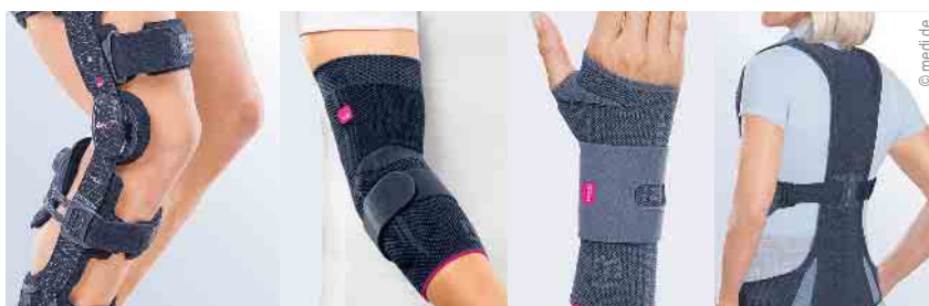
Direktversorgung von Bandagen und Orthesen