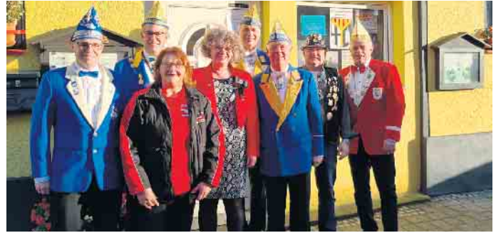
Startschuss in die neue Session

im Vereinsheim auf der Kölner Straße 66. Umrahmt von stimmungsvoller Musik durch den DJ „Pitter Live“ fand sich die illustre Gesellschaft in den Karneval ein. Wie immer war für Leib und Seel' gesorgt - wieder mal hervorragend organisiert durch die Weilerswister Schützen, AWO-Mitglieder und natürlich den Mitgliedern des DVV.