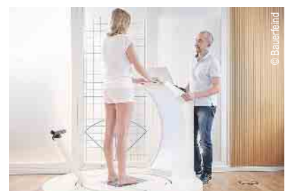
3D-Vermessung für Kompressionsstrümpfe und orthop. Einlagen