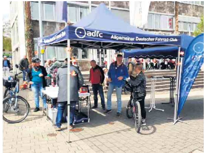
Regel Betrieb am ADFC-Stand

mitglieder gewinnen. Außerdem durften wir auch in einem Interview auf der Bühne über unsere Arbeit und die Situation des Radverkehrs an der Oberen Sieg berichten. Insgesamt also ein sehr erfolgreicher Tag für die Ortsgruppe. Die nächsten ADFC-Tourentermine: Mittwoch, 3. Mai - Feierabendtour, 17.30 Uhr, Dattenfeld Bootshafen (2 bis 3 Stunden) Sonntag, 14. Mai - MTB-Sonntagsrunde, 11 Uhr, Herchen Kurpark-Cafe (30 bis 40 Kilometer) Donnerstag, 18. Mai - E-Bike-Vatertagstour, 14 Uhr, Herchen Kurpark-Cafe (75 Kilometer, bergig) Nichtmitglieder sind willkommen, Helmpflicht. (dieter.zerbin@adfc-bonn.de)