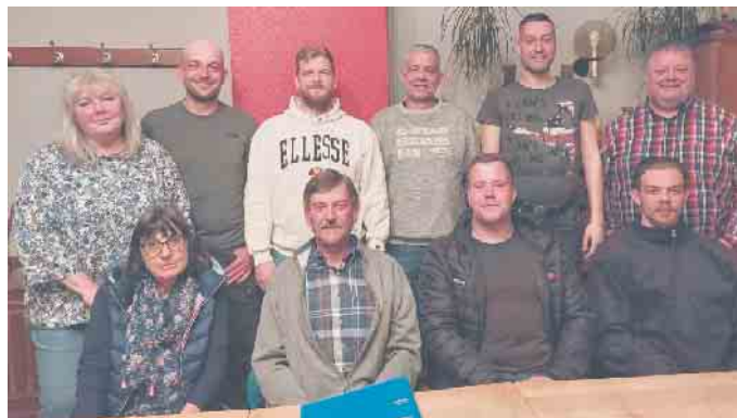
Neuer Vorstand SV Höhe.

einem Hühscher Ballverlust im Spielaufbau per Konter das 3:0 erzielen (41.), dem zwei Minuten später durch einen Sonntagschuss in den Torwinkel der Halbzeitstand zum 4:0 folgte. Doch unser Team gab nicht auf und setzte nach dem Seitenwechsel die Gastgeber unter Druck, und nachdem J. Geue noch freistehend am Torwart scheiterte (52.), gelang Routinier J. Fichtner per Kopfball das 4:1 (55.). 10 Minuten später machte es J. Geue besser und verkürzte auf 4:2. Und auch in der 69. Min. war er zur Stelle und staubte zum Anschlusstreffer ab. Doch schon drei Minuten später konnte Eudenbach nach einer schlecht getretenen Ecke des SVH