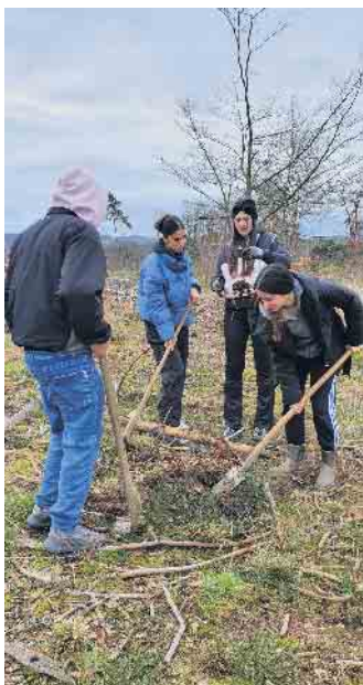
Die Gesamtschüler*innen in Aktion im Heinrichs-Wald.

Im Herbst des letzten Jahres begann unser Kollege Heinrich Derksen ein großes Pflanzprojekt in Herchen.