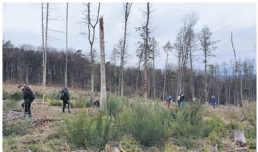
Dank Teamarbeit geht es voran. Jedes junge Bäumchen wird behutsam eingepflanzt.

Der von Schüler*innen getaufte „Heinrichs-Wald“ wird ganz im Sinne der Nachhaltigkeit bearbeitet: Es wird kein Plastik zur Stabilisierung der kleinen Bäume verwendet und als Fraßschutz wird Schafswolle genom-