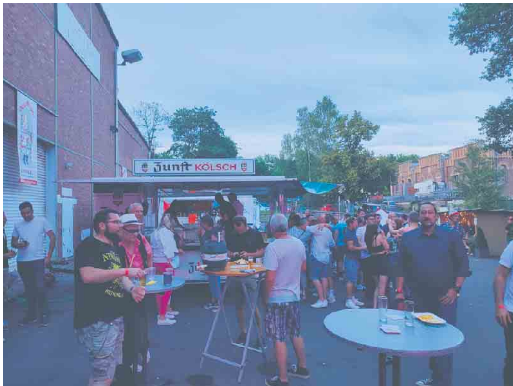
Sommerparty der KG 2022

Zum anderen steht unsere zweite Sommerparty vor der Türe. Nach dem großen Erfolg im letzten Jahr, veranstaltet die KG Schladern auch in diesem Jahr wieder eine Sommerparty. Start ist am 17. Juni, ab 18 Uhr auf dem Ascem-Gelände in Schladern. Auch hier ist für eure Verpflegung bestens gesorgt. Live-Musik wird es durch die Band „StockBrot“ ebenfalls geben. Kommt vorbei und feiert mit uns auch außerhalb der Session.