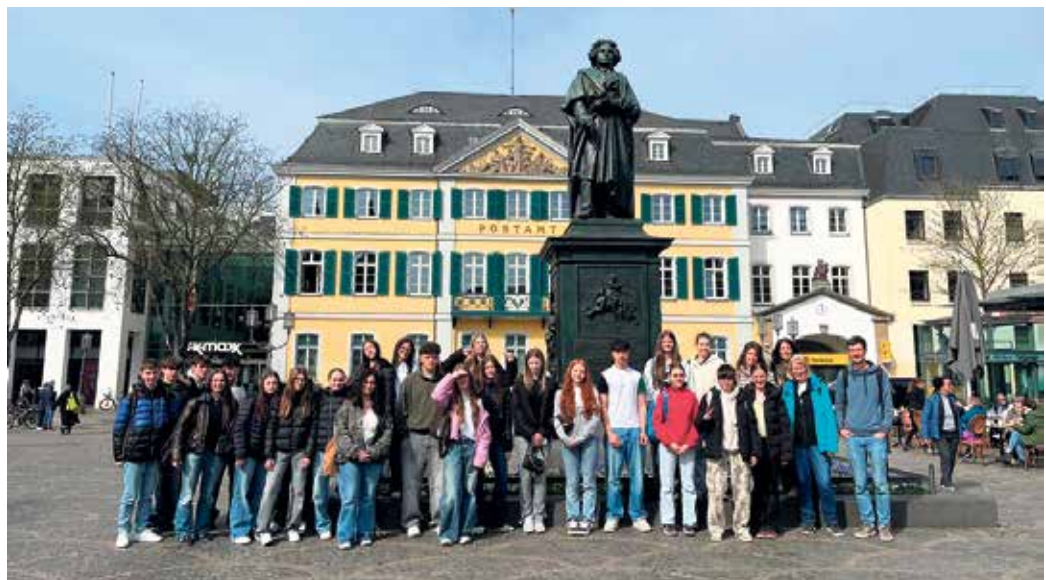
Bonn - ein Nebeneinander historischer Stätten und modernen Stadtlebens

Gemeinsam wurde eine Baumpflanzaktion durchgeführt, bei der die Austauschgruppe aktiv zum Umweltschutz beitrug. Ein besonderes Highlight war zudem ein Escape-Spiel auf dem Rhein, das spielerisch Wissen zu Klima- und Umweltthemen vermittelte. Ergänzt wurde das Programm durch spannende Museumsbesuche, bei denen die Gäste mehr über deutsche Geschichte erfuhren.