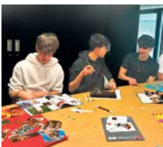
Lebendiger Austausch auch über ökologische Themen