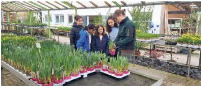
Die Gärtnerei Ückerseifer unterstützt die Klasse 5a bei der Auswahl von Blumen und Bäumen

die Kinder auch organisatorische Aufgaben: Sie stellten ihre Idee der Schulleitung vor, holten sich die Genehmigung und planten gemeinsam