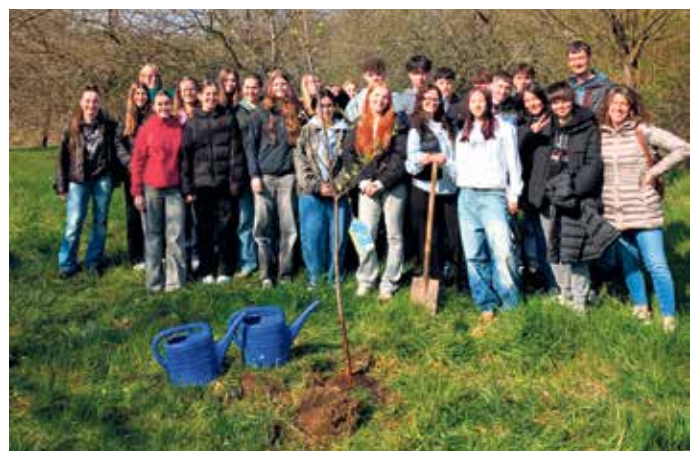
Baumpflanz-Aktion im Schulgarten

Wir freuen uns schon auf den anstehenden Besuch in Italien und sagen ciao, arrivederci!