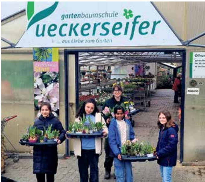
Frühblüheraktion der Gesamtschule Windeck

Fünftklässler der Gesamtschule Windeck sammeln Geld und pflanzen Frühblüher und einen Baum