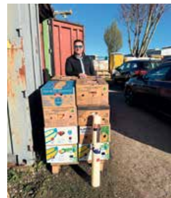
Abgabe von Kerzenwachs an Sammelstelle - Fahrt 3 von 5

So kamen in diesem Jahr die unglaubliche Menge von 1,4 Tonnen zusammen, die trotz vorherigen Packens in Bananenkisten in insgesamt fünf Touren zu der Organisation Dobre e.V. Ukraine-Hilfe im Rheinland gebracht wurden, die diese umgehend auf die LKW Richtung Kiew & Co. verladen konnten. Damit man sich diese Menge etwas besser vorstellen kann, sprechen wir von insgesamt 65 vollen Bananenkisten mit Kerzenwachs. Warum Bananenkisten? Weil diese