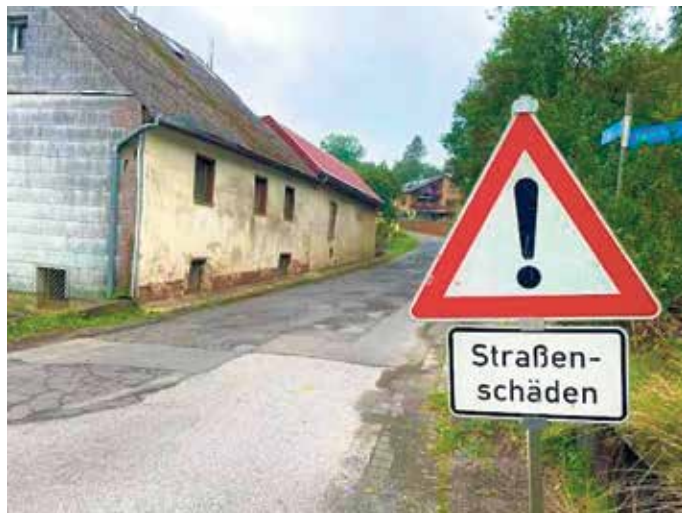
Straßenausbau in Rosbach - Sorgfältig prüfen, fair entscheiden.

Diese Unterscheidung ist von großer Bedeutung. Denn nur wenn die Straßen als bereits erschlossen gelten, greift die aktuelle Regelung in Nordrhein-Westfalen, nach der Straßenausbaukosten nicht mehr auf Anliegerinnen und Anlieger umgelegt werden. Sollte hingegen eine Ersterschließung vorliegen, müssten die betroffenen Bürgerinnen und Bürger einen Großteil der Kosten tragen. Zugleich ist die Gemeinde rechtlich gebunden. Eine vom geltenden Recht abweichende Entscheidung des Rates könnte zu Schadensersatzansprüchen gegen die Gemeinde führen. Auch deshalb ist eine belastbare rechtliche Klärung vor einer Entscheidung zwingend notwendig. Gerade wegen dieser Tragweite soll nun eine zusätzliche fachliche Einschätzung eingeholt werden. In Abstimmung mit allen Fraktionen wird eine Anfrage bei der NRW.BANK