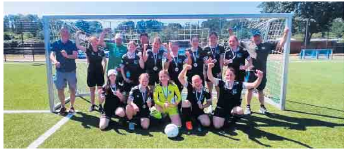
Mannschaftsfoto nach der Siegerehrung

Bei Turnier haben die Mädels des TuS Herchen, nach einem etwas schwierigen Start im ersten Spiel, was knapp mit 2:1 gewonnen wurde, die restlichen fünf Spiele klar für den TuS Herchen entscheiden können. Im vorletzten Spiel konn-