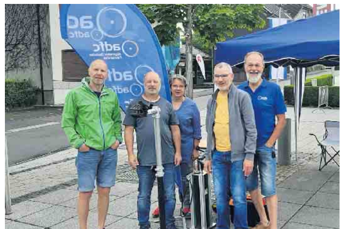
Die freiwilligen „Radretter“ am Dattenfelder Stand

sein im Schuppen oder gar draußen fristen müssen und die trotzdem an diesem einen Tag perfekt funktionieren sollen. Deren Besitzer kommen dann an die Station auf und fragen „Kannste mal gerade...?“ und erwarten dann eine komplette Generalüberholung ihres Drahtesels - am besten natürlich zum Nulltarif. Diese „Fahrradfreunde“ mussten wir leider enttäuschen. Insgesamt hatten wir den Eindruck, dass es auf den Straßen sehr voll war und dass der Pedelec-Boom ungebrochen ist - mindestens jedes 2. Rad hatte einen E-Motor. Beeindruckend, welche Chancen sich daraus auch für die Alltagsmobilität ergeben, wenn sie denn genutzt werden. Insgesamt war es wieder ein er-