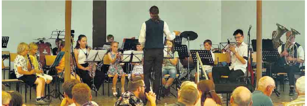
Das Windecker Nachwuchsorchester.