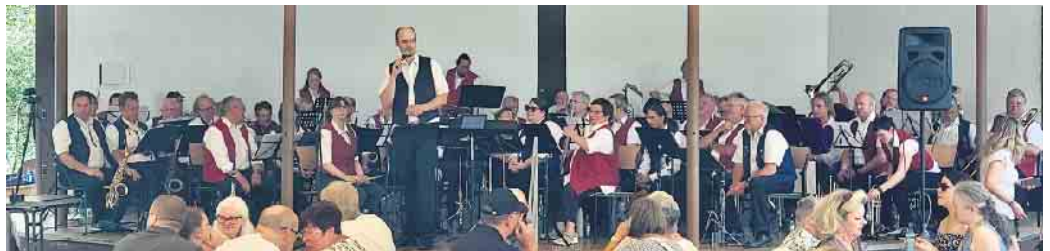
Die drei Windecker Blasorchester gemeinsam auf der Bühne.