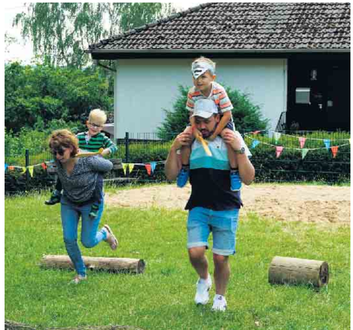
Spannende Ritterrennen durften nicht fehlen

schieden sich für ihre Tätigkeit und dann ging es auch schon los. Unsere Themenfindungsgruppe traf sich und sammelte lustige Ideen, welches Sommerfest wir feiern könnten. Ritterfest, Blumenfest, Dschungelfest, Dinofest und ein Fest aus allem stand zur Auswahl. Und das Ergebnis stand schnell fest: Wir feiern das Allerlei-Sommerfest! Ein Fest aus allen Festen. Dann gingen die Vorbereitungen los, es wurden Ideen für die Aktivitäten gesammelt, es wurde diskutiert, es wurde gelacht, es wurde die Buffetvielfalt überlegt, es wurde gebastelt, ein Sommerfestlied wurde ausgesucht und ein Tanz kreiert und und und. Natürlich gab es auch Überraschungen für die fleißigen Kinder: Es gab tolle Preise zu gewinnen und ein Clown formte viele lustige Luftballongestalten für die Kinder.