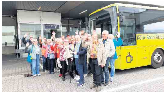
Die Senioren Union Windeck zu Besuch am Flughafen Köln/Bonn.

Fast jeden Monat bietet die Senioren Union Windeck eine Aktivität an. Unsere Ausflüge und Vorträge stehen für jeden Interessierten offen. Vielleicht möchten auch Sie einmal mit uns eine Be-