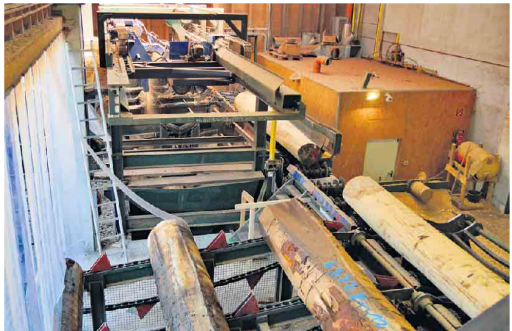
Furnierbäume bei der Verarbeitung.

ein Kunstwerk mit Unikatgarantie. IFN/DS Initiative Furnier + Natur (IFN) e.V. Weitere Infos zum Thema Furnier unter www.furnier.de oder www.furniergeschichten.de sowie auf Instagram unter #furnier_und_natur