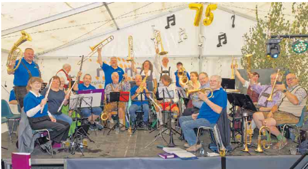
Oktoberfeststimmung im Festzelt.