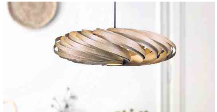
Mit Furnierleuchten wird jeder Raum aufgewertet.