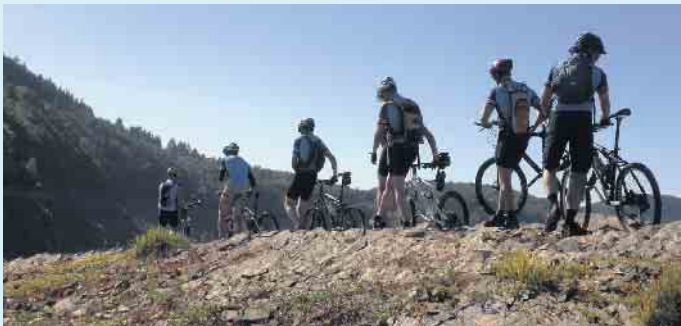
Biketour zum Edersee

Die gelb gekennzeichneten Wege machen den Hauptweg ersichtlich, die schwarzen Höhenflug-Schilder kennzeichnen die Zuwege und die blauen die Rundwege. [BL]