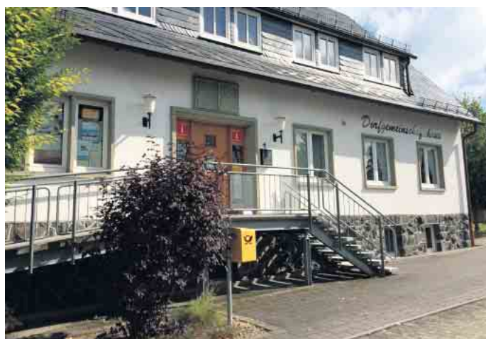
Das Josefshaus ist zentrale Aktionsstätte der Vereine in der Dorfgemeinschaft. Es soll von der Stadt Winterberg komplett übernommen werden.

Die Vereine des Dorfes berichten in der Dorf-App und auf den Vereinsseiten unter www.niedersfeld.info fortlaufend über die Geschehnisse an Ruhr & Hille.