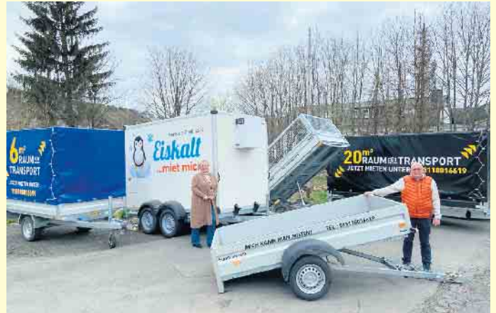
Christiane und Michael Naehring von der „CM Vermietung und Verkauf Gbr“

es sich um einen 2-Achsen Kühlanhänger (1 x 2,5 t), einen 2-Achsen Planenanhängen (1 x 4.100 x 1.800.1.900,1 x 2,7 t), einen elektrischen Rückwärtskipper mit Stahlgitteraufsatz (1 x 1,5 t), einen Einachser mit Plane (2.300 x 1.500 x 1.800. 1 1 x 750 kg) und einen Einachser Kipper (2500 x 1300 x 300). Ganz neu ist nun auch ein Anhänger für Maschinen- und Fahrzeugtransporte hinzugekommen. Miete ab 25,- € pro Tag, genaue Auskunft per Mail