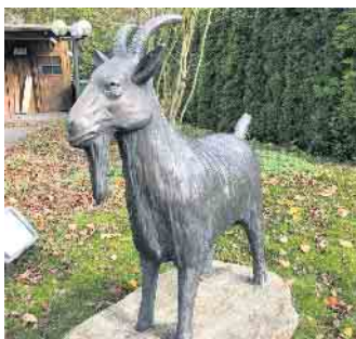
Die Niedersfelder Hitten waren und bleiben aktiv für das Dorf.

Gutes aus der Region, da steckt viel Herzblut drin!