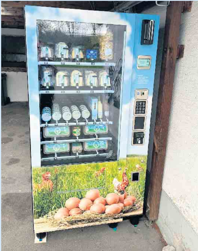
Die neue FOOD-BOX von Kaiser's Bio Ei mit Bio- und regionalen Produkten in der Nuhnestr. 25 in Hallenberg

Bio- und regionale Produkte rund um die Uhr