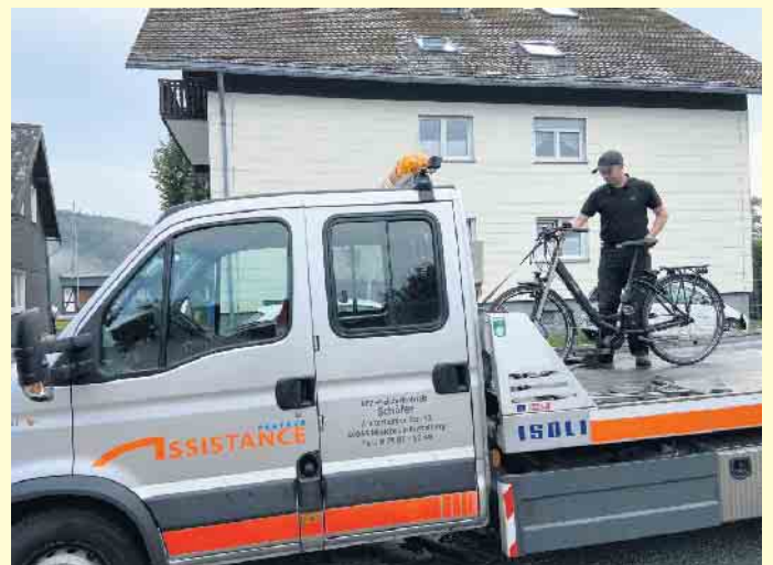
Hilfe bei Pannen- auch für E-Bikes vom Kfz-Meisterbetrieb Schäfer

DEKRA mittwochs + freitags HU und AU im Hause.