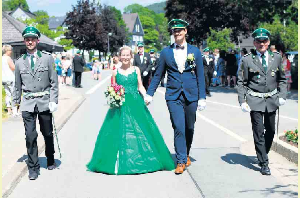
König 2023.

Danach heißt es „Horrido!“ und ran an die Gewehre. Zunächst wird ein neuer Jungschützenkönig ausgeschossen und danach beginnt der Wettstreit unter den älteren Schützenbrüdern.