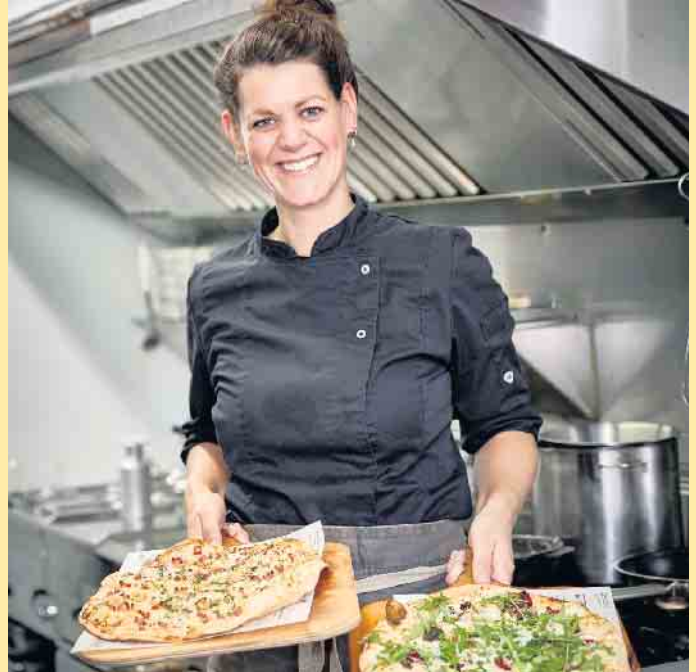
Leckeres aus der Küche in der Nordhang Jause

der Hochsauerland Höhenstraße, zwischen Winterberg und Altastenberg gelegen. Altbewährte Hüttenatmosphäre mit herzhaften Speisen und Brotzeiten gehören genauso zum neuen Jausen Konzept wie die im alpenländischen Stil ergänzte Almhütte, die für gemütliche Hüttenabende mit Livemusik, Après Ski, sowie verschiedene Veranstaltungen als einzigartige Erweiterung zählt. Egal ob gemütliche Stunden auf der Sonnenterrasse genießen, oder ausgelassene Hüttenabende am knisternden Holzfeuer des Bullerjahn! Tradition verbindet. Gutbürgerliche Küche und familiäre Atmosphäre. So präsentiert sich die ursprüngliche Nordhang Jause schon länger als drei Jahrzehnte. 120 zusätzliche Sitzplätze befinden sich auf der Sonnenterrasse im Außenbereich sowie 90 Sitzplätze in der neuen Almhütte. Wir freuen uns über Deinen Besuch! [BL]