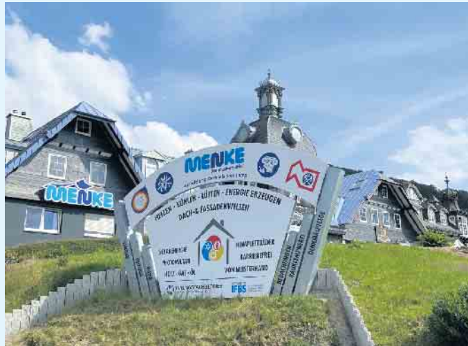
Der Meisterbetrieb Menke in Winterberg-Siedlinghausen

Meistens wird eine solche Anlage mit einem anderen Heizsystem kombiniert, weil die Effizienz der Solarthermieanlage aufgrund des wechselnden Wetters natürlich schwanken kann. Durch so eine Kombination wird das Haus auch mit Wärme versorgt, wenn die Solarthermieanlage den