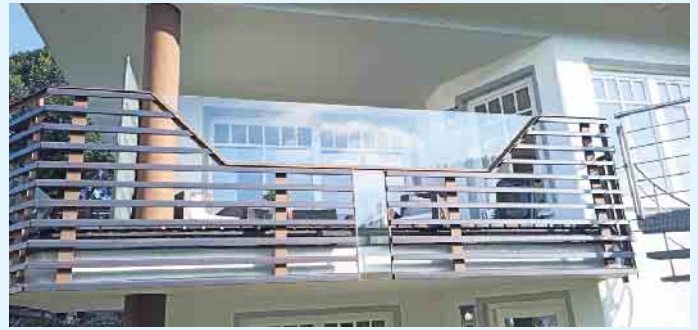
Moderne Balkongestaltung von Tischlerei Holztec