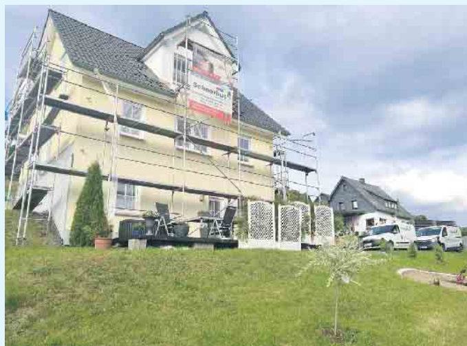
Fassadenarbeiten vom Malerbetrieb Schnorbus