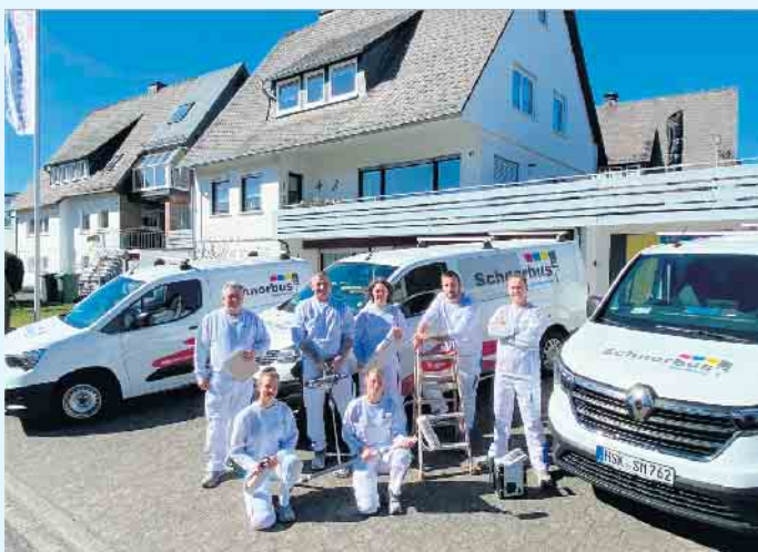
Das junge, dynamische Team vom Malerbetrieb Schnorbus aus Züschchen