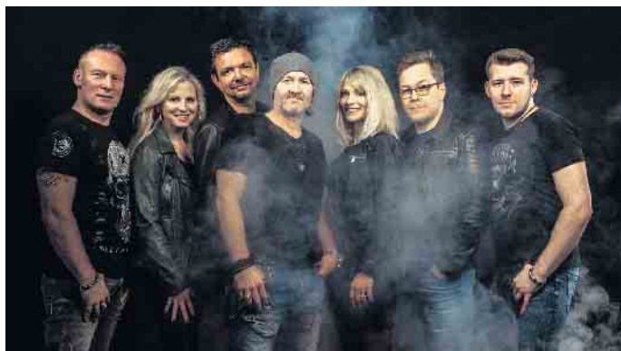
Band Second Hand

Stadtmarketing Winterberg lädt zum musikalischen Sundowner an die Konzertmuschel im Aktiv- und Vitalpark / Auftakt mit Irish Folk am 23. Juli