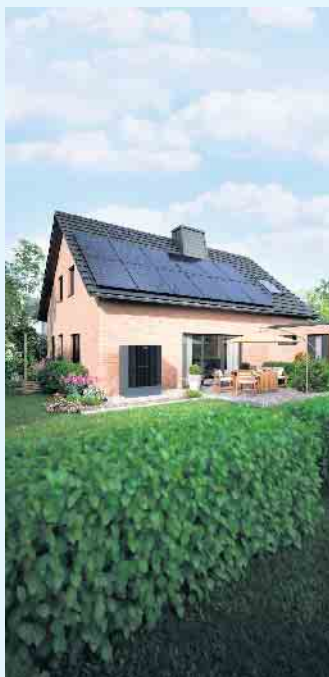
Modernes Einfamilienhaus mit PV-Anlage zur eigenen Stromversorgung

Wir können die unerschöpfliche und sehr effektive Energiequelle aus Sonneneinstrahlung für uns nutzen. - Optimal durch die Installation einer Photovoltaikanlage, auch „PV-Anlage“ genannt. Sie wandelt die Energie der Sonne in Strom um. Eine Anschaffung einer solchen Anlage rechnet sich für Sie und die Umwelt, denn Photovoltaikanlagen gewinnen anstatt Wärme kostenfreien Strom aus Sonnenenergie um das Eigenheim zu versorgen. Der erzeugte Strom lässt sich auch in das öffentliche Stromnetz einspeisen. Moderne Anlagen sind mit einem Speicher ausgestattet, sodass der erzeugte Strom gespeichert wird, bis er im Haus gerade gebraucht wird. Der Meisterbetrieb Menke berät Sie gerne rund um das Thema Solar. [BL]