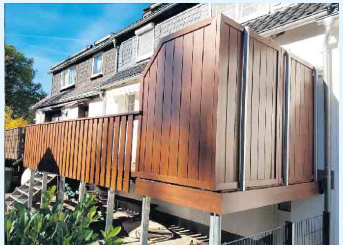
Balkon-/Terrassengestaltung in Holzoptik