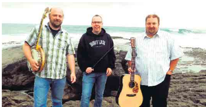
Band TH Stokes (Foto: (c) Veranstalter)

Den Auftakt macht am 23. Juli die gefeierte Irish-Folk-Band The Stokes, die mit authentischen Klängen und traditionellem Singalong das Publikum begeistert. Von der Fachpresse als „die Einzigen legitimen Nachfolger der Dubliners“ gehandelt, haben die drei Barden der „Stokes“, die sich unaufhörlich gegen die Verramschung der irischen Folklore zur Massenware stemmen, fast zwei volle Jahrzehnt erreicht.