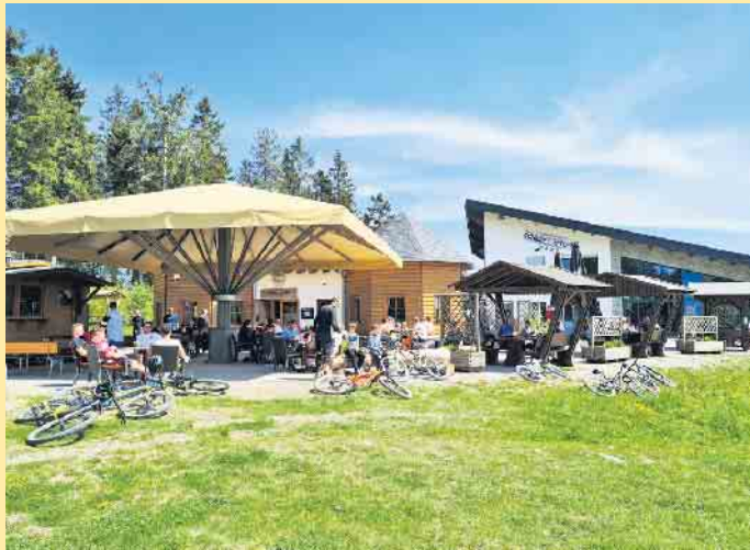
Einladende Terrasse im Grünen am Schneewittchen-Haus

Auf eine der schönsten Aussichtsterrassen von Winterberg