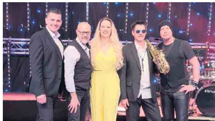
Band Concorde (Foto: (c) Veranstalter)

Mitten im Sauerland alle Einwohner und Gäste gleichermaßen erneut zum seit vielen Jahren beliebten „Sparkassen Open Air“ ein! Ein musikalisches Highlight, das die Sommerabende an drei aufeinander folgenden Mittwoch-