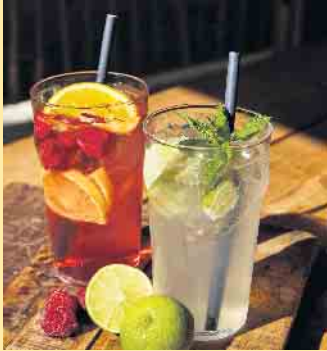
Kühle Sommerdrinks aus der Nordhang Jause

Hereinspaziert und wohlfühlen in der neuen Location mit Flair und Gemütlichkeit, der Nordhang Jause, direkt am Fuße des Kahlen Asten, wo das Sauerland am „höchsten“ ist! Hier lässt es sich gut einkehren und verweilen auf einer Wandertour oder einem Bikeausflug. Hüttenflair genießen in zentraler Lage, direkt an