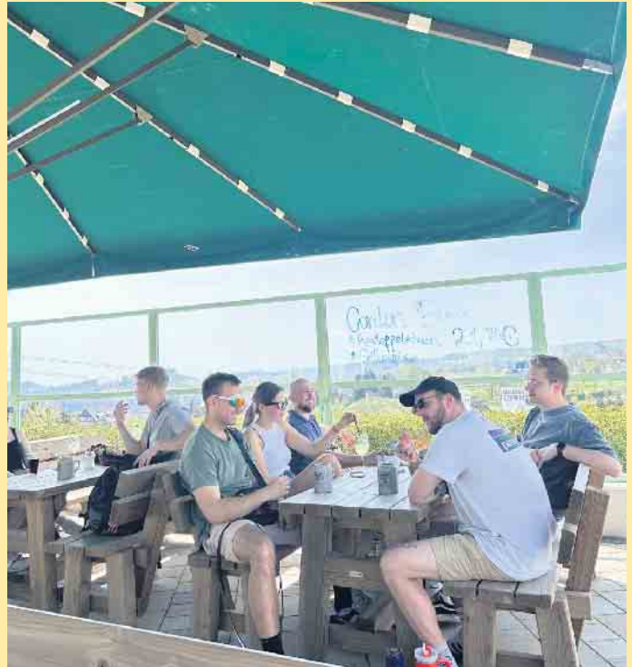
Gemütliche Terrasse mit Weitsicht am Fuß der St. Georg Sprungschanze

Schafe und Kaninchen in unserem Streichelzoo auf Eure Kleinen. Auf unserer Terrasse kann man aber auch ganz einfach dem Treiben nur zuschauen und an der Ostwand des Kahlen Asten vorbei den Blick in die Ferne schweifen lassen. Ein weiterer Blick in unsere Karte und schon zaubert unser Küchenteam Euch auch noch etwas Leckeres auf den Teller. Damit Ihr bei größeren Gruppen auch ausreichend Platz habt, empfehlen wir eine rechtzeitige