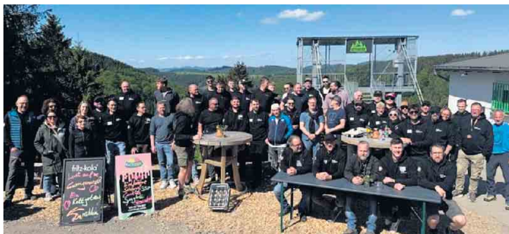
Ob Familie, Verein, Unternehmen oder Freundeskreis - bei Gruppenreisen hat die Ferienwelt Winterberg mit Hallenberg viel zu bieten.